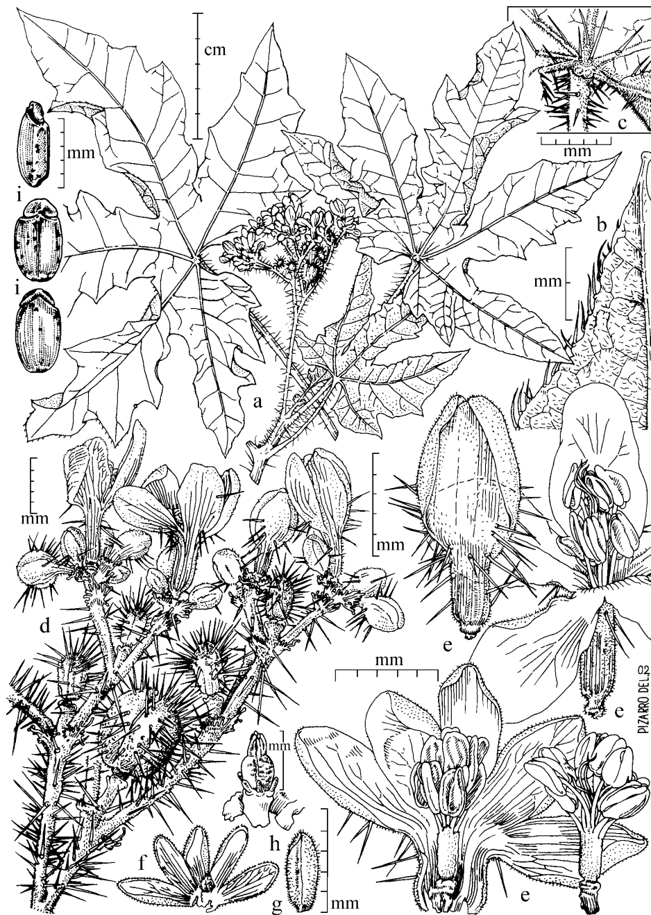
LÁMINA I. Cnidoscolus cajamarcensis Fdez. Casas. & Pizarro. J. Campos 2003 (MO 5294791, holótipo). a) Ramo fértil con hojas. b) Ápice foliar (envés). c) Gándulas acropetiolares. d) Inflorescencia con flores y frutos. e) Flores masculinas abiertas, botón y androceo. f) Flor femenina. g) Botón de flor femenina. h) Gineceo. i) Semillas, de arriba abajo en vista lateral, ventral y dorsal respectivamente.