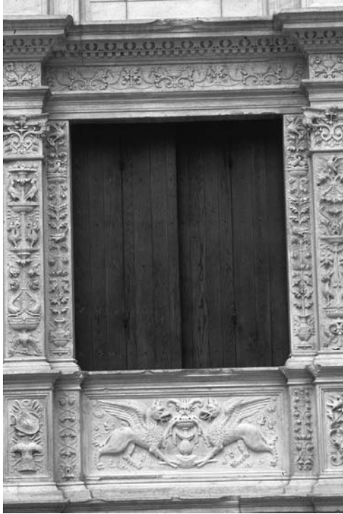
VENTANA DECORADA CON GRUTESCOS, CORRESPONDIENTE AL ALA OESTE. MUSEO METROPOLITANO DE NUEVA YORK.

marcarán las estrategias de difusión e interpretación del castillo, dentro del proyecto global del Plan Director: