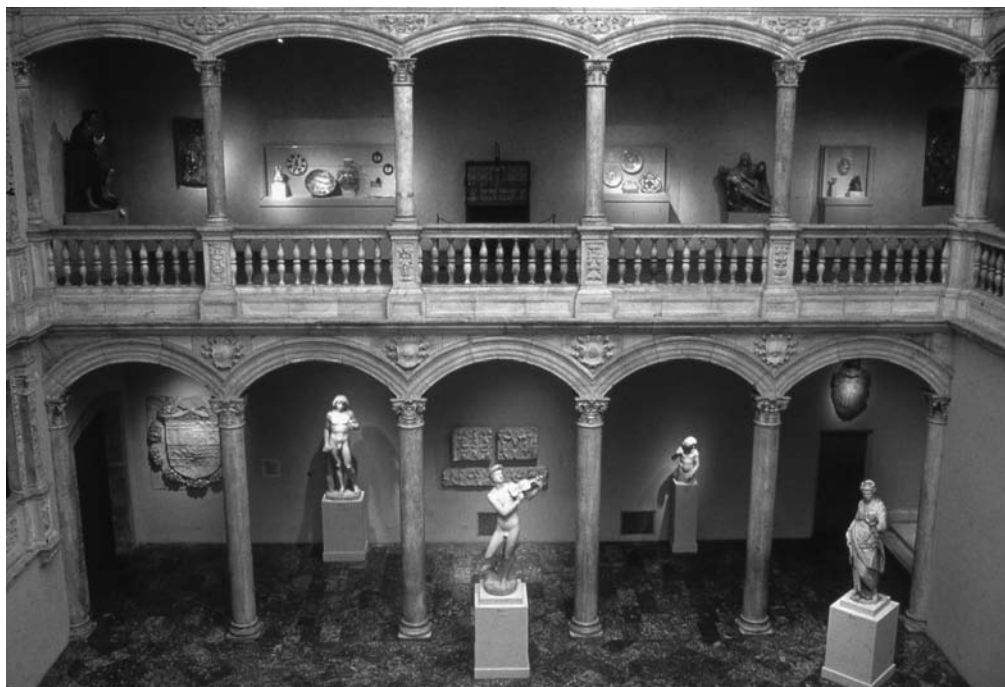
ALA SUR DEL PATIO DE HONOR, INSTALADO EN EL MUSEO METROPOLITANO.

de todo el País Vasco. La rehabilitación del castillo (continente) y el proyecto interpretativo futuro junto con los propios valores culturales y artísticos del monumento (contenido), deben servir de catalizador de la cultura y el turismo de Vélez Blanco y toda la comarca.