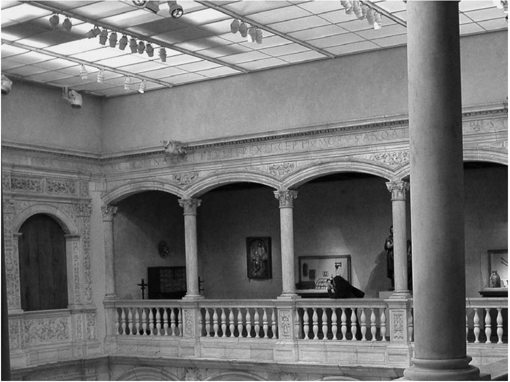
PATIO DE HONOR INSTALADO EN EL MUSEO METROPOLITANO DE NUEVA YORK.