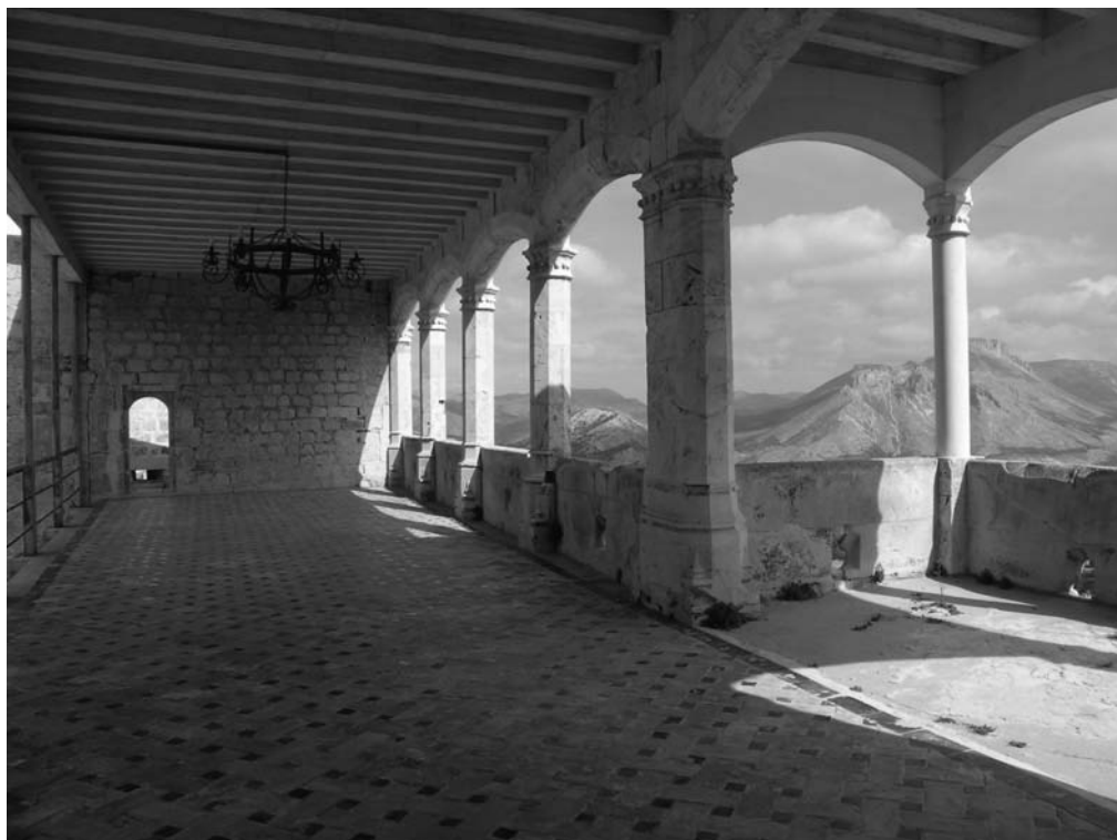
MIRADOR DEL ALA ESTE.

La reunión inicial tuvo lugar el 21 de Febrero de 2006 en la propia Delegación, y desde este primer momento se perfilaron una serie de actividades basadas en la colaboración entre todas las instituciones, pero con un esfuerzo organizativo y presupuestario de la Consejería de Cultura, que ha aportado 120.000 euros, cantidad significativa cuando no nos referimos a actuaciones constructivas y técnicas.