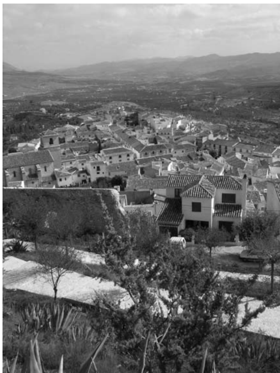
VISTA DE VÉLEZ BLANCO A SUS PIES.

Ese objetivo debe ser asumido desde la gestión patrimonial, o conjunto de actuaciones programadas para conseguir una óptima conservación de los bienes patrimoniales y un uso de estos bienes adecuado a las exigencias sociales contemporáneas 7 .