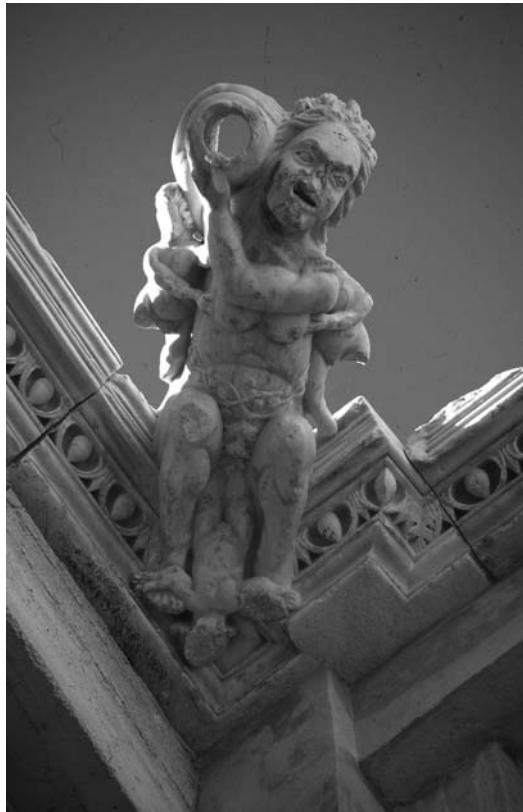
GÁRGOLA ORIGINAL CONSERVADA EN EL PATIO

histórica con nuestro municipio velezano. También podemos citar el “Museo de la frontera y los castillos” en Olvera (Cádiz). Los castillos adquieren así un protagonismo específico como producto cultural de uso turístico 25 .