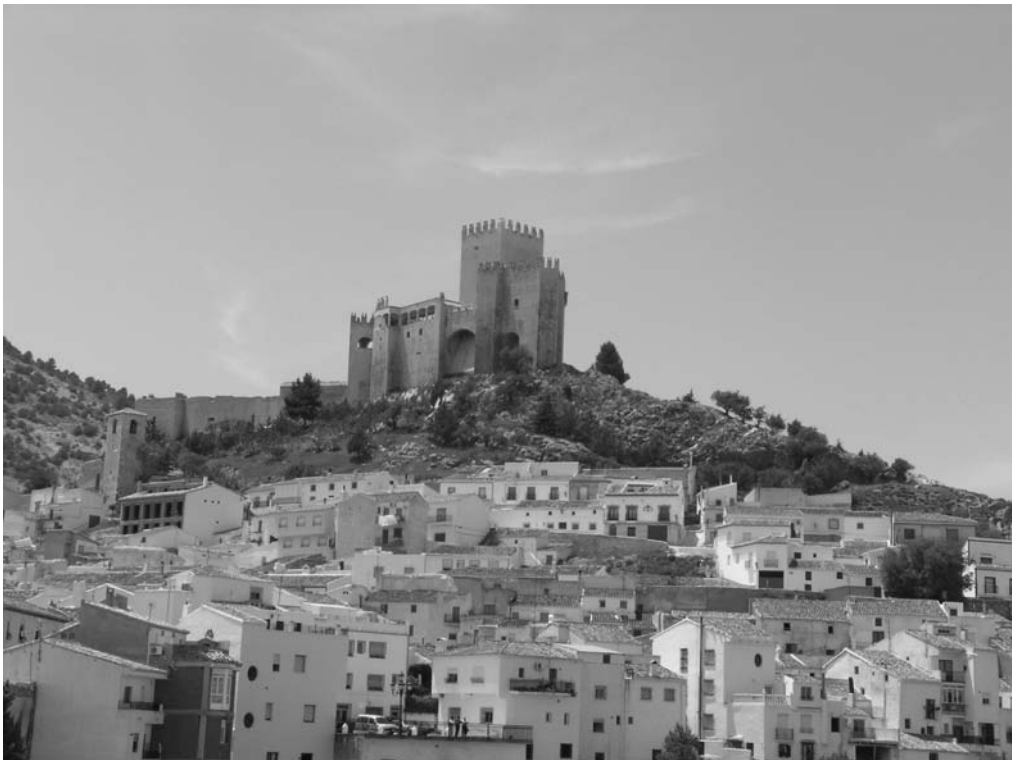
ESPECTACULAR IMAGEN DEL CASTILLO DOMINANDO EL HORIZONTE