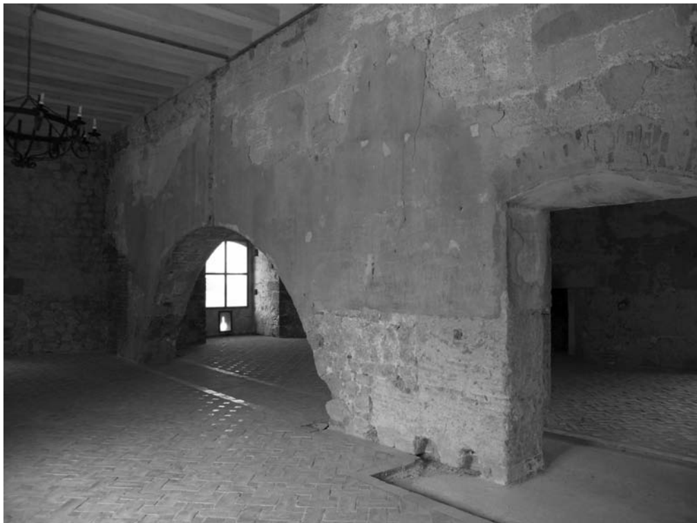
SALONES DEL TRIUNFO Y LA MITOLOGÍA, HOY VACÍOS, PERO QUE DEBERÁN INCORPORAR UN CONTENIDO INTERPRETATIVO TRAS LA REHABILITACIÓN.

tualmente alberga de manera temporal la inauguración de la exposición itinerante “El marquesado de Los Vélez. Señorío y poder en los reinos de Granada y Murcia”, contando además con dos maquetas del palacio-fortaleza, una general y otra de detalle del Patio de Honor y espacios anexos pero una reconstrucción idealizada de su equipamiento original. Cuando no haya exposiciones temporales albergará una exposición con los 9 paneles de la antigua caseta informativa habilitada en el exterior, todo ello con el objetivo de aportar al visitante una información general sobre el edificio y sus valor significativos.