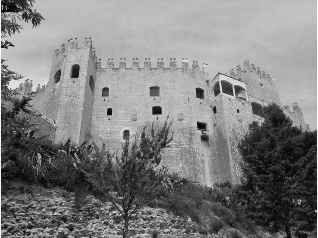
ATRACTIVA PERSPECTIVA DE SU ARQUITECTURA MILITAR.