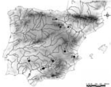
Figura 2.- Mapa de dispersión de los signa equitum ibéricos (□) y celtibéricos (▣): 1, zona de Iniesta; 2, La Bastida de les Alcuses (Mogente, Valencia); 3, provincia de Jaén; 4-5, zona de Espejo (Córdoba); 6, Montilla (Córdoba); 7, Hornachuelos (Aldea del Fresno, Badajoz); 8-14, Numancia (Soria); 15, Arce Mirapérez (Miranda de Ebro, Burgos); 16, alrededores de Borja (Zaragoza). (Según Almagro-Gorbea y Lorrio, e.p.).

No obstante, el ejemplar mejor conservado es el llamado “Jinete del Museo de Cuenca” (Lorrio y Almagro-Gorbea, 2004-2005; Almagro-Gorbea y Lorrio, e.p.), hallazgo procedente del expolio de una tumba ibérica de la zona sur de la provincia de Cuenca. El jinete desnudo presenta, como el ejemplar de La Bastida, con un casco jonio-ibérico con alta cimera, mientras que el caballo, en actitud de descanso, está embreadado y lleva un elegante tocado a modo de creciente que oculta las orejas, alzándose sobre dos pares de volutas, que cabe interpretar como la esquematización de sendos capiteles protoeólicos, que surgen desde las esquinas de una plataforma horizontal, de forma rectangular, sostenida, a su vez, por un vástago