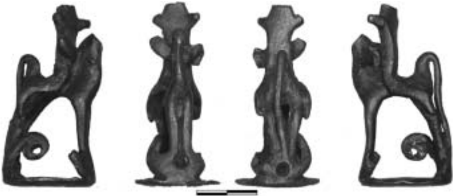
Figura 1.- “Jinete de Montilla”.

1. El “Jinete de Montilla”. Representa a un personaje desnudo, al que le falta la cabeza y los brazos, en po-