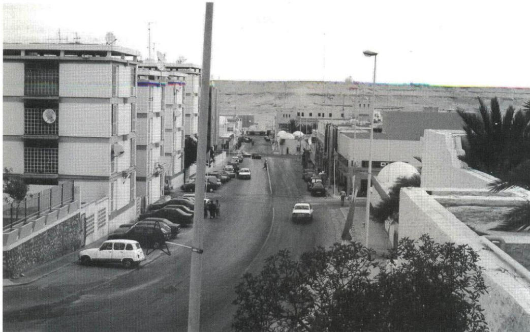
Aaiun en julio de 1998

dos y 53 desaparecidos. La situación en los meses de agosto y septiembre de 1957 queda perfectamente definida por el Gobernador del territorio al afirmar que “Se está creando una fuerza enemiga que ya hoy es posible sea superior a la nuestra y que con los medios de que dispongo no puedo combatir. A Alcubilla (jefe del E.M.C.) le escribí pidiendo medios en personal y transportes, aunque, por lo que me contestó, no parecen muy propicios a dárme los. A esta gente no se les echa como no sea por la fuerza. Poneros de acuerdo con el Ministerio del Ejército y hacer todo lo posible para proporcionarme medios” .