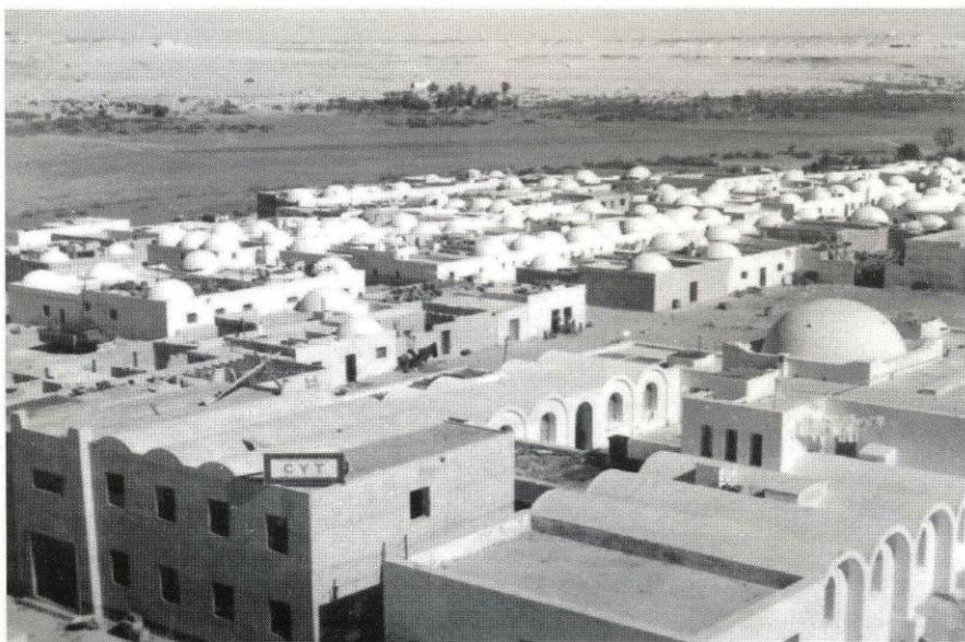
El Aaiun en la década de los 60

Esta extensión de la presencia española supuso el inicio de un proceso que cambió por completo la configuración social y las relaciones económicas hasta entonces vigentes en el Sahara. Del nomadeo se pasaría progresivamente, aunque de forma lenta a la sedentarización de los saharauis, y así lo refleja el censo del año 1974, donde el 82% de la población indígena se encuentra establecida de forma fija en distintos núcleos urbanos. En resumen, tal y como señala Emilio Ontañón, "España no se interesó realmente por el Sahara hasta