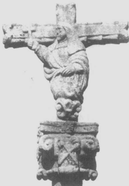
Fig. 2.- Cruceiro do Campo das bailas: Santa Xoana. A flor de lis que lle fai de peaña que-re dicir que se trata dunha santa nobre francesa.

Atópase esta parroquia a medio camiño entre Santiago de Compostela e Noia, na vereia real (hoxe estrada) que une ámbalas dúas poboacións, e pola que transitaban os peregrinos que chegaban por mar ata o porto noiés. Pertenceu á histórica "terra de Santiago", dependendo no civil da xurisdicción de Quinta, e no relixioso do