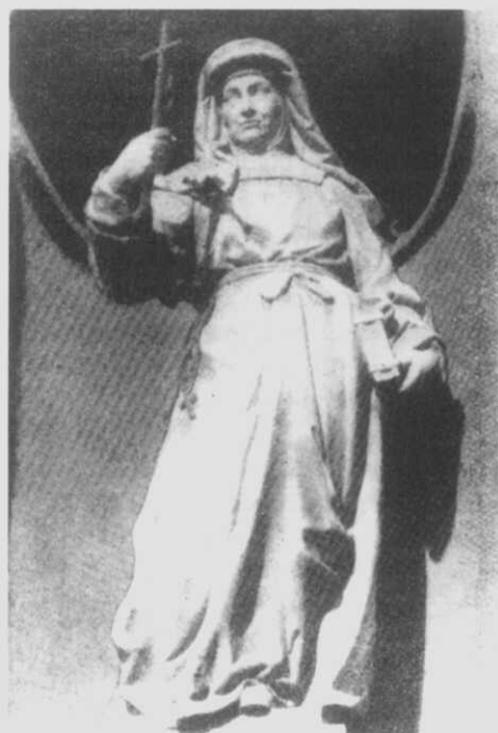
Fig. 5.- Santa Xoana de Chantal, fachada da igrexa das Salesas Reales de Madrid, obra do italiano Domingo Olivieri (faleceu no 1762).

Neste caso trátase dun cruceiro de capela, é dicir, que no lugar do capitel ten un pequeno oco onde se acubilla unha imaxe, polo xeral (como no presente caso) da Virxe. Estes cruceiros só se achan en parte das terras delimitadas polas rías de Arousa