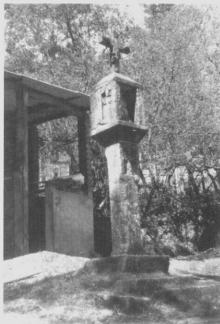
Fig. 3.- Urdilde: cruceiro de Carabeles.

¿Quen pagaría a súa labra e mandaría que figurasen estas imaxes e non outras? Coidamos que o máis vello, que é o que