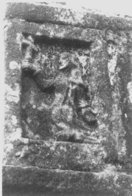
Fig. 4.- Cruceiro de Carabeles: "S. Gvana". O que debaixo dunha imaxe se lle poña o nome indica que se trata dun santo pouco popular, descoñecido para os veciños.

O capitel é bo: de catro caras con volutas angulares, e no medio de cada unha, unha figuriña: debaixo de Cristo, un santo axionllado que poidera ser San Francisco amosando os estigmas; o seguinte é San