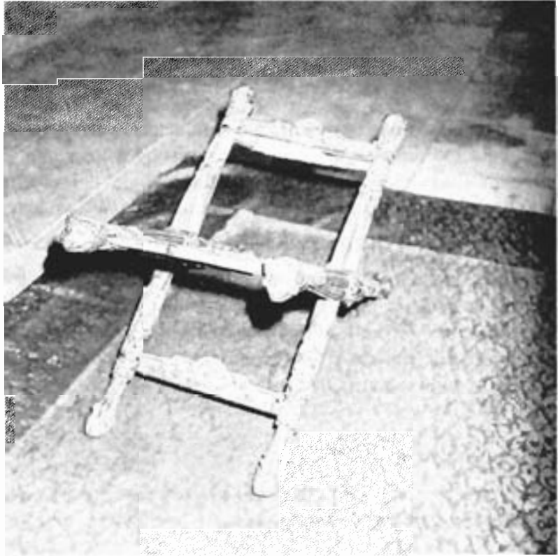
Silla de San Ramón. Destruída.