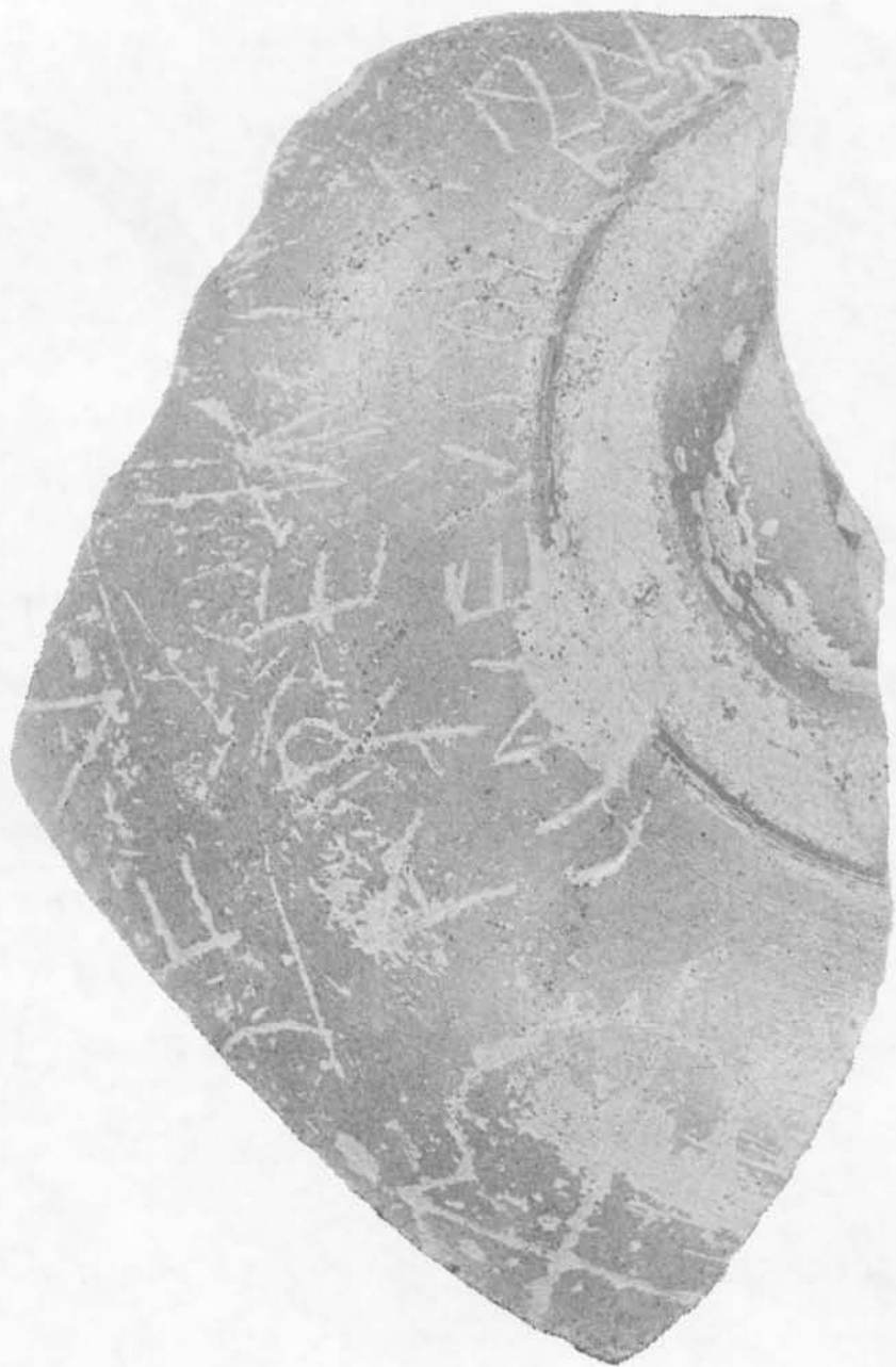
"Lucernas romanas de la necrópolis de Palencia con marca de ceramista"