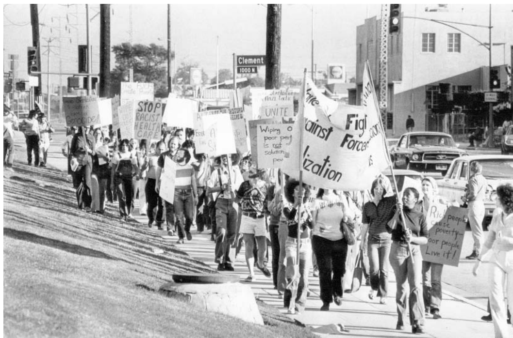
Figura 3. PROTESTA EN LOS ÁNGELES CONTRA LAS ESTERILIZACIONES FORZADAS FRENTE AL HOSPITAL PARA MUJERES DE LA UNIVERSIDAD DE CALIFORNIA DEL SUR - HOSPITAL GENERAL DEL CONDADO DE CALIFORNIA, 1974.