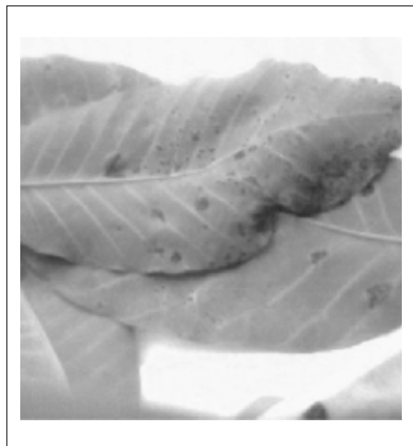
Figura 2. Foliolos en estadio C del clon PB-260 infectados con M. ulei .

Inoculaciones realizadas sobre discos de hojas de clones de Hevea resistentes y susceptibles indican que la germinación de los conidios así como la penetración micelial entre las células de la hoja ocurren en ambos tipos de clones. La aparición de las lesiones surge al quinto día después de la inoculación y éstas sólo se presentan en hospederos susceptibles. El aumento de lesiones se observa entre el quinto y el sexto día así como la esporulación, la cantidad de esporas varía con el tipo de clon. (Hashim and Pereira, 1989). Las estructuras estromáticas pueden llegar a aparecer después de 15 días en los clones más susceptibles (García, et ál., 1995).