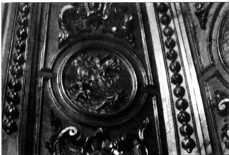
Figura 5. José de Ganga. Retablo de la capilla del Rosario de Lorca. Detalles del cascarón.