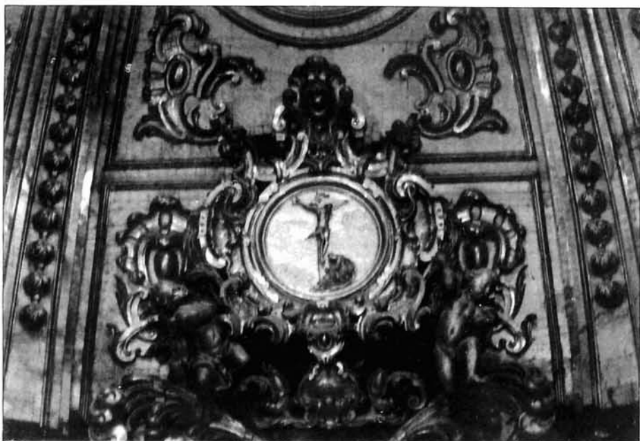
Figura 4. José de Ganga. Retablo de la capilla del Rosario de Lorca. Detalle del cascarón.