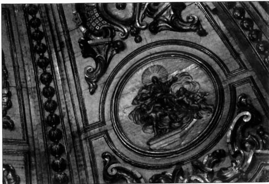
Figura 6. José de Ganga. Retablo de la capilla del Rosario de Lorca. Detalles del cascarón.