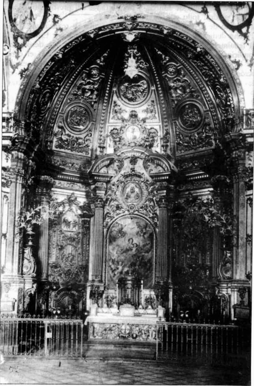
Figura 1. José de Ganga. Retablo de la capilla del Rosario de Lorca.