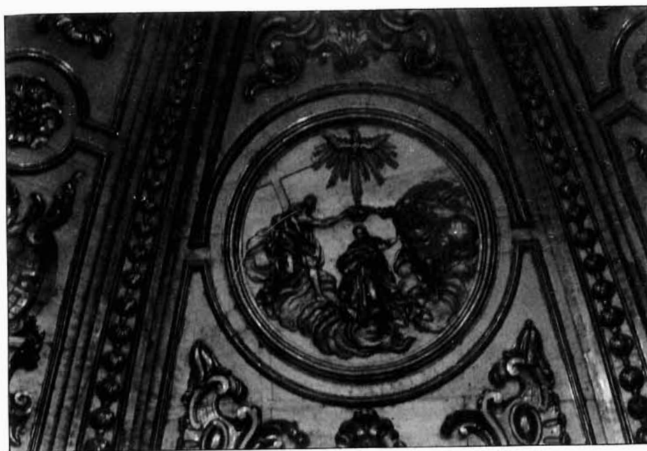
Figura 7. José de Ganga. Retablo de la capilla del Rosario de Lorca. Detalles del cascarón.