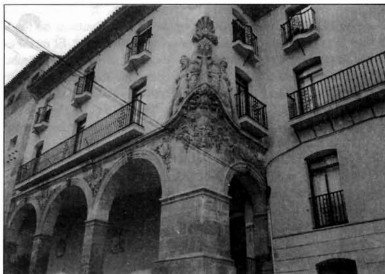
Figura 7. Antiguas Verdulerías, hoy Juzgados. Lorca.

Uzeta pudo haber participado, en 1729, en la decoración ornamental del claustro nuevo del Convento de la Merced de Lorca, todavía existente en la actualidad. La obra de cantería de este claustro fue realizada por el cantero Pedro Bravo Morata.