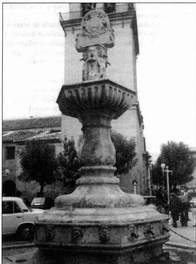
Figura 6. Fuente de Totana, Murcia.

continuidad que sirve de frontera arquitectónica natural a un centro resumido en un espacio con marco romboidal partido por cartela central. Dicho espacio sirve también de pedestal a la hornacina que realiza el remate de todo el conjunto. El centro de la cartela muestra el anagrama de María con corona y toda aquella está rodeada de motivos vegetales enlazados a dos cabecitas de querubines esculpidas de perfil que se apoyan en trozos de cornisa. Un ramaje, casi palmeta, corona la cartela. Los espacios laterales de dicho interpedestal muestran también una decoración vegetal con pseudoveneras 21 .