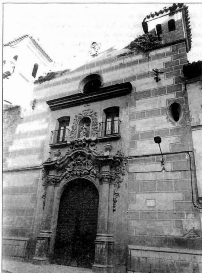
Figura 3. Fachada de la Capilla del Rosario. Lorca.

«contenían el mapa y diseño que está en su poder» 11 . A pesar de lo expuesto, es también posible que Bravo Morata fuese el diseñador ya que en esta faceta no era desconocido al haber presentado posteriormente un diseño para las Salas Capitulares de la Colegiata de San Patricio, aunque este nunca llegó a realizarse 12 . Dicho arquitecto y Juan de Uzeta trabajaron juntos efectivamente en las dichas Salas Capitulares en 1747, como veremos más adelante, pero conforme al proyecto del escultor y tallista Nicolás de Rueda.