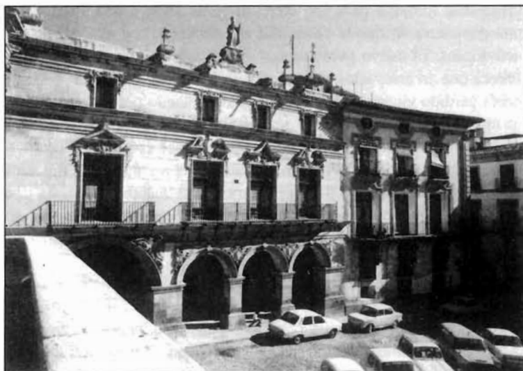
Figura 4. Salas Capitulares de S. Patricio. Lorca

La cartela oblonga de las enjutas de la arquería está ennoblecida por un exuberante marco vegetal, tipo cornucopia, cuyas carnosas hojas de acanto se proyectan en sus laterales llenando prácticamente el espacio vacío equidistante entre los arcos. Creemos que la parte central de dicho motivo debe valorarse como la trasposición al material de ejecución de una piedra preciosa, tallada admirablemente en la piedra, ya que nunca recibió texto ni emblemática alguna.