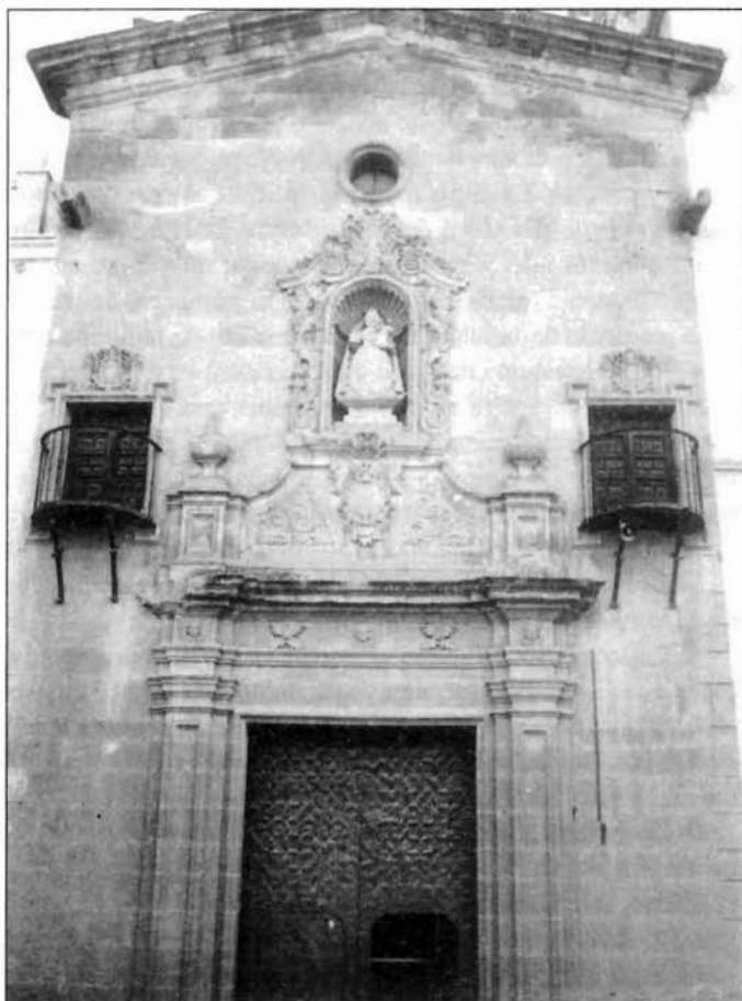
Figura 5. Portada de la Iglesia de San Lázaro. Alhama. Murcia.

en consecuencia, que este dúo de artífices trabajase en unión por varios puntos de la geografía murciana.