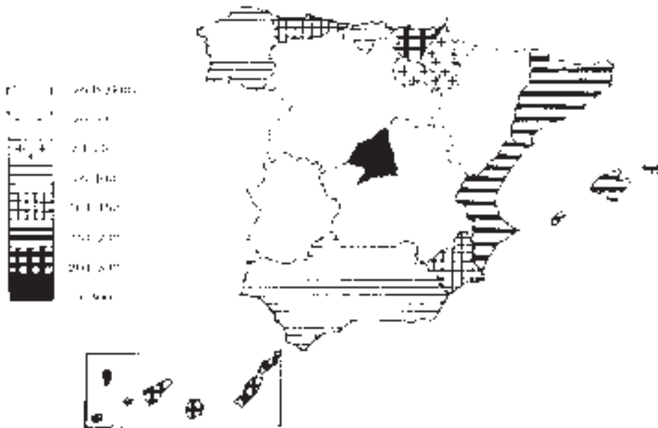
FIGURA 2. Densidad de población, 2000.

(Mella Márquez, J.M a , 1998). La carencia de una adecuada y suficiente política de planeamiento equilibrada ha ayudado a ese devenir desordenado. Si bien en algunos casos, la debilidad demográfica existente, se traduce en una elevación de los niveles de riqueza por persona, eso camufla la realidad, y, en el fondo, representa una debilidad cara a un futuro de desarrollo más armónico para todas las CC.AA.