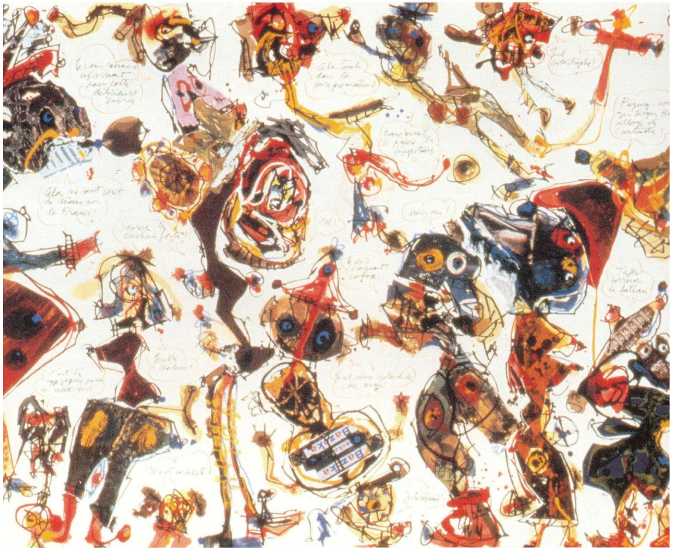
Antonio Saura: Cocktail party. 1975. Serigrafía y collage. 52 colores. 69,5x99 cm. Exposición de la Fundación Casa de la Moneda.

rios sobre temas de arte y literatura escritos por el Premio Cervantes en 1981 y Premio Nobel en 1990. Del texto dedicado a la revista Taller , cuyo primer número apareció en México en diciembre de 1938 y el último, en enero de 1941, alguno de cuyos números fueron dirigidos por Paz, se manifiesta en términos parecidos a los que acabamos de citar y por su interés, en lo referente al surrealismo copiamos en su totalidad. “Confundíamos al surrealismo con una escuela poética y artística; más exactamente: con una manera . Para comprender nuestra actitud deben recordarse dos circunstancias. Una de ellas: efectivamente ya había pasado el momento de apogeo del surrealismo; la manera , un poco después, triunfaría más y más sobre la ins-