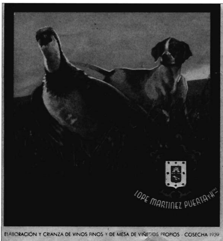
Lámina 5. Vino de Bullas (año 1939).