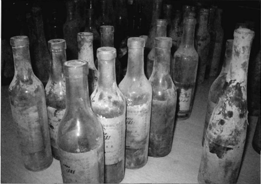
Lámina 4. Colección botellas de vino (segunda mitad del siglo XIX).