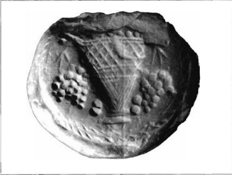
Lámina 6. Sello del Castellar (siglo I d.C.).