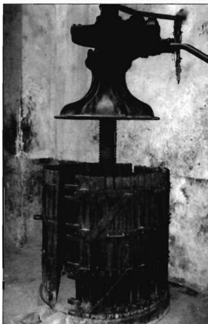
Lámina 3. Bodega de la calle Balsa.

Otra de las bodegas de propiedad municipal es la que se ubica en los sótanos de la casa de don Blas Marsilla; dispone de tres zonas diferenciadas, según la elaboración y destino del vino, así como todo tipo de instalaciones para manipular y almacenar los diversos productos del campo.