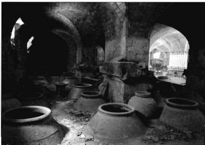
Lámina 1. Bodegas de la Casilla (en la actualidad, Museo del Vino de Bullas).

Las dos primeras acciones favorecieron la reconstrucción histórica de la actividad vitícola de Bullas; gran parte de los resultados obtenidos en estos trabajos han sido fruto de recientes publicaciones 3 , por lo que no vamos a redundar en lo ya presentado. Pero sí que nos interesa aquí revelar los frutos obtenidos en los dos últimos trabajos reseñados, a saber, el inventario de bodegas y el catálogo de herramientas del vino.