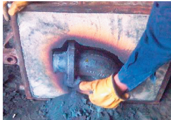
Figura 3. Desmoldeo Codo ByPass sistema arenas autofraguantes

El tiempo de desmoldeo de la pieza elaborada con el sistema actual es de 7.32 minutos, que en comparación con el sistema de arenas autofraguantes es 5.16 minutos, la ventaja del sistema propuesto ocurre porque la arena que esta alrededor de la pieza se incinera durante el vertimiento de la colada convirtiéndose en polvo, como se observa en la Figura 3.