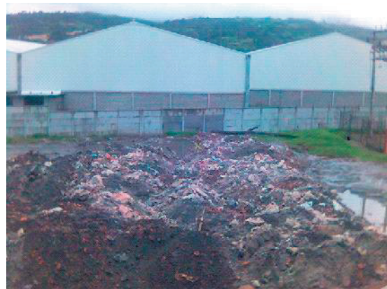
Figura 1. Impacto negativo por la dificultad para reutilizar la arena con CO 2 .

El endurecimiento del macho y el molde se hace por gasificación.