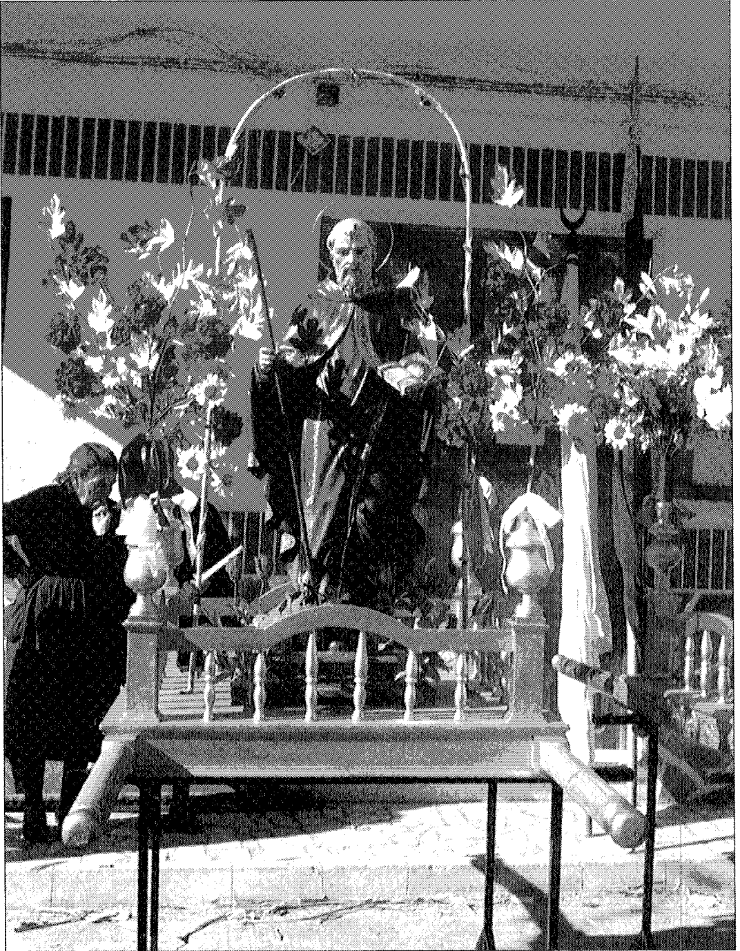
Fig. 6: Imagen de San Antón en Laroles (Granada).