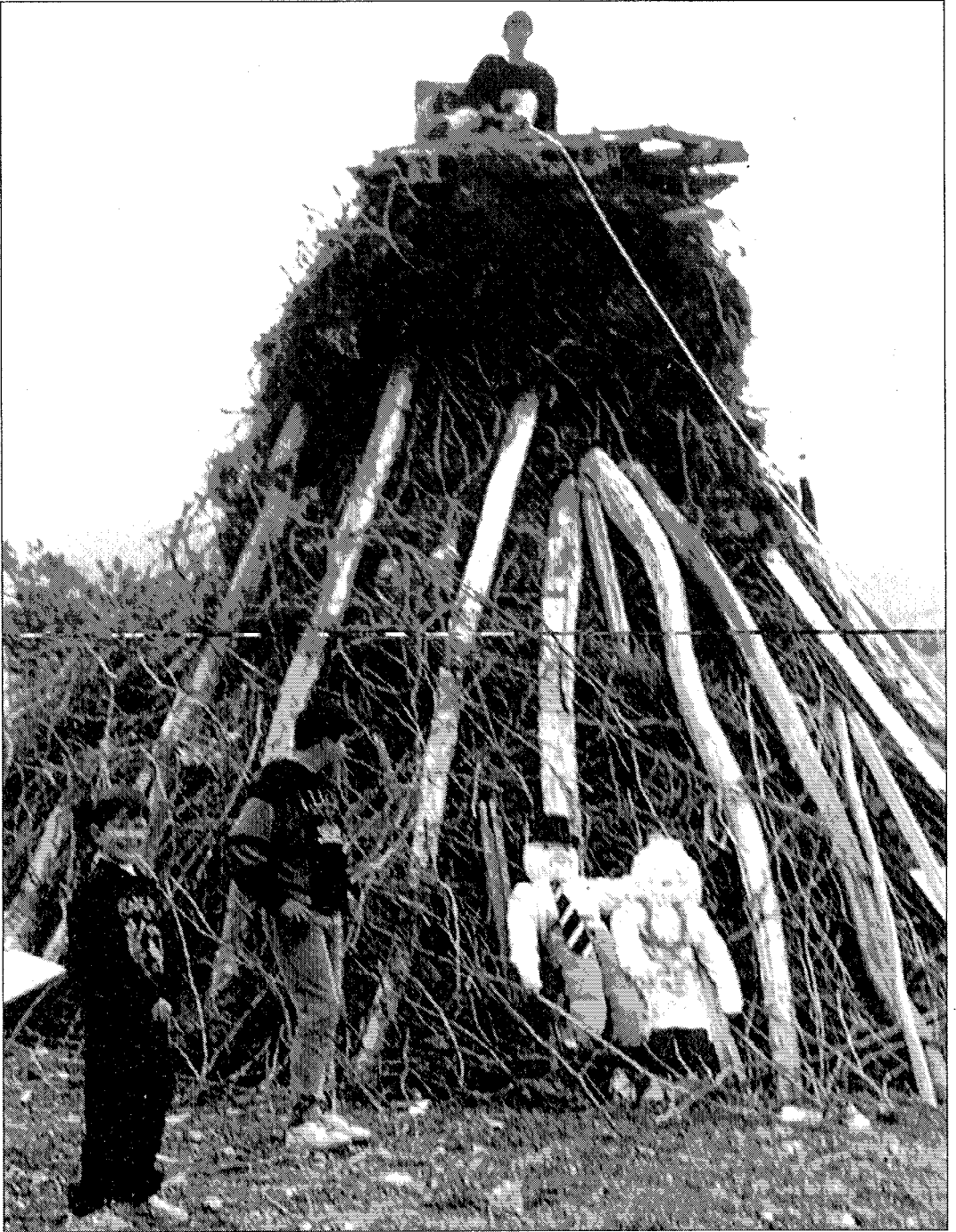
Fig. 1: Preparación de un “humarracho” en Berja (Almería).