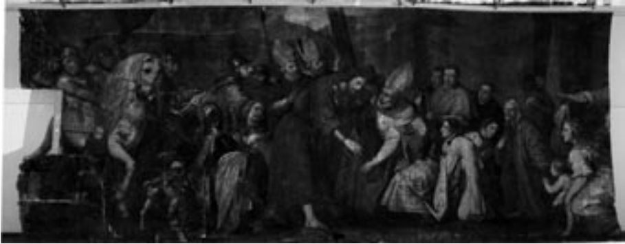
Aspecto general de la obra antes de la intervención