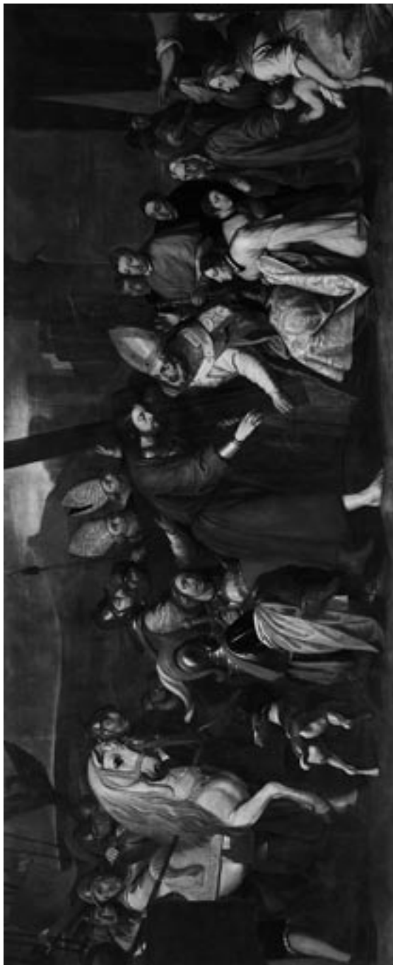
Aspecto general de la obra tras la restauración