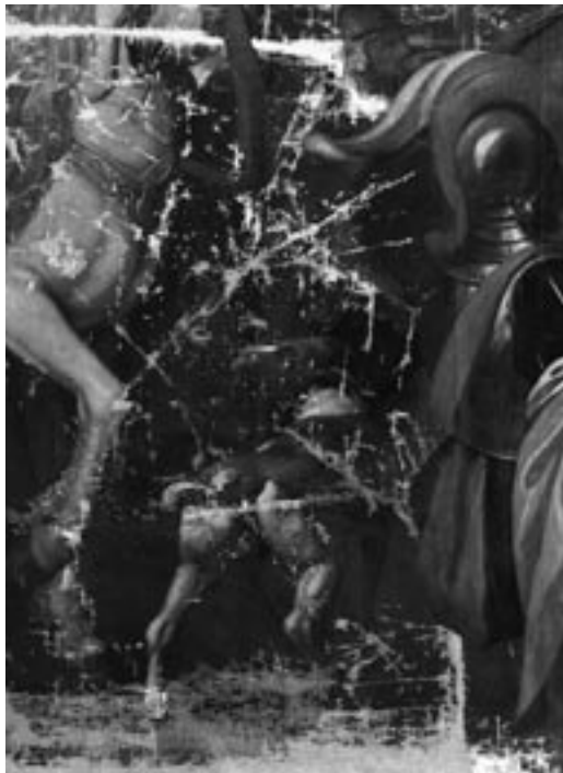
Reintegración del color con técnica del puntillismo y abstracción cromática