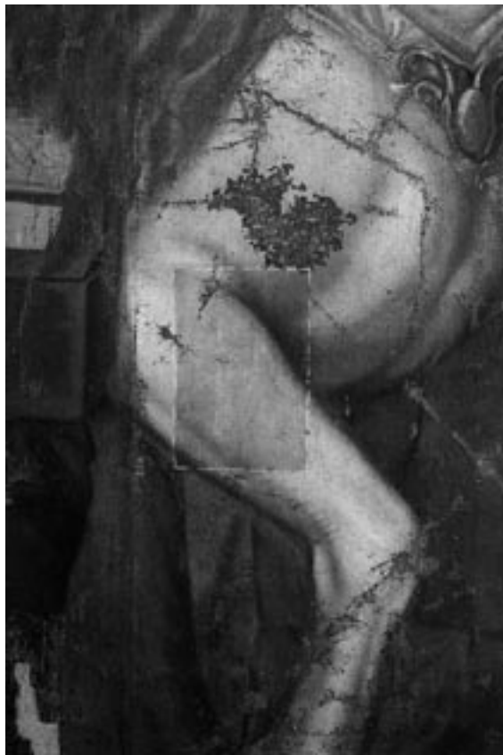
Cata de limpieza de la superficie pictórica