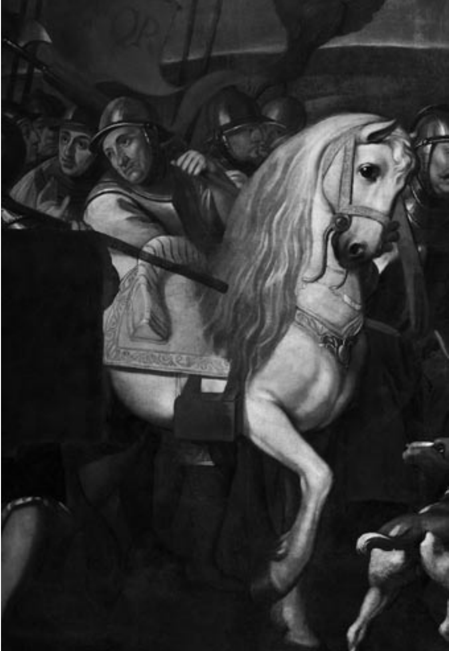
Detalle de la obra una vez finalizada la restauración