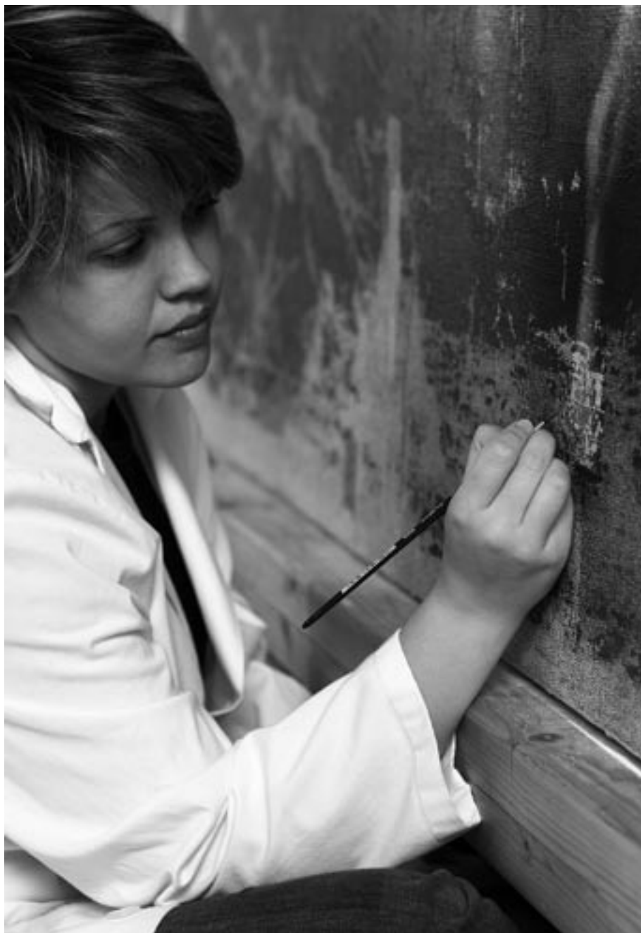
Proceso de reintegración del color