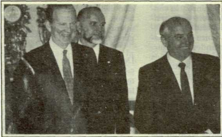
Shevardnadze, Baker y Gorbachov en el Kremlin.

En otras palabras, el gorbachovismo en la práctica no ha sido una tentativa de reforma del sistema soviético, sino que, como bien lo demuestran los acontecimientos presentes, ha optado por afianzar como única alternativa de desarrollo el modelo y la experiencia occidentales. Si anteriormente las tendencias igualitarias dominaban e impedían el surgimiento de un sector dirigente, las reformas gorbachovianas han destruido la armonía social, han favorecido el aumento de la desigualdad social y han creado las condiciones para que los nuevos sectores emergentes alcancen su modernidad a expensas de los grupos marginados. Las perspectivas de un descomunal desempleo con una frágil seguridad social deben ser interpretadas en este sentido. De aquí que el futuro próximo de la URSS haya de estar signado por el auge y consolidación de la clase media que tenderá a rechazar las demandas reivindicativas de los sectores populares, los cuales actualmente han perdido sus puntos de apoyo y sus referentes ideológicos.