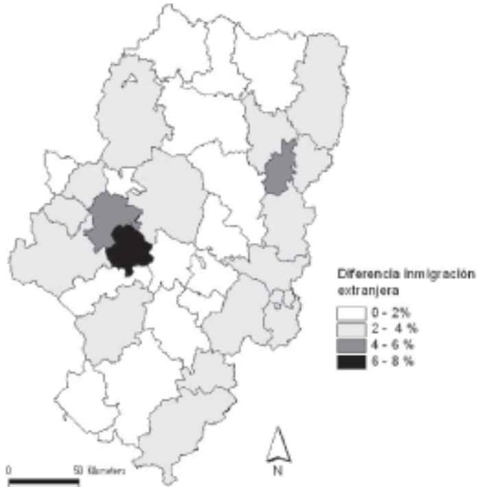
Figura 3. Diferencia de inmigración extranjera. 1991 y 2001