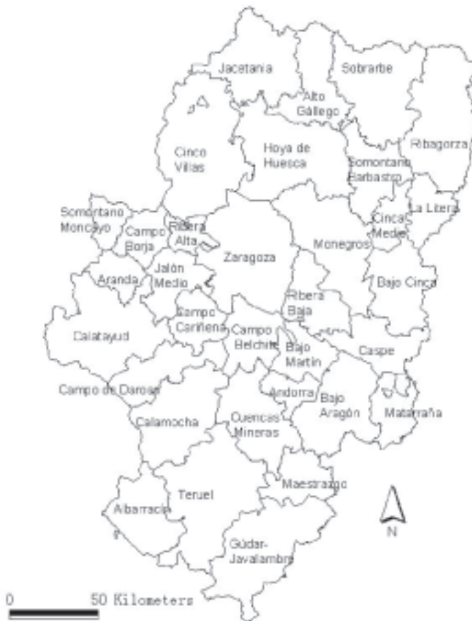
Figura 1. Zona de estudio

Al delimitar áreas geográficas, en este caso, comarcas, caben múltiples posibilidades, ya que para cada finalidad hay un hecho esencial que predomina sobre los restantes y que justifica la delimitación en uno u otro sentido. En la última delimitación comarcal elaborada en Aragón, han sido cuestiones de tipo funcional y administrativo las que han inspirado la formación de las 33 comarcas, objeto de nuestro estudio.