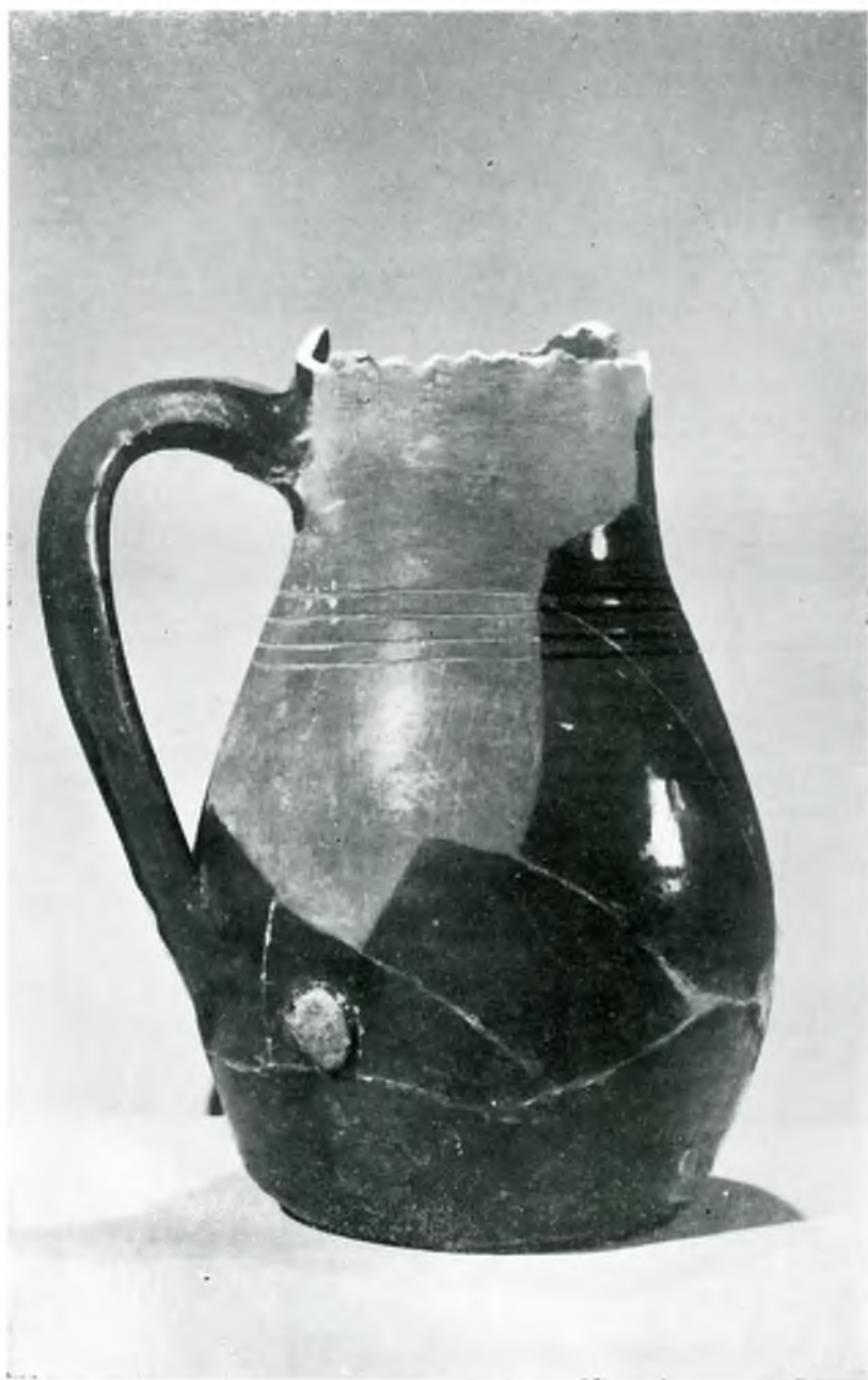
Vasija que contenía el tesoro de monedas árabes encontrado en Jaén.