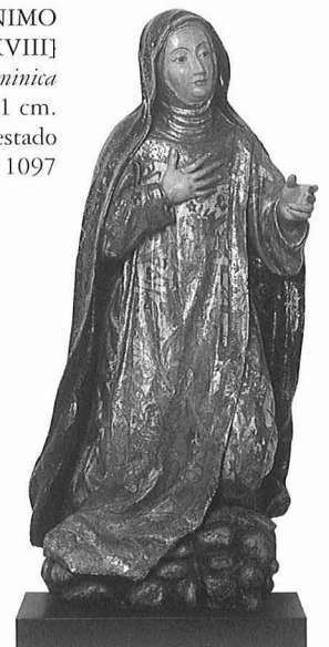
ANÓNIMO [Primera mitad del siglo XVIII] Santa dominica Madera policromada. 126 × 62,5 × 31 cm. En buen estado N.º R.º 1097