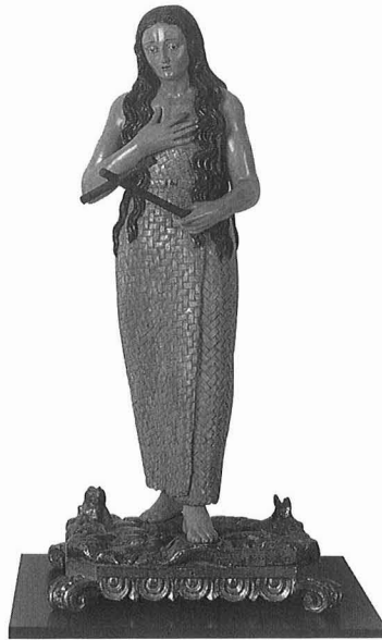
ANÓNIMO CASTELLANO [Último cuarto del siglo XVII] Magdalena penitente Madera policromada. 83 × 40,5 × 34 cm. En buen estado N.º R.º 1040