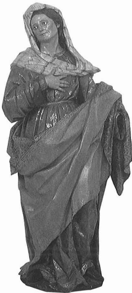
ANÓNIMO [Segunda mitad del siglo XVIII] Santa Isabel Madera policromada. 126 × 54 × 42 cm. En buen estado N.º R.º 1101