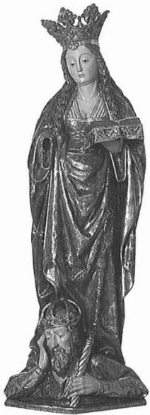
SANTA CATALINA Madera policromada. 170 × 62 × 32 cm. En buen estado N.º R.º 849

DEPOSITADAS POR ORDEN MINISTERIAL DE 24 DE SEPTIEMBRE DE 1986