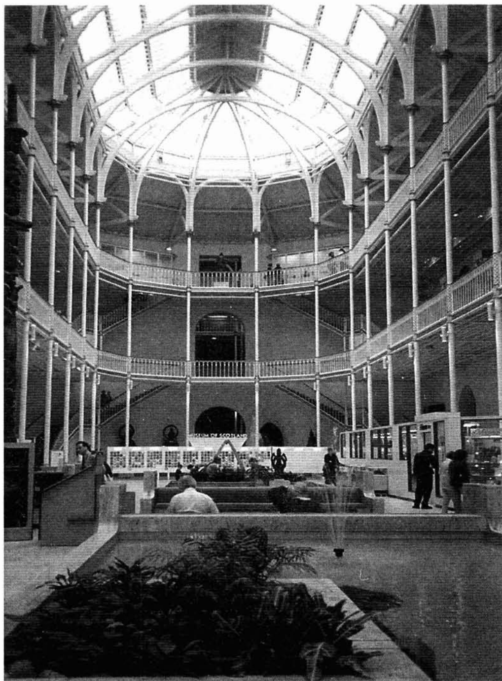
Lám. 5. Museo Nacional de Escocia, Edimburgo.