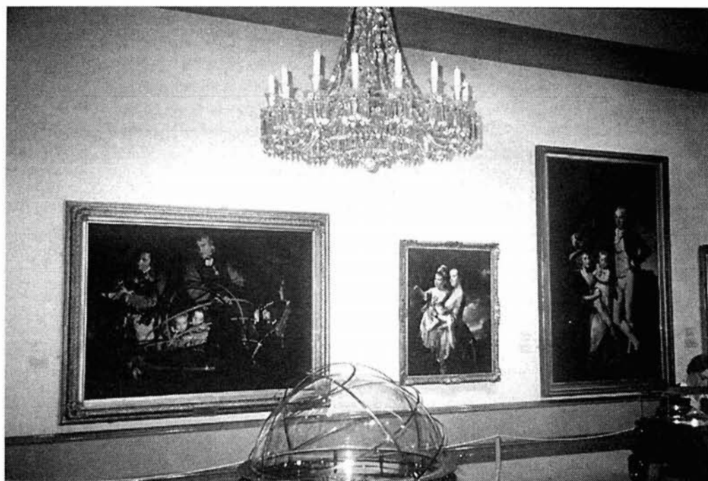
Lám. 6. Derby Museum and Art Gallery. Sala dedicada al pintor Joseph Wright (1734-1797).

constituyó una asociación independiente, los Usuarios de MODES, para continuar desarrollando e implementando este programa 16 .