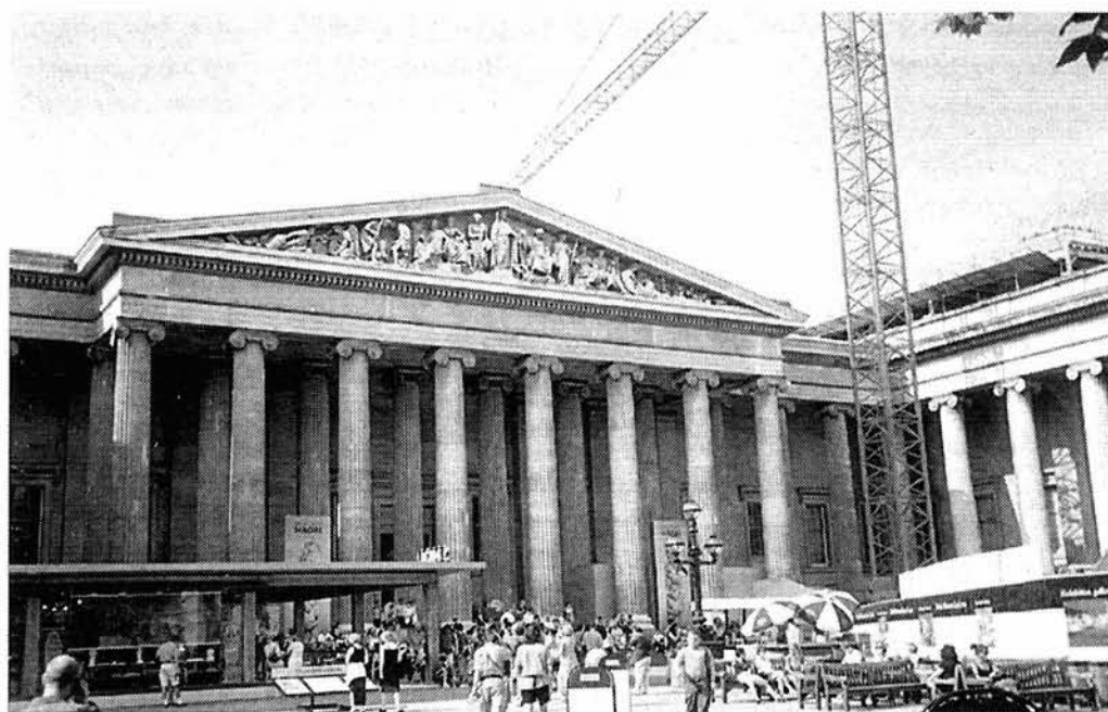
Lám. 3. Museo Británico en remodelación.