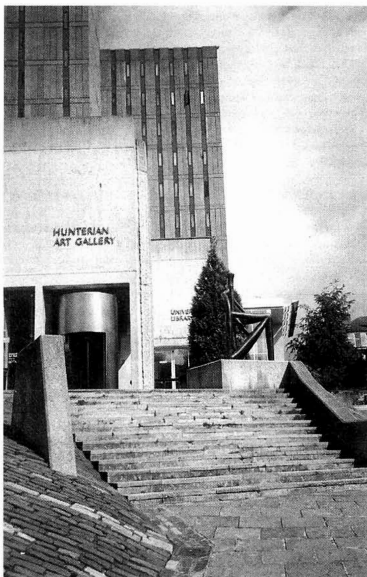
Lám. 2. Hunterian Art Gallery, Universidad de Glasgow. Se encuentra junto a la Biblioteca y posee fondos muy interesantes, como dibujos y grabados de Whistler, y la reconstrucción de la casa de Ch. R. Mackintosh.

Los museos universitarios forman otro grupo importante siendo el Reino Unido un país pionero en la fundación de museos de este tipo, como supuso la fundación del Ashmolean de la universidad de Oxford, el más antiguo de todos. Hay alrededor de unos trescientos museos y colecciones de carácter univesitario. Se financian a través de los recursos gubernamentales que otorgan los Departamentos de Educación y de un organismo específico (Universities Funding