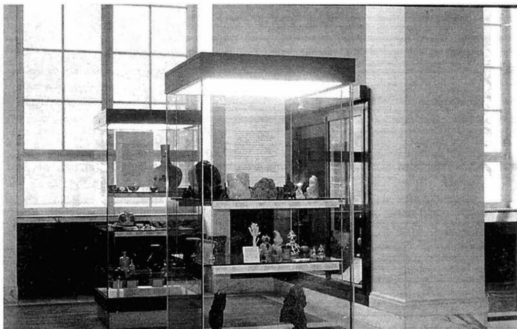
Lám. 4. Museo Británico. Interior.