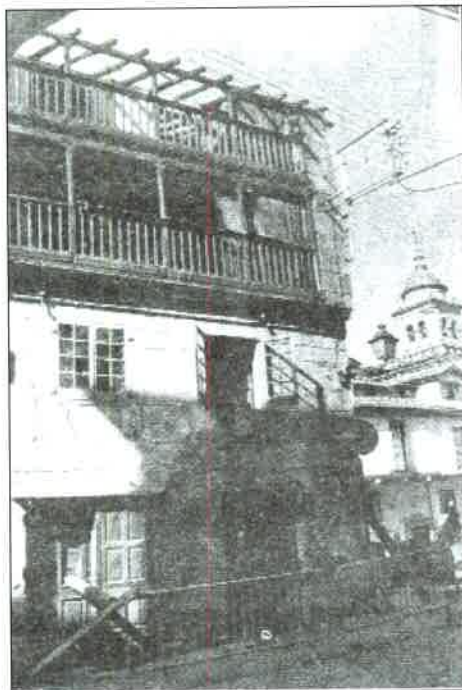
1. Casa donde estuvo la capilla.

Bóveda, por razón de algunos desperfectos en una casa de dicha capilla en la Rúa de Arcedianos.