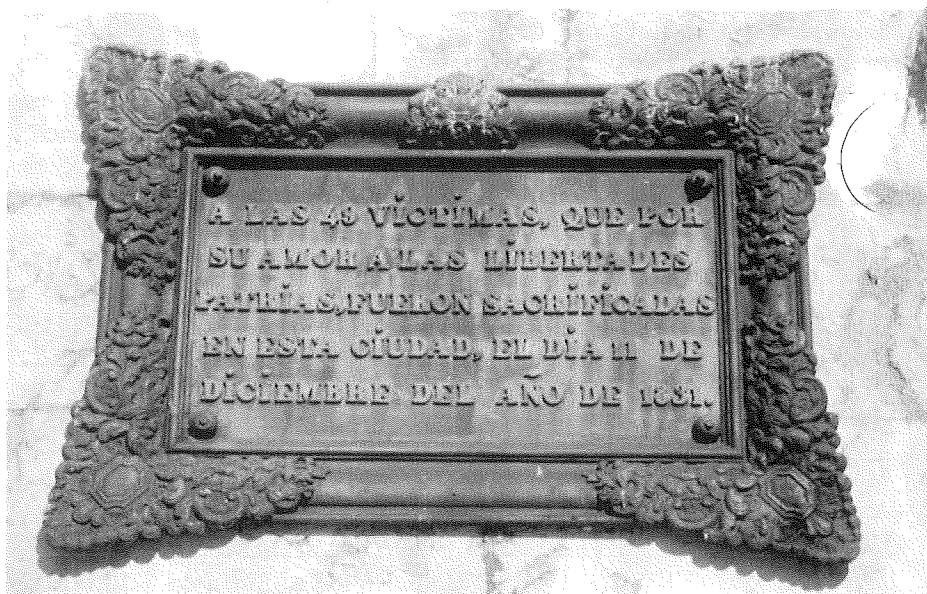
Una de las lápidas del monumento dedicado a José Mª Torrijos y sus compañeros en la plaza de la Merced