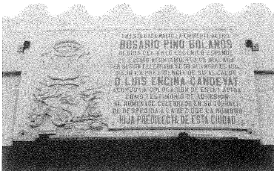
Lápida conmemorativa del nacimiento de la actriz Rosario Pino