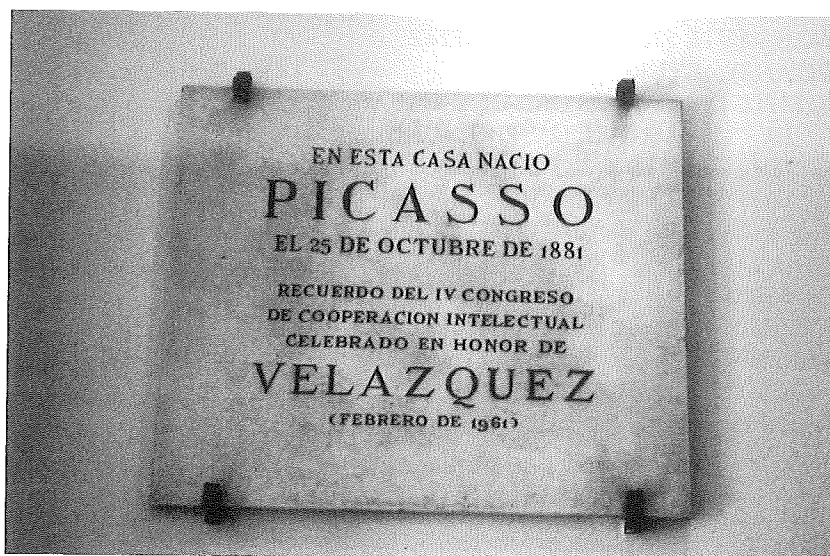
Lápida que identifica a la casa natal de Picasso