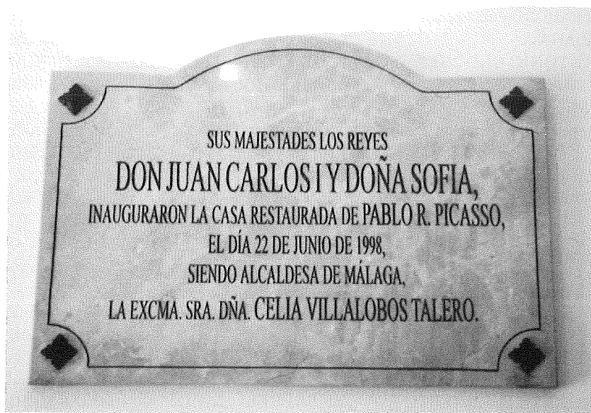
Lápida conmemorativa de la restauración de la casa natal de Pablo Ruiz Picasso