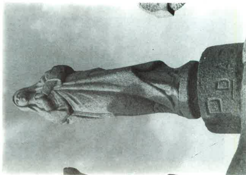
Foncuberta: Virxe da Piedade.