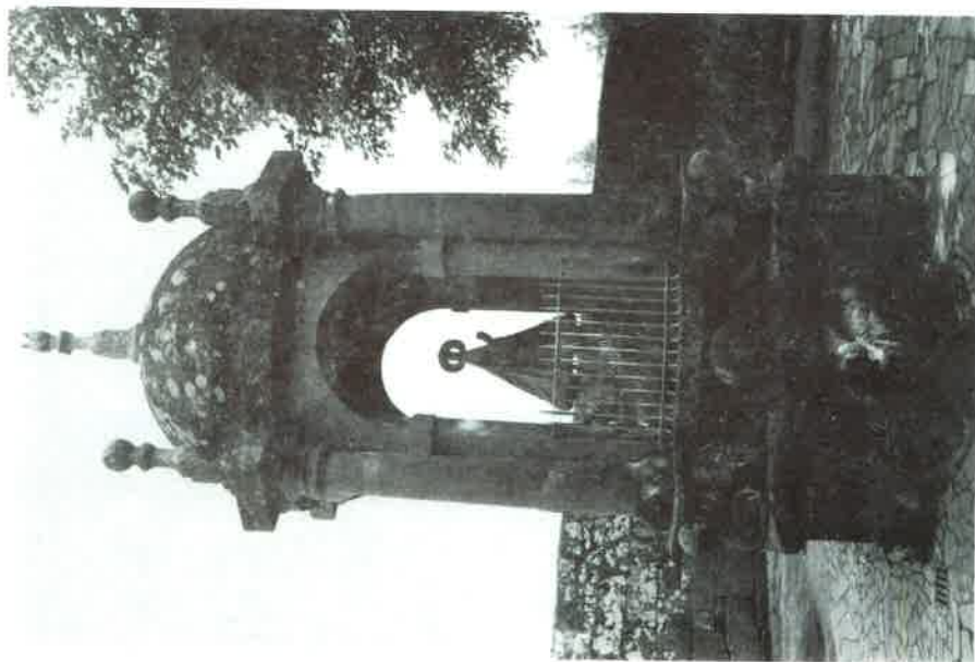
Os Miragres: Templete da Virxe.