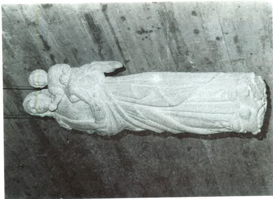
Os Miragres: Colexio "Virxe madre"