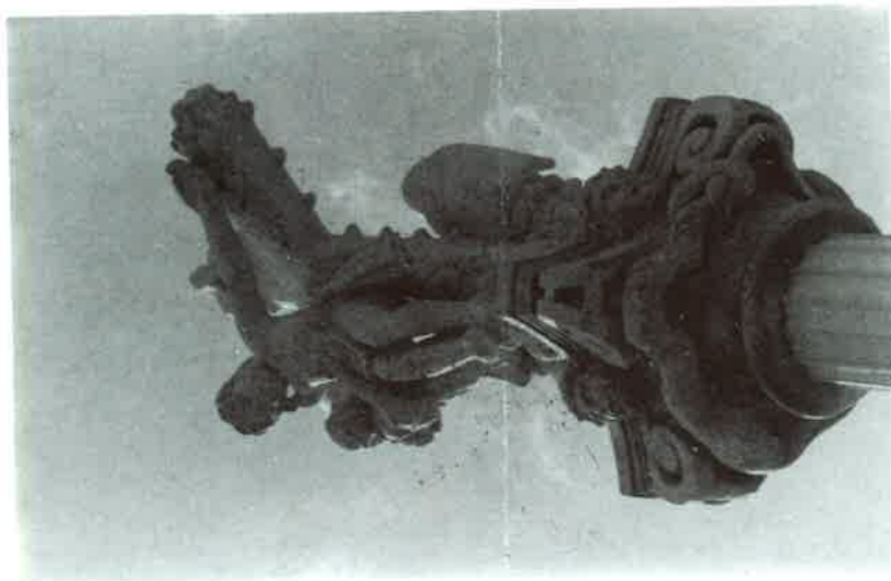
Sabucedo de Montes: Cruceiro.