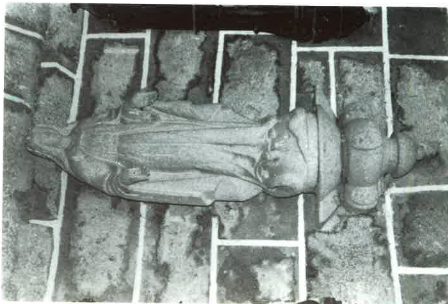
Os Miragres: A "Milagrosa".