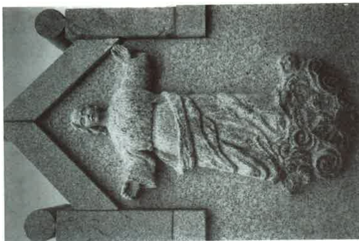
Loña do Monte: Virxe do Monte.