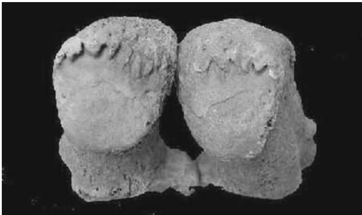
Fig. 1. Intensa artrosis en ambos calcáneos en el individuo 1014.

artrosicos que entran dentro de la normalidad en individuos de edades avanzadas en mayor o menor grado, ya que la edad es un factor determinante como consecuencia del «deterioro por desgaste».