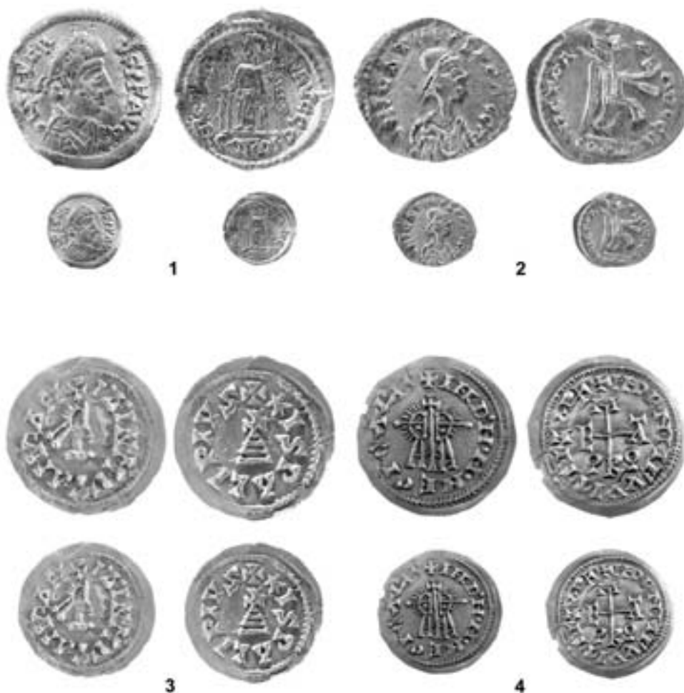
Fig. 2. 1. Majaladares (Borja, Zaragoza), tremissis acuñado a nombre de Severo III (461-465), ceca: ¿Tolosa? (Toulouse, Francia), módulo: 14 mm. 2. Cesaragusta (Zaragoza capital), tremissis acuñado a nombre de Iustino I (c. 527), ceca: ¿Narbona? (Francia) o ¿Barcelona? (España), módulo: 15,5 mm. 3. Cesaragusta (Zaragoza capital), tremissis de Wamba (672-680), ceca: Ispali (Sevilla, España), módulo: 20,6 mm. 4. Cesaragusta (Zaragoza capital), tremissis de Egica y Wittiza (695-698 / 700-702), ceca: Emerita (Mérida, Badajoz, España), módulo: 20,3 mm. Museo de Zaragoza.

copiando los modelos del emperador bizantino Justino I (518-527) de la ceca de Constantinopla. Algunas de estas acuñaciones llevan en el campo del reverso el monograma de Amalarico. Las leyendas de los trientes son generalmente, DNIVSTIN VSPPAVC en el anverso, y VICTORIA AVCVSTORVM en el reverso; son frecuentes las faltas ortográficas y las leyendas modificadas o incompletas (MATEU, 1936: 147-153; REINHART, 1945: 219-221, fig. 2, 6-10; MATEU, 1951: 123, láms. I, 3-5 y VII, 182 y 183; CHAVES, 1984: 23, 46 y 47, n.ºs 54, 56 y 58). HEISS (1872: 76-78) en su estudio recoge un grupo de monedas atribuidas a Amalarico con las leyendas del anverso y reverso muy similar.