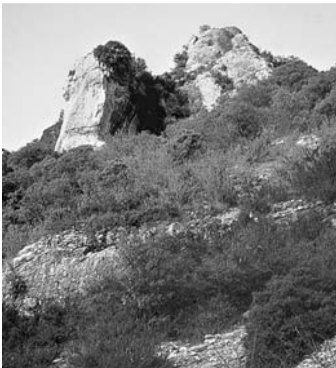
Fig. 3. Cueva Foradada. Su entrada se sitúa entre dos peñascos.

intención de restablecer su autoridad en Saraqusta (Zaragoza) y dirigir una razia de castigo contra Pamplona y los vascones. Posteriormente, para cobrar los tributos debidos, se desplazará hacia el este y atacará las tierras de Cerretania.