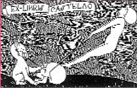
O Ex-libris de Castelao mostra o seu talante irónico e burlesco ó tratar algúns temas trascendentes.

tan á realidade á que teñen que ser aplicados. Tal é o caso do lema “liberté, égalité, fraternité” importado da Revolución Francesa que non serve nunha república coma a española e que Castelao ve máis ben colocado na porta dun cemiterio ( Cfr. SeG, 220 ). Non é que, de seu, Castelao non loite por estes principios, pero négase a aceptalos como pura teoría sen a súa aplicación práctica a un Estado plurinacional. A mesma postura adopta cando critica os federalistas galegos partidarios, en teoría, do federalismo e grandes autonomistas, pero na práctica, cando chegan a Madrid, esquécese ou mesmo refugan estes principios, porque só era unha cantilena teórica aprendida na véspera de se declara-la República, e cando teñen que defendelos resultan ser uns farsantes ( Cfr. SeG, 175-76 ). Teoría e práctica esta vez aplicada ás conviccións íntimas dos homes: as teóricas son moral e politicamente incorrectas, como acabamos de ver.