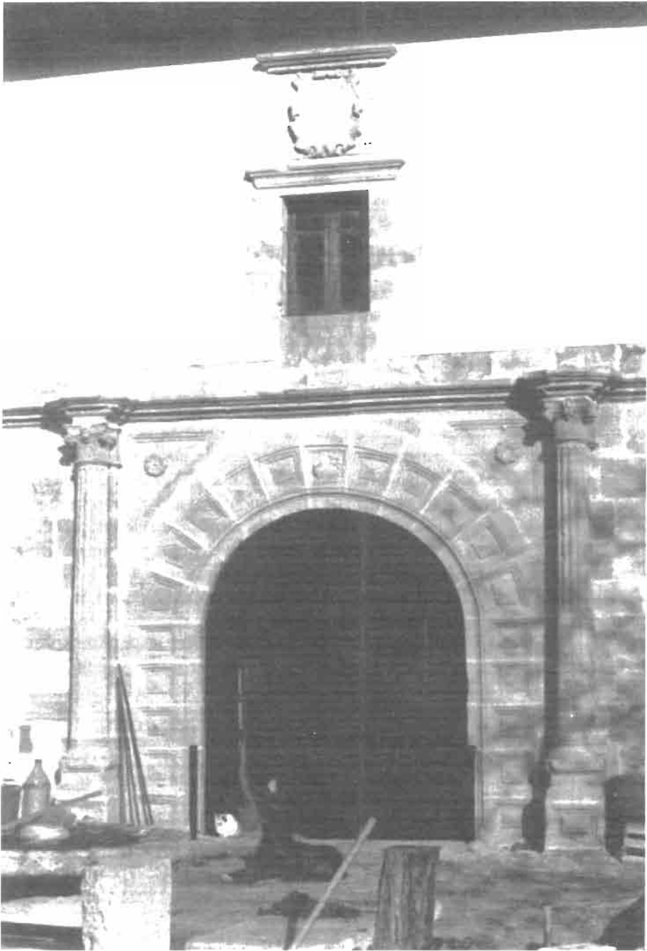
Foto 7. Fachada del Molino de Iturmendi.