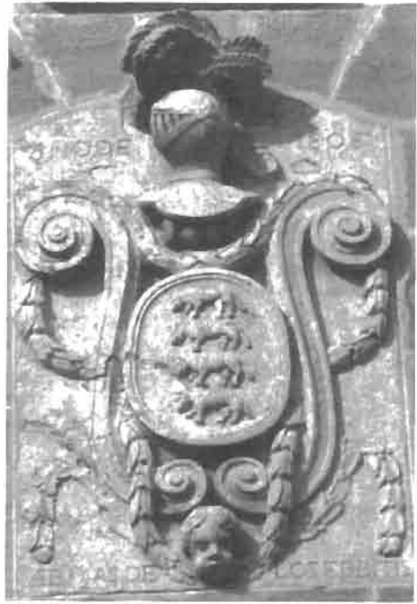
Foto 4. Escudo de Erbiti.