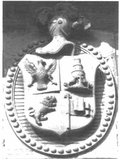
Foto 6. Escudo de López de Goicoechea.