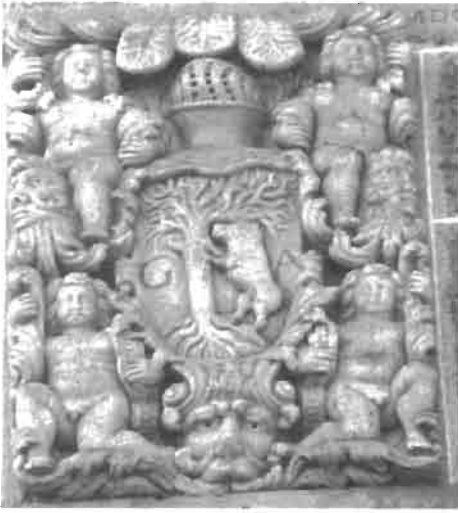
Foto 3. Escudo de Galarza.