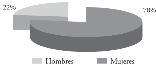
Gráfico 2. Relación directores/directoras

En el segundo aspecto de la investigación, el referido a la relación entre directores y directoras, el índice es también del 3,55 pero en negativo. Curiosamente la relación porcentual es exactamente la misma, pero en dirección contraria, es decir, un 78% de los puestos de dirección son ocupados por hombres y sólo un 22% de los mismos por mujeres.