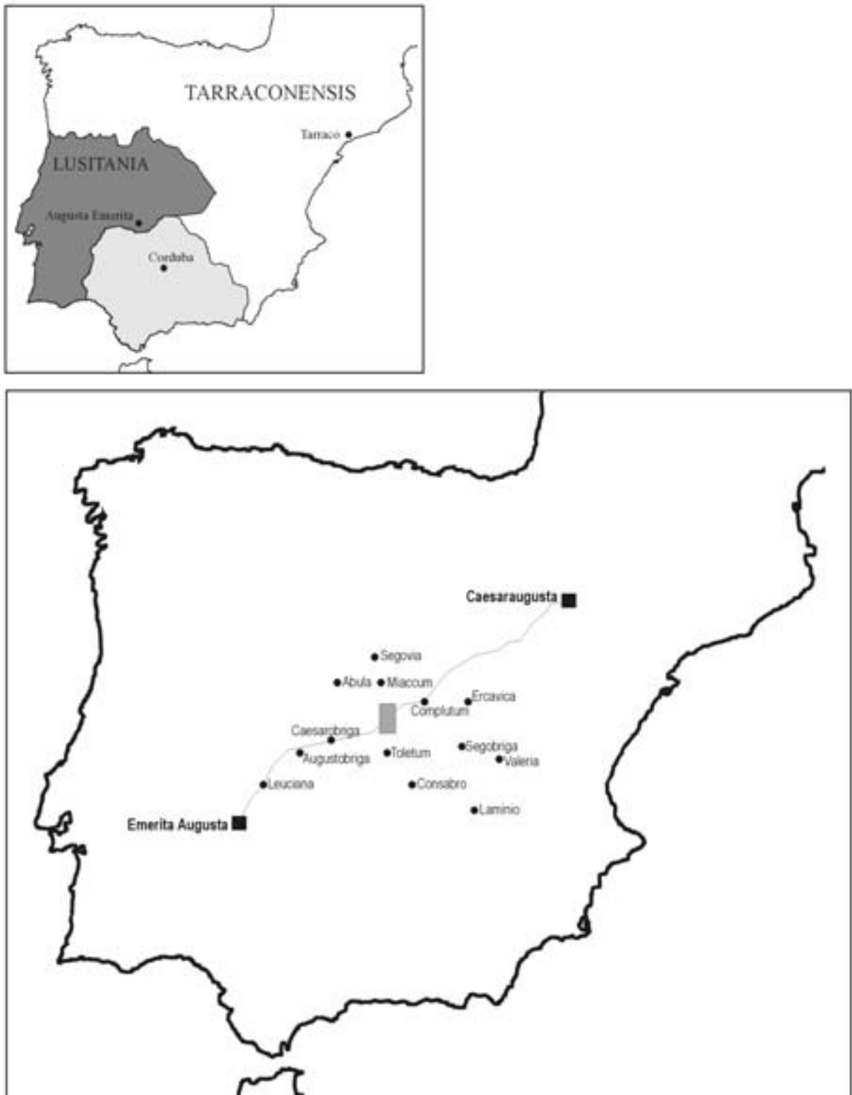
Fig. 2. En el mapa superior se observan las provincias de Hispania y sus capitales; en el inferior, las principales ciudades romanas del interior peninsular, así como otras que se mencionan en el texto, con el trazado de la vía 25 del Itinerario de Antonino . El recuadro señala el área de estudio.