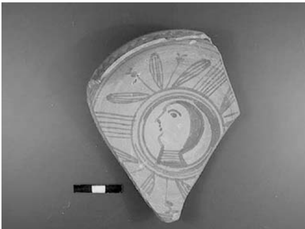
Fig. 2. Fondo interior de un recipiente de cerámica pintada.