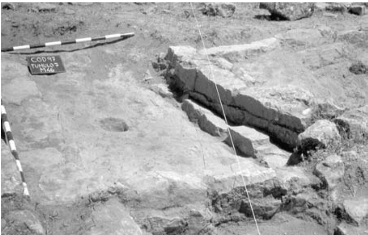
Fig. 1. Necrópolis noroeste. Túmulo 7.