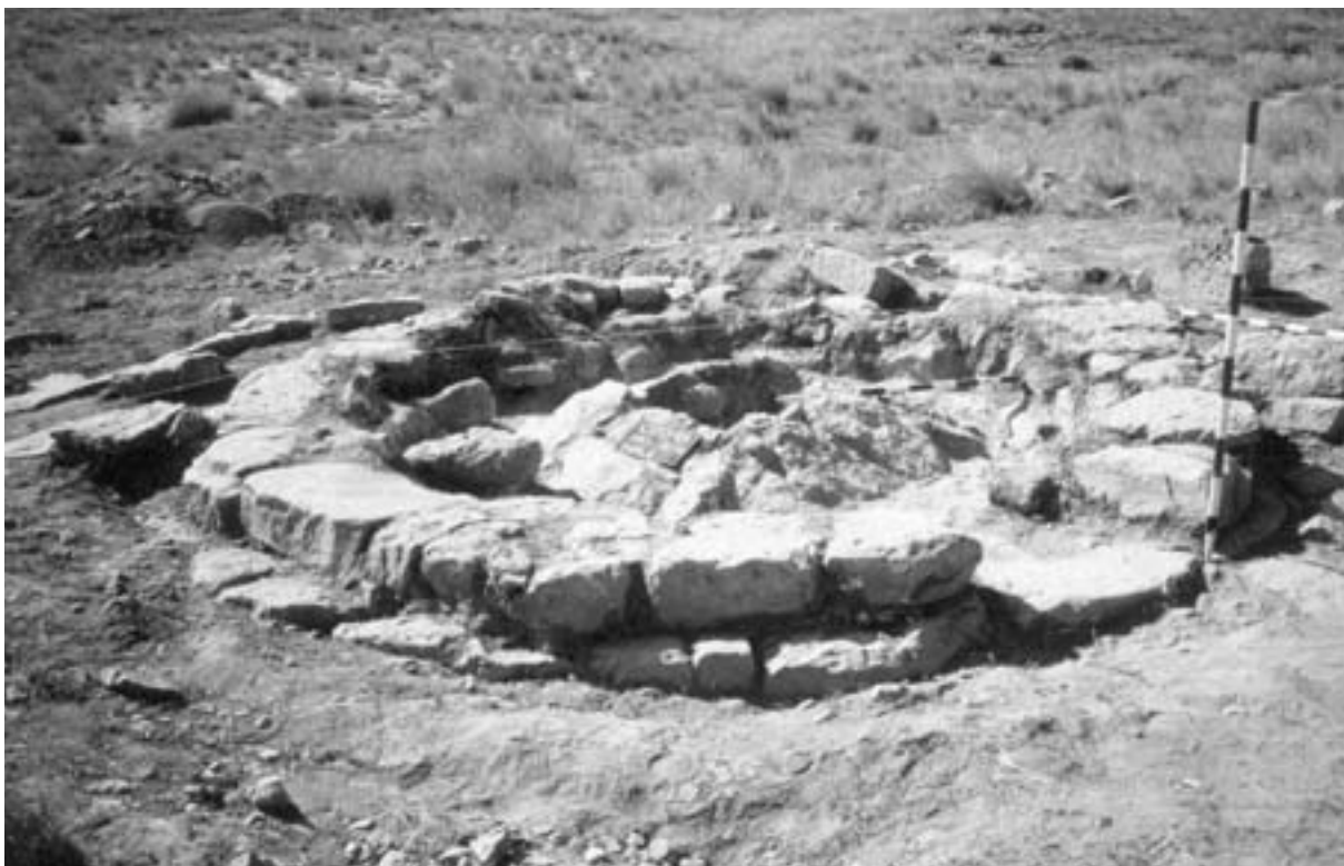
Fig. 3. Necrópolis oeste. Túmulo 1.

huesos calcinados del difunto, sellado por una losa plana sobre la que se esparcieron unas pocas cenizas y huesos. El loculus se encuentra rodeado de una capa de arcilla de color rojo y protegido por algunas pequeñas piedras. Esta capa de arcilla roja finamente tamizada se encuentra rodeada a su vez de una capa de arcilla amarillenta de igual textura. Todo este conjunto descansa sobre una espesa capa de arcilla muy fina y compacta, ahora otra vez de color rojo intenso. Ni el loculus ni los aledaños contenían ningún tipo de ajuar.