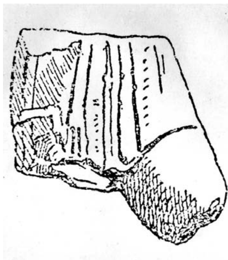
Figura 5. «Fragmento del Guerrero Ibérico [sin falcata] del Llano de la Consolación», según lo dibujó y publicó Arthur Engel en la Revue archéologique 24 (1896). (Tal como se arguye aquí, representa el dibujo-fuente para el Guerrero Ibérico de La Alcudia con una Falcata: Figura 4). La pieza original se exhibe ahora en el Museo Arqueológico, Murcia.

estilo (a lo que se supone que somos sensibles nosotros, los historiadores del Arte) resulta incompatible con la fecha que se le había asignado, mediados del siglo v a.C. o algo parecido.