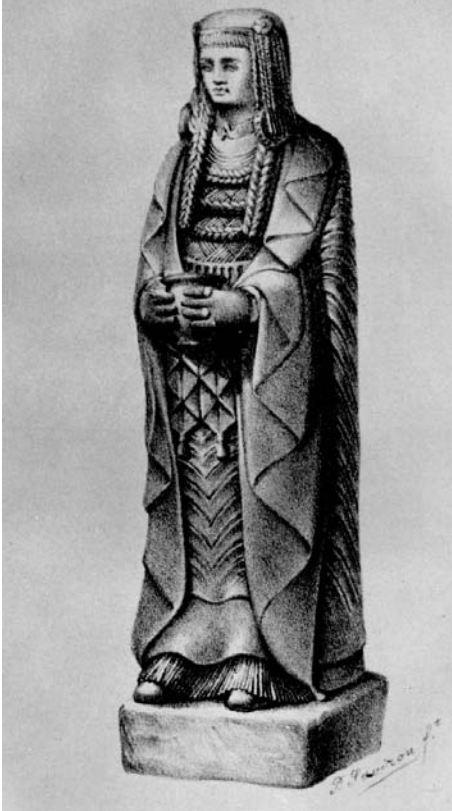
Figura 6. Arturo Savirón y Estevan, «Gran Dama Oferente del Cerro de los Santos», dibujo publicado en la Revista de Archivos, Bibliotecas y Museos 4, n.º 12 (junio de 1873). Figura de pieza caliza, 135 de altura. Fechada h. 450-300 a.C. Madrid, Museo Arqueológico Nacional.