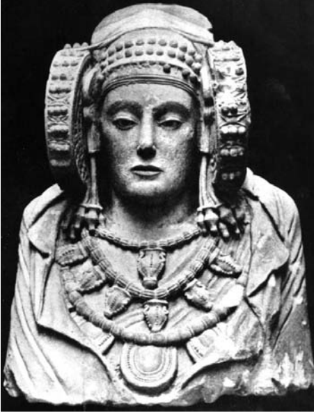
Figura 1. Dama de Elche: vista frontal. Busto de piedra caliza, 56 cm. De altura. Fechado hacia 450 a.C. (como suele afirmarse, también es corriente fecharlo hacia 150 d.C.) o hacia 1896-1897 d.C. (tal y como aquí se afirma). Madrid. Museo Arqueológico Nacional.