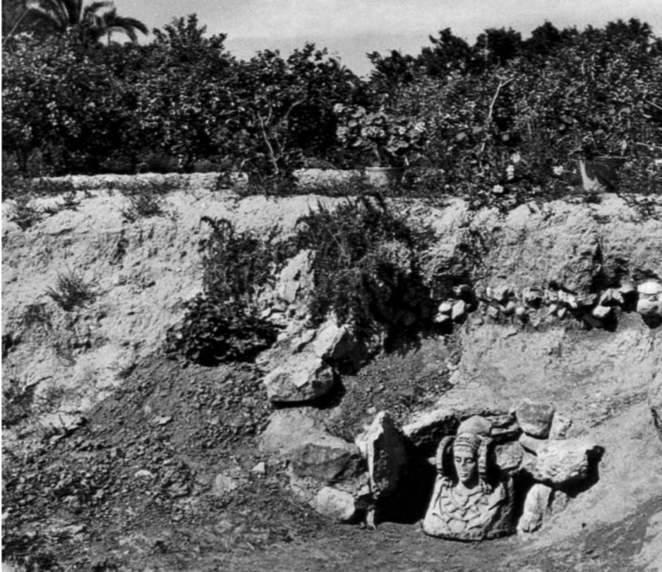
Figura 3. Facsímil del busto de la Dama de Elche, colocado en 1976 en el lugar de su descubrimiento en agosto 1897. La Alcudia de Elche (Alicante).

conforma exactamente a los lineamentos de un dibujo de otro fragmento ibérico, tal como éste apareció en una publicación de 1896 (Figura 5). Como vemos, a su modelo gráfico el falsario ingenioso del Guerrero Ibero con falcata solo añadió el motivo de la espada, la «falcata», atributo «antiguo» que mucho aumentara el valor de la pieza tan oportunamente hallada. Este dato, la existencia de una segunda falsificación en el mismo sitio y momento , lo descubrí y probé bastante después de haber iniciado un largo período de investigación (de cerca de 20 años) sobre la «sin-pedigri» Dama de Elche . Ahí tienen dos datos conocidos y todo el resto es pura especulación, no importa si son conclusiones sacadas por los designados peritos o meramente por gente inexperta.