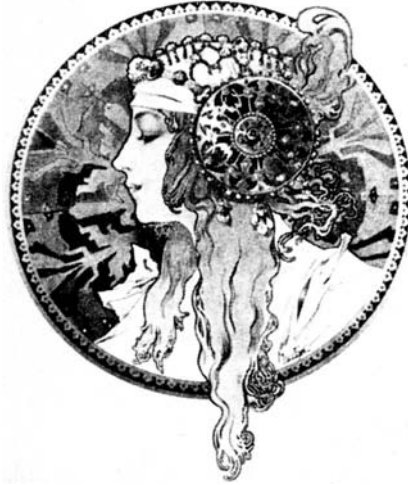
Figura 8. Alfons Mucha, Tête Byzantine - La Blonde. 1897. Lithografía.

Cuando por fin se obtenga respuesta definitiva sobre la verdadera datación del busto, se sabrá dónde colocarla: en el Museo Arqueológico Nacional o en el Museo de Arte Contemporáneo Reina Sofía, ambos en Madrid. En caso de que se opte por el segundo, el busto debería ser emplazado cerca de una obra contemporánea, por ejemplo el cartel de 1897 de Alfons Mucha, que plasma « La Blonde », la aparente hermana gemela de la Dama de Elche que salió en el mismo año, tal como señaló recientemente un académico español 10 (Figura 8). En mi libro cito (e ilustro) muchas obras finiseculares que se conforman al mismo estilo, es decir el «modernismo».