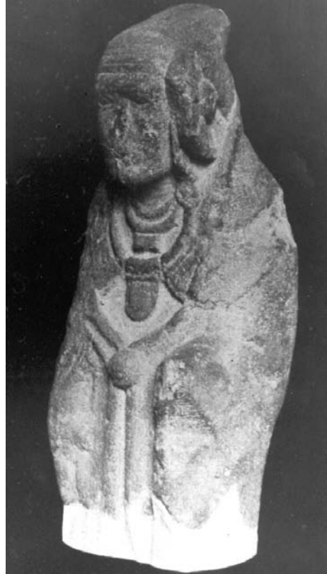
Figura 7. Damita 7.707, del Cerro de los Santos. Figurita de pieza caliza, 29 cm de altura. ¿Hacia 450 o 50 a.C.? Madrid, Museo Arqueológico Nacional.

En resumen, las cualidades que hacen del busto un ejemplo anómalo estilísticamente dentro del panorama de la escultura antigua de cualquier parte del área mediterránea precristiana, son las siguientes y las doy según la recensión hecha por mi colega y antiguo amigo, el Dr. D. Federico Revilla (tal como las obtuve de su página web: < http://www.cultuamericas.org > bajo la subsección «revista»). He aquí lo dicho por Revilla (el subrayado es suyo):