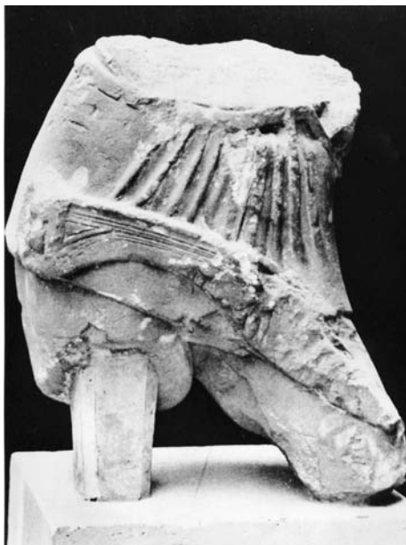
Figura 4. «Maestro de la Dama», fragmento del Guerrero Ibérico de La Alcudia con una Falcata. Piedra caliza, 43 cm de altura. Fechado hacia 450 a.C. (como suele afirmarse) —o en el año de 1897 d.C. (como aquí se afirma). Madrid, Museo Arqueológico Nacional.