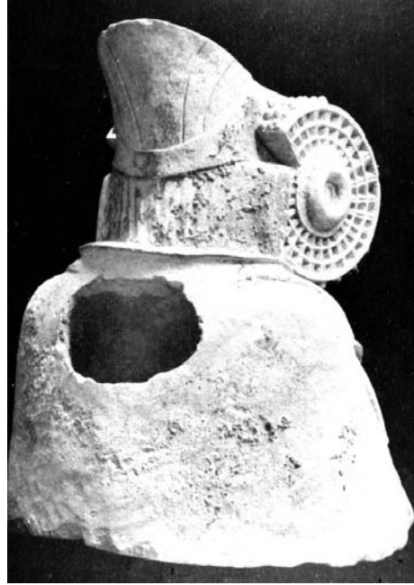
Figura 2. Dama de Elche: vista trasera, con oquedad semejante a una caja.

tanto más fácilmente puede demostrarse la falsificación a base de crítica de estilo». Lo que inicialmente el ojo informado del connoisseur (un perito experto en la materia artística en cuestión) sospecha que sea una obra falsificada luego ha de probarse como tal y, afirma Arnau, «solamente el examen químico y físico es el que en última instancia puede decidir acerca de lo que es auténtico o falso». (Arnau, 1961, pp. 226-7, 234, 340) 2 . Según Francis V. O'Connor, un reconocido connoisseur del arte moderno,