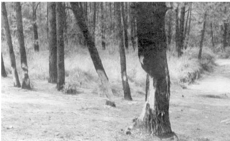
Foto 1: El descortezamiento de árboles para la extracción de trementina: una forma de deterioro ambiental en los bosques de La Malinche

Fuente: INEA, Ecología del Estado de Tlaxcala. Región Malinche , México, SEP-INEA, 1995, p.19.