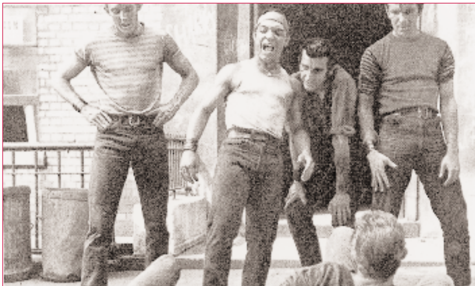
Fotograma de West Side Story . A delincuencia relaciónase positivamente coa autoestima relativa ó grupo de iguais.

física e autoestima referida a habilidades físicas. Os resultados da análise de correlación indicaron que non existía unha relación significativa entre delincuencia e autoestima xeral. Sen embargo, si aparecían correlacións significativas con dimensións específicas da autoestima. Ademais, estas correlacións eran de signos diferentes. En concreto, a delincuencia relacionábase negativamente coa autoestima familiar (-.12) e académica (-.17) pero as súas relacións eran positivas coa autoestima relativa ó grupo de iguais (.15), ás habilidades físicas (.20) e á aparencia física (.11). Leung e Lau comprobaron que utilizar índices xerais pode enmascara-las relacións que a conducta antisocial mantén con distintos elementos da autoestima. Os individuos antisociais