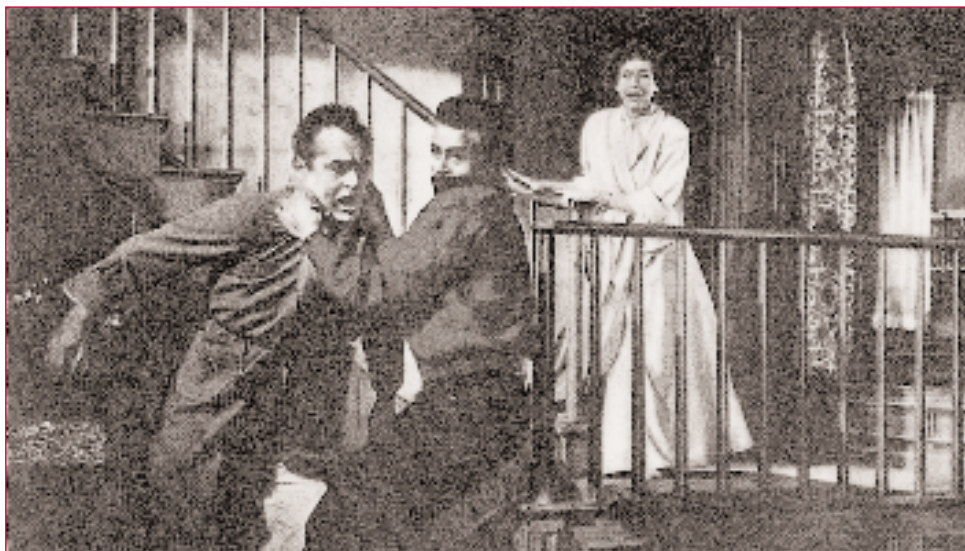
En Rebel without a cause , James Dean interpreta o papel dun mozo que se debate entre a carencia de autoestima do seu pai e a propia postura contra a delincuencia.