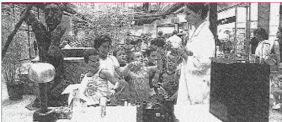
Nenos dun colexio visitando unha exposición temática nun centro comercial. Formando un plan conxunto pódese obter un mellor rendemento dos coñecementos adquiridos dentro ou fóra das aulas.

Non debemos esquecer, así mesmo, en todo este proceso o cambio que propiciou a aparición do concepto de necesidades educativas especiais ( Informe Warnock, 1978 ). Este, ó se centrar nos problemas do neno en canto ó seu proceso de ensinanza-aprendizaxe e esquece-la linguaxe das deficiencias, sitúa a importancia dos centros na súa capacidade para lles ofrecer unha