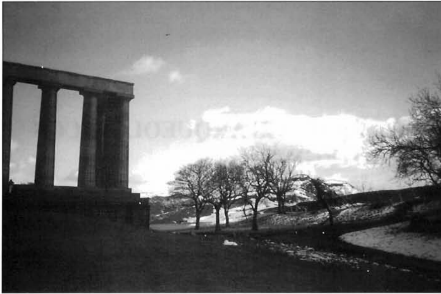
LÁMINA 1. Los Espacios Arqueológicos Protegidos.