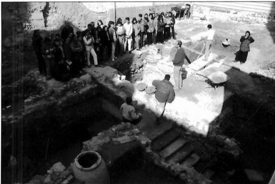
LÁMINA 2. Hay un nuevo profesionalismo, el que se refiere a arqueólogos bien preparados.

gestión arqueológica de los expertos en las cinco fases que acabamos de describir.