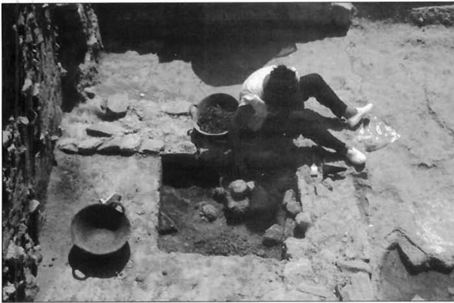
LÁMINA 4. La gestión de los EAP supone nuevas facetas profesionales para los arqueólogos.

nar excavaciones o prospecciones en cualquier terreno, público o privado, del territorio español (art. 43). En términos parecidos se expresan las legislaciones francesa e italiana. Las CC.AA. establecen normas que especifican la ley general.