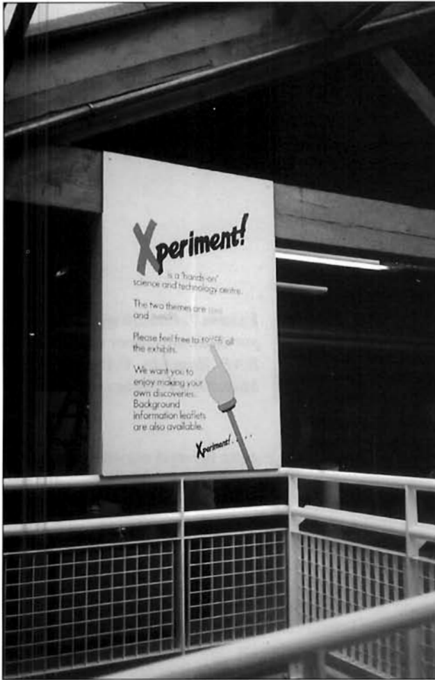
LÁMINA 6. Actualmente las exposiciones sistemáticas de objetos son reemplazadas por aproximaciones temáticas: se exponen ideas y valores.

lógico, se ha ensanchado e intensificado el interés de la sociedad por conocer y gozar de esos bienes de gran interés cultural. Esto ha influido tanto en la transformación del concepto de Museo clásico, como en la ampliación del interés por otros bienes que, por su naturaleza, no se pueden ni se deben depositar en los espacios de un Museo (lám. 5). El interés cultural se extiende a espacios amplísimos. Nuestra sociedad está influida por esa percepción de la cultura material, que corresponde a la definición que de ella hace Deetz: «aquél sector de nuestro medio físico que es modificado mediante un comportamiento determinado culturalmente»: obras de arte y campos, arados, jardines, monumentos, iglesias, bailes, fiestas e incluso el idioma. Las exposiciones sistemáticas de objetos son reemplazadas por aproximaciones temáticas: se exponen ideas y valores, como se hace en los parques temáticos. D. Horne establece un paralelismo entre los peregrinos medievales y la actual industria turística, como ejemplo de la tendencia que el