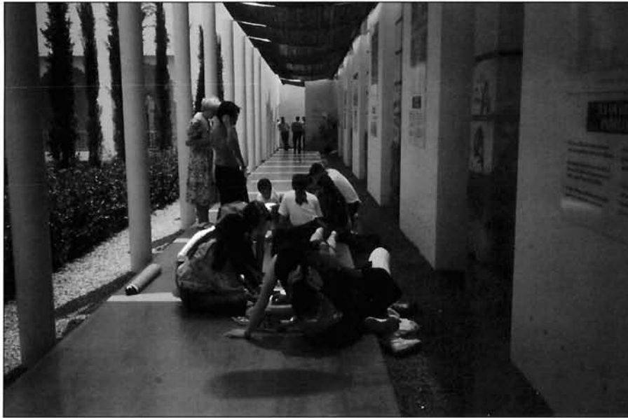
LÁMINA 5. El interés cultural se amplía a espacios nuevos.

habilidad para competir, de la calidad del servicio que se presta y de los precios.