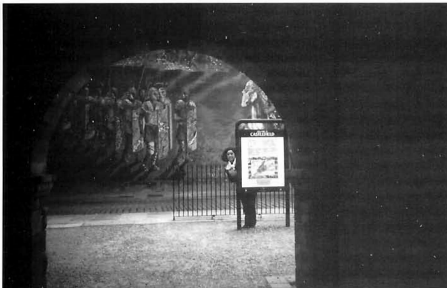
LÁMINA 7. Pintura mural realizada por distintos grupos sociales en un EAP llamado CASHEFIELD. Manchester (Inglaterra).

arqueólogo en su formación específica. Sin embargo, es indudable que para proyectar un trabajo arqueológico previo a cualquier obra de construcción, se requiere un arqueólogo titulado en una Facultad de Historia. Pero ¿puede afirmarse lo mismo cuando se trata de la gestión de una ciudad declarada Patrimonio de la Humanidad, de un paisaje histórico o espacio arqueológico protegido?