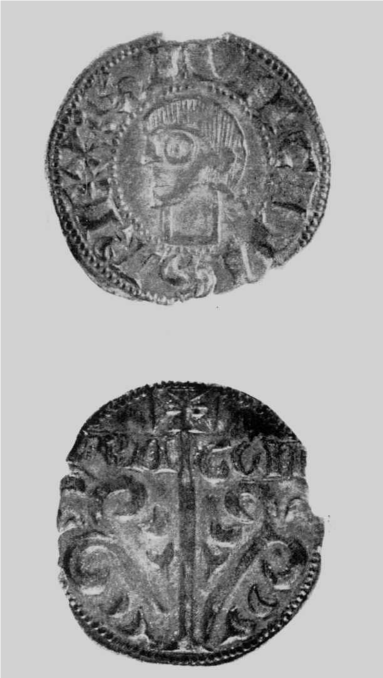
Ampliación del dinero de Sancho Ramírez, hallado en Urdiáin.