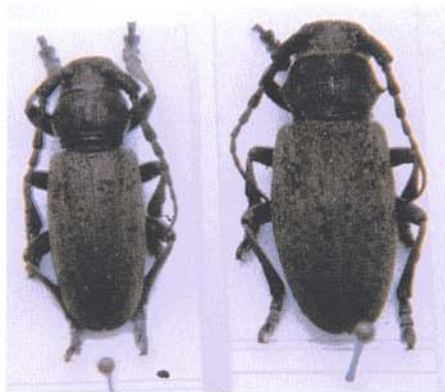
Macho y hembra de Iberodorcadion (Baeticodorcadion) nigrosparsum Verdu-go, 1993