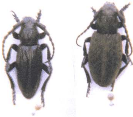
Macho y hembra de Iberodorcadion (Baeticodorcadion) amori (Marseuil, 1856)