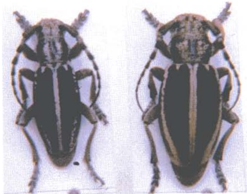
Macho y hembra de Iberodorcadion (Hispanodorcadion) bolivari