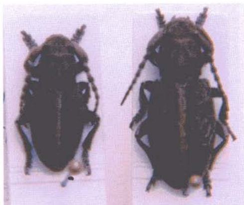
Macho y hembra de Iberodorcadion ( Baeticodorcadion ) suturale (Chevrolat, 1862)