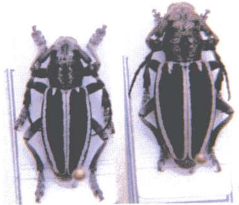
Macho y hembra de Iberodorcadion (Hispanodorcadion) fuentei (Pic, 1899)