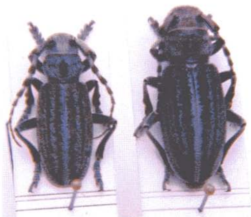
Macho y hembra de Iberodorcadion ( Baeticodorcadion ) mucidum (Dalma, 1817)