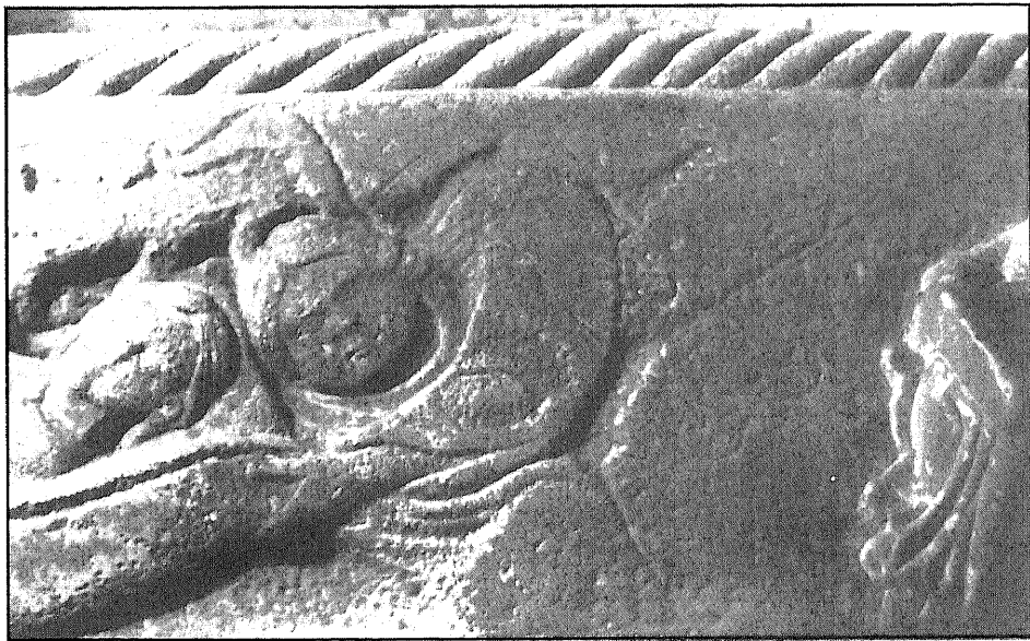
(Fig. 4). Detalle dereito: cabeza da alma e anxo