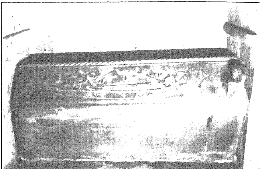
(Fig. 1). Sepulcro de Santa Froila, Catedral de Lugo