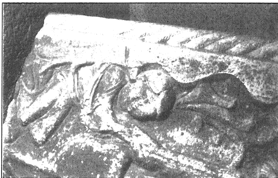
(Fig. 2). Detalle esquerdo: Anxo