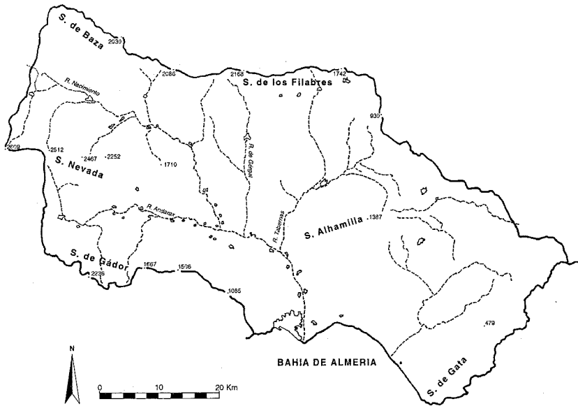
Fig. 1. Cuenca de Andarax y Campos de Níjar. (Elab. Propia a partir de Andalucía. Mapa Topográfico de la Comunidad Autónoma. E 1: 300.000).