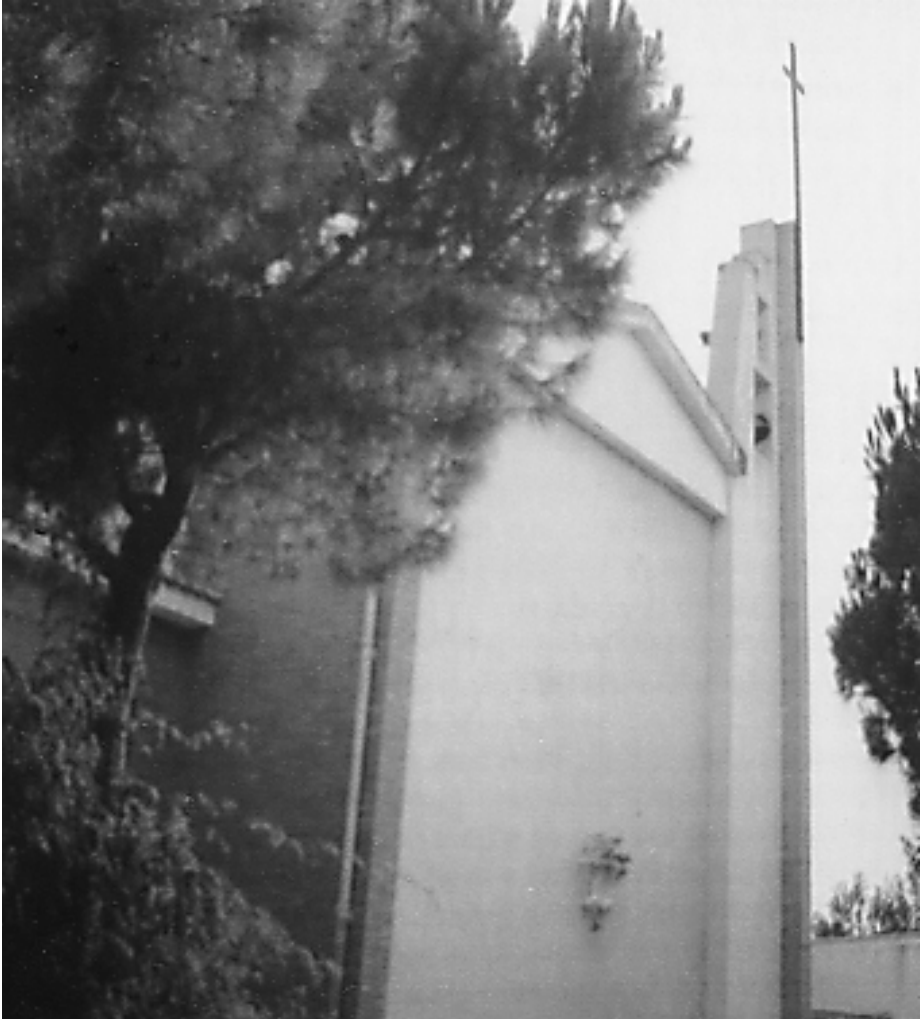
El Real Monasterio Cisterciense de Gratia Dei.