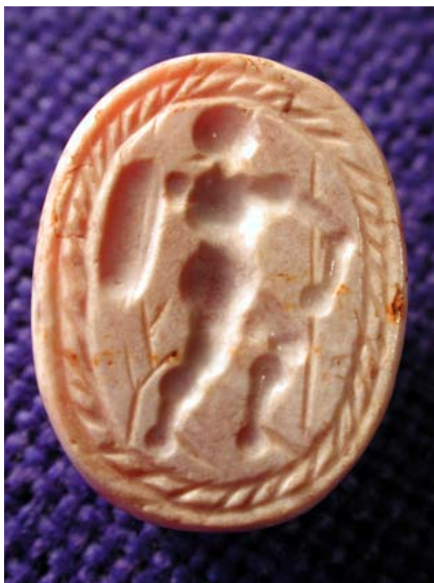
Figura 5. Parte interna del escarabeo.

fechados según el contexto en el tercer cuarto del siglo IV aC y a los que su autor otorga un papel más decorativo que un simbolismo apotropaico (García, 1997, 262).