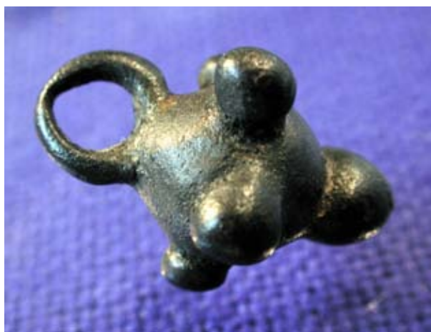
Figura 7. Colgante de bronce.

Iconográficamente debemos desplazarnos hasta la isla de Ibiza para visualizar ejemplos casi idénticos, guerreros preparados para la guerra, con lanza, escudo y casco; aplicado mediante una técnica casi de orfebrería, propia de talleres y artesanos especializados, en los que se utiliza el mismo formato y la misma materia prima, piedras semipreciosas.