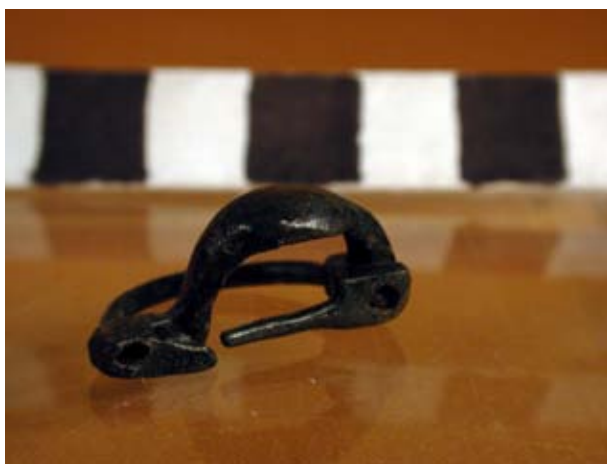
Figura 3. Fíbula anular.

medianas, (Fig. 6) (Clausell, 2002, 82) (Munilla, 1991, 122). Cerca de la cadena quedaba un colgante de bronce globular del que sobresalen cinco protuberancias o apéndices laterales, de forma también globular. En su parte superior conserva una anilla de suspensión, mientras que en la inferior, mantiene otro apéndice terminal algo más grande que los laterales (Fig. 7) (Clausell, 2002, 81). Una pieza relativamente parecida fue encontrada en la sepultura 21-22 de la necrópolis de el Navazo (Cuenca) ya que presenta apéndices en los bordes y una protuberancia central en la parte inferior, que el autor clasifica de “especie de botón” (Galán, 1980, 151-188). Finalmente, en este sondeo, se recogió parte de la anilla de una fíbula anular hispánica de bronce y de sección circular (Clausell, 2002, 81).