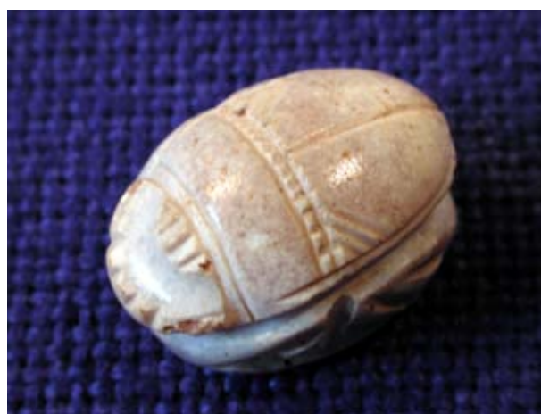
Figura 4. Cara externa del escarabeo.

Muy cercana en el espacio, se ubica también la necrópolis del Puig de la Nau, de donde procede un sello labrado en plata y datado en el siglo V aC (Oliver, Gusi, 1995, 247), el cual se asemeja en varios aspectos al escarabeo que acabamos de analizar. En primer lugar, llama poderosamente la atención la orla sogueada que recorre todo el anverso; en segundo lugar y situado a la izquierda se