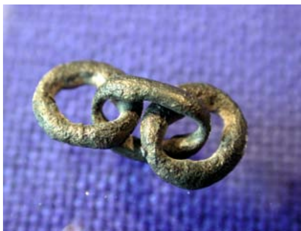
Figura 6. Eslabones de cadena.

Comprobamos que en la inmensa mayoría los escarabeos y también escaraboides se recogen en lugares sacros, en espacios dedicados a la muerte y a la veneración de los antepasados.