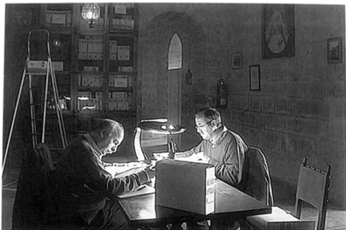
Una de las salas de investigadores.