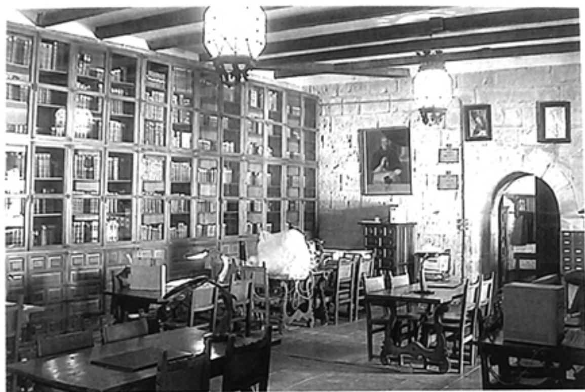
Biblioteca del Archivo Histórico Diocesano de Jaén.