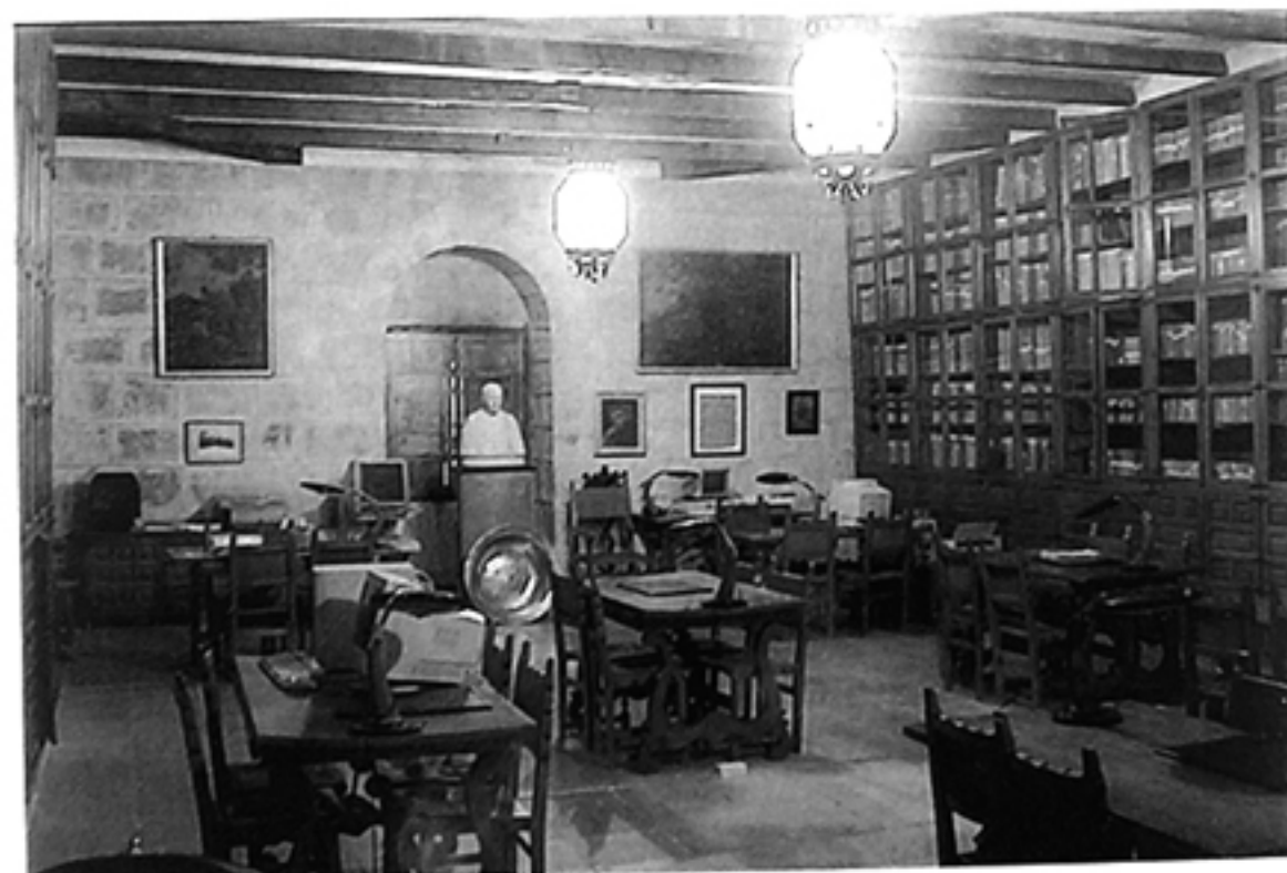
Biblioteca del Archivo Histórico Diocesano de Jaén.