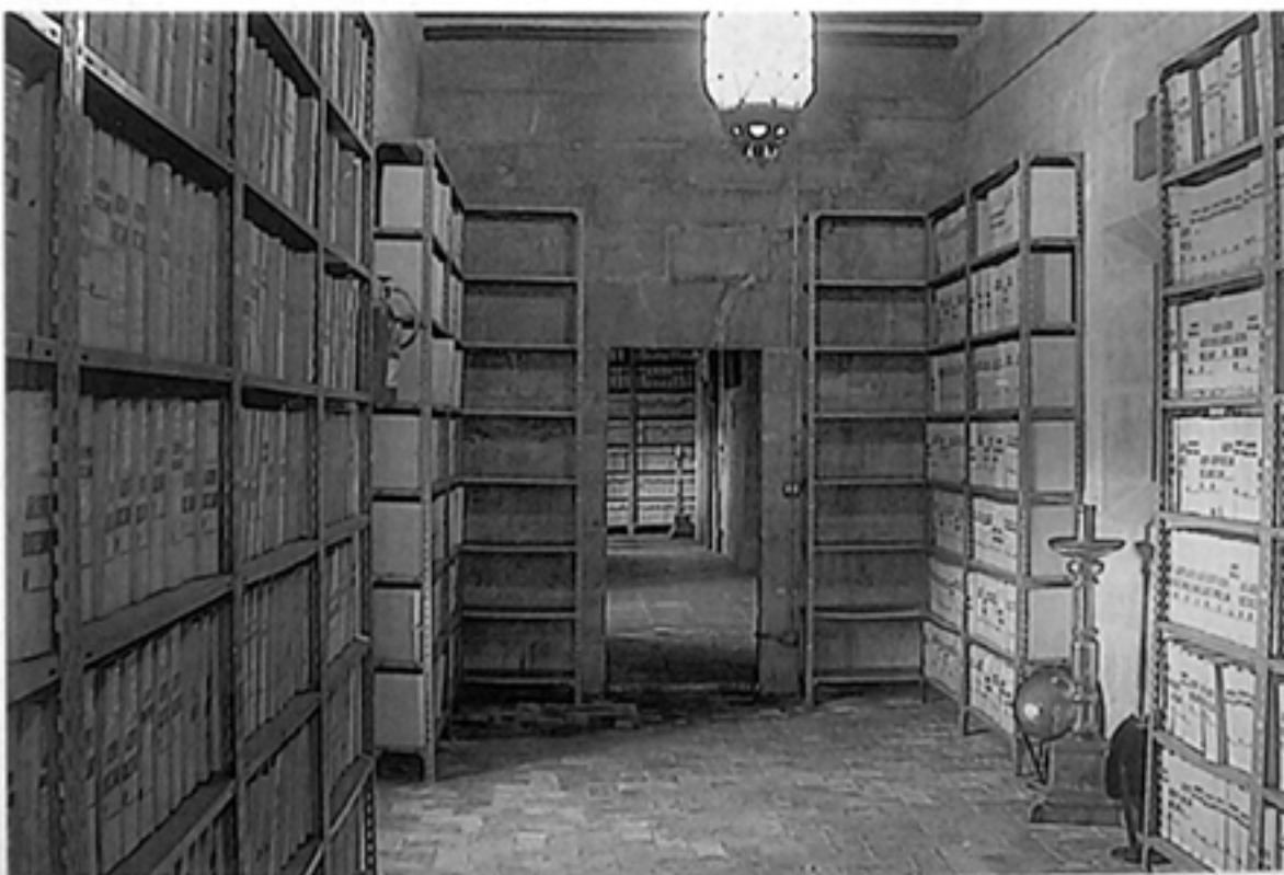
Sala de Expedientes Varios.