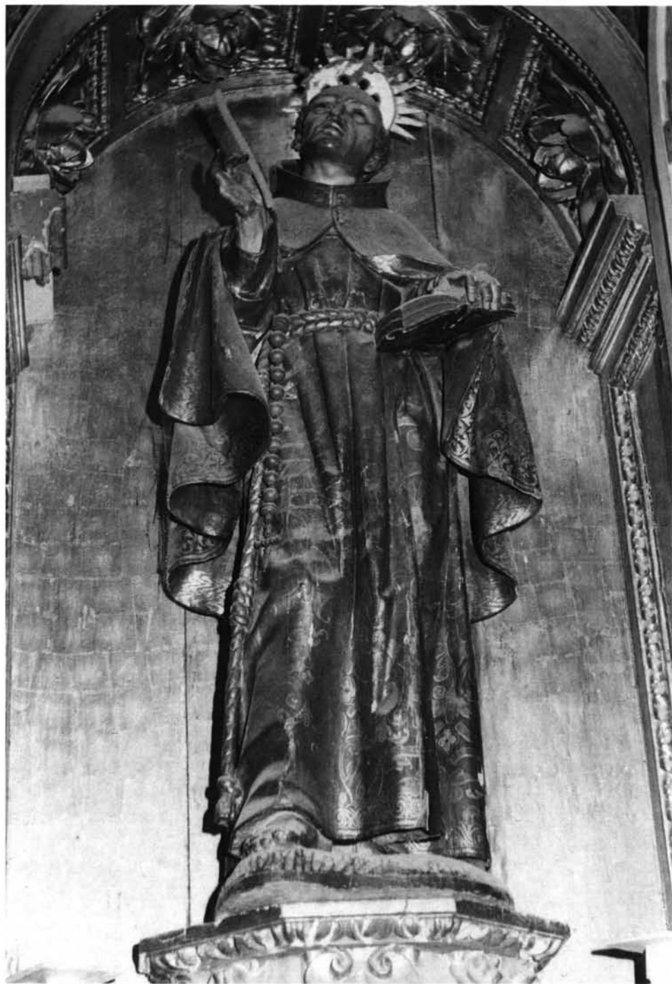
FIG. 4. Catedral de Coria. San Pedro de Alcántara.