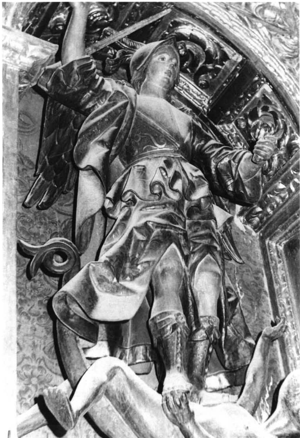
FIG. 6. Cabezuela del Valle. Retablo mayor. San Miguel.