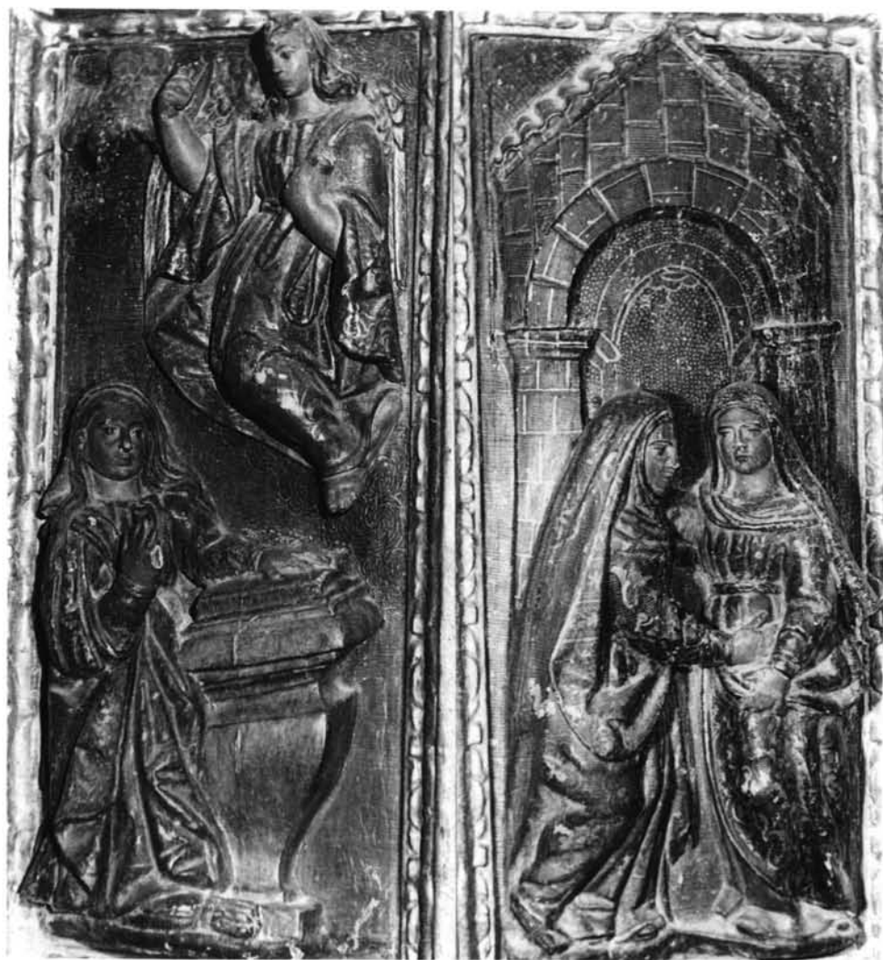
FIG. 7. Cabezuela del Valle. Retablo mayor. Anunciación y Visitación.