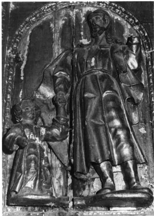
FIG. 2. Catedral de Coria. Retablo de San Pedro. San José con el Niño.