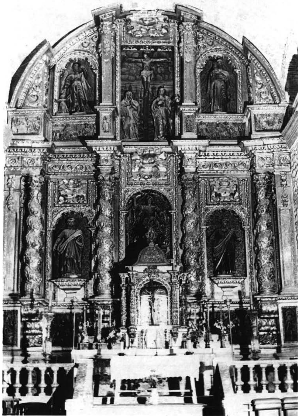
FIG. 5. Cabezuela del Valle. Retablo mayor.