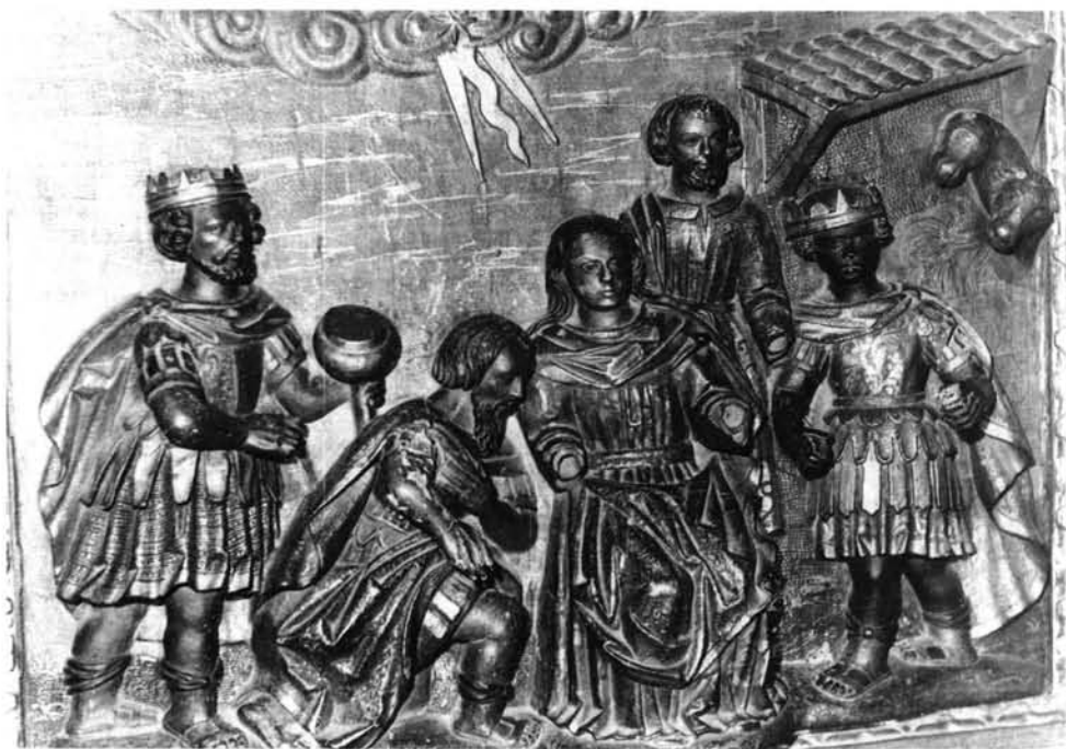
FIG. 12. Tornavacas. Retablo mayor. Adoración de los Reyes Magos.