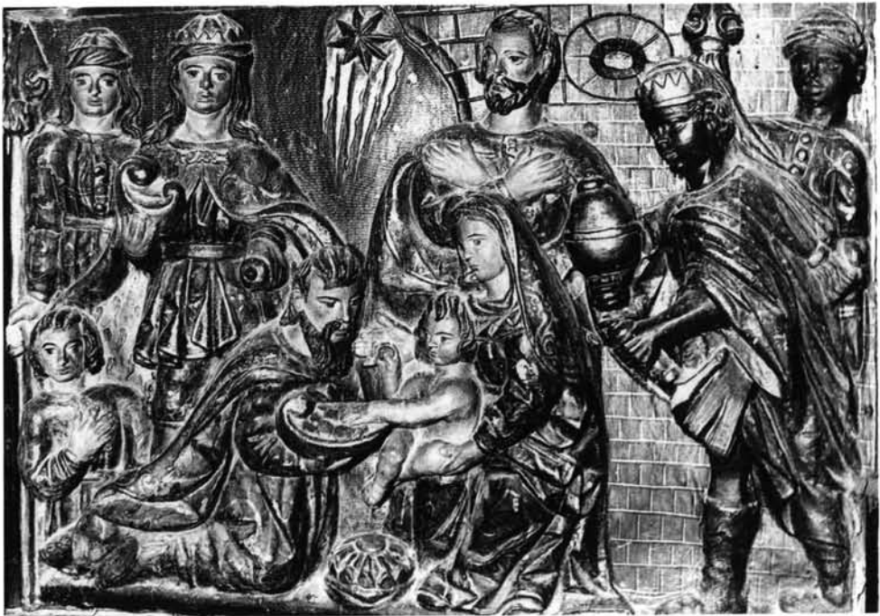
FIG. 9. Cabezuela del Valle. Retablo mayor. Epifanía.