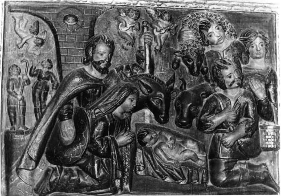
FIG. 8. Cabezuela del Valle. Retablo mayor. Adoración de los Pastores.