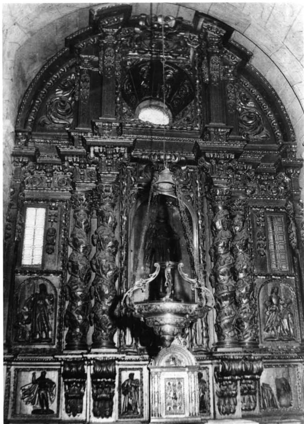
FIG. 1. Catedral de Coria. Retablo de San Pedro de Alcántara.