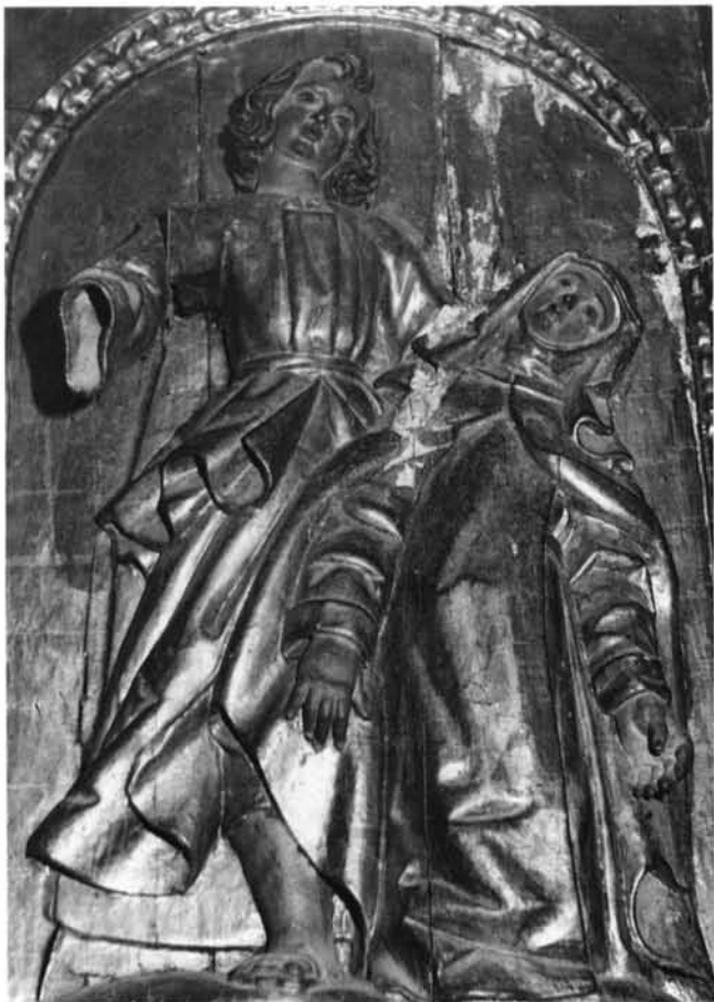
FIG. 3. Catedral de Coria. Retablo de San Pedro. Éxtasis de Santa Teresa.