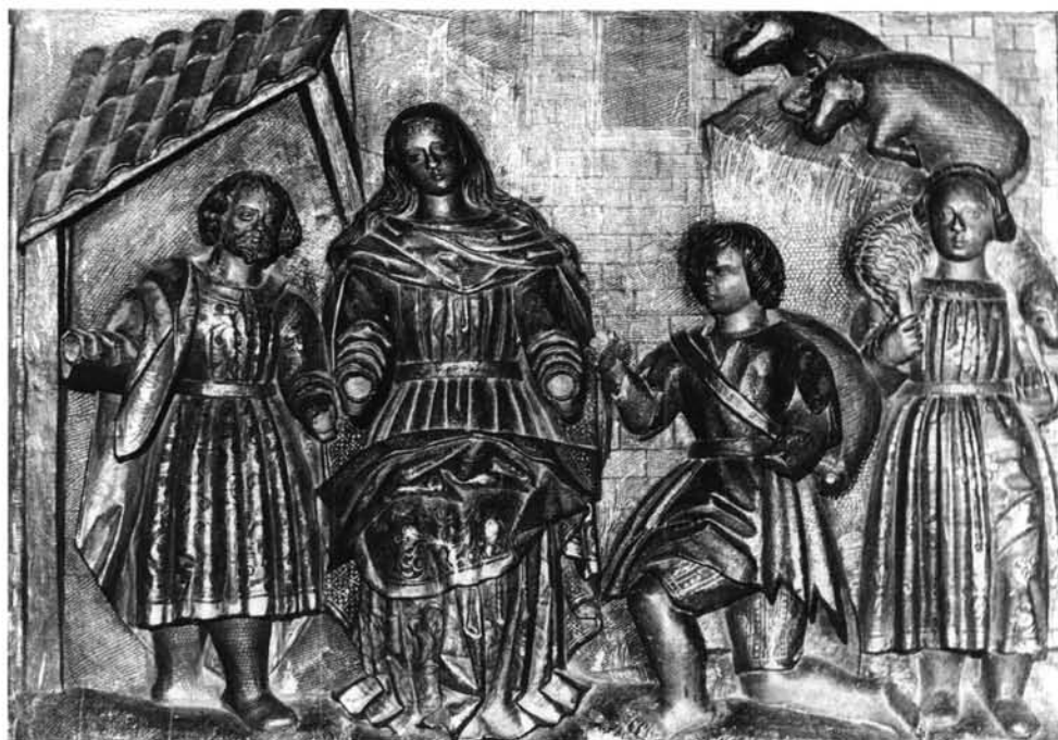
FIG. 11. Tornavacas. Retablo mayor. Adoración de los Pastores.