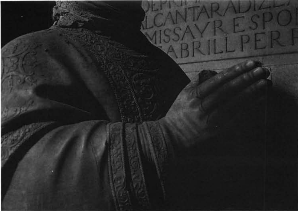
Lámina 12. Sepulcro de García de Galarza: detalle e inscripción de fondo de la hornacina.