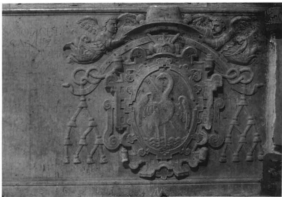
Lámina 11. Sepulcro de García de Galarza: escudo e inscripción del basamento.