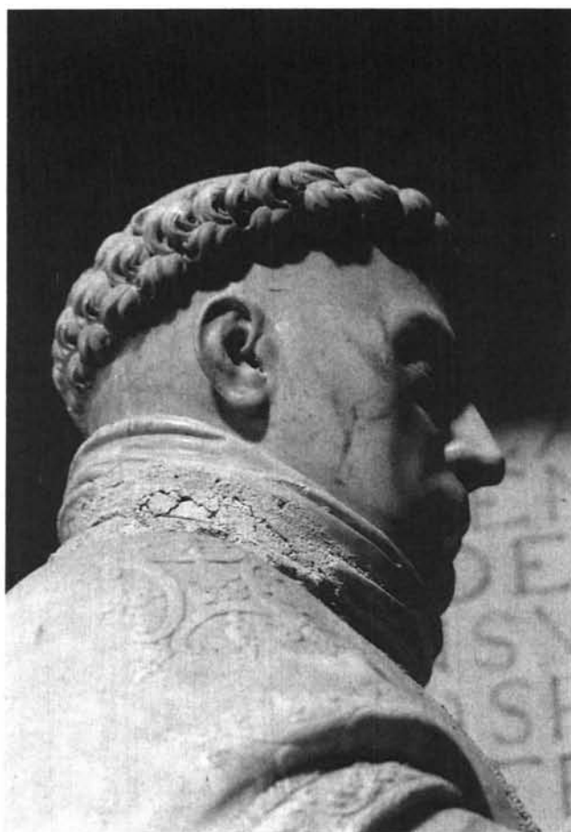
Lámina 14. Sepulcro de García de Galarza: detalle de cabeza y rostro.