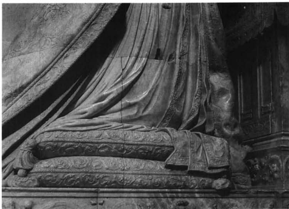
Lámina 10. Sepulcro de García de Galarza: detalle.