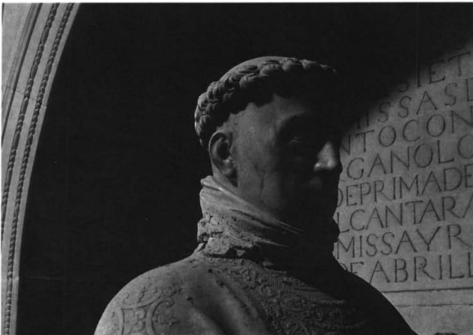
Lámina 13. Sepulcro de García de Galarza: detalle e inscripción de la hornacina.