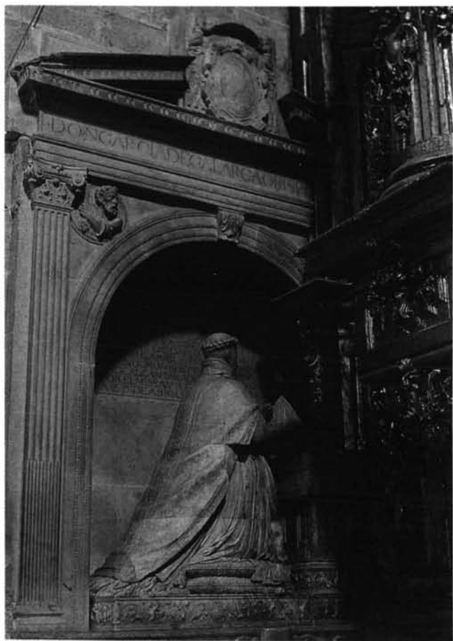
Lámina 3. Sepulcro del obispo García de Galarza.