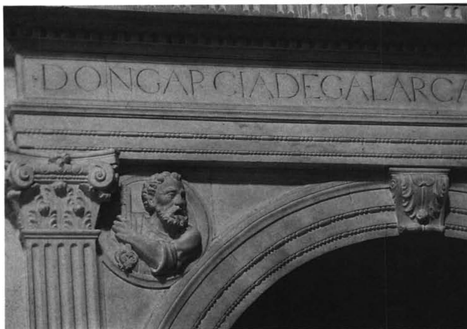
Lámina 6. Sepulcro de García de Galarza: detalle de la arquitectura.