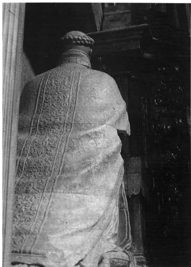
Lámina 8. Estatua de García de Galarza: detalle.