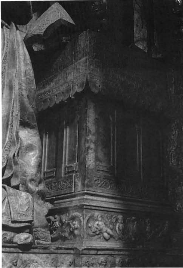
Lámina 9. Sepulcro de García de Galarza: detalle del sitial.