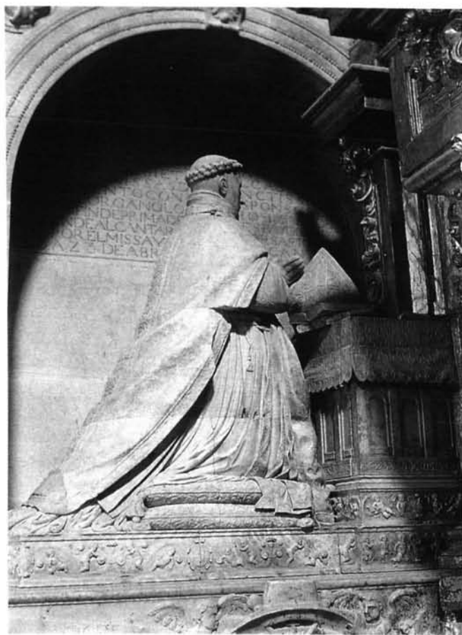
Lámina 4. Sepulcro de García de Galarza: busto orante.