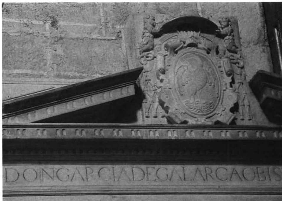
Lámina 5. Sepulcro de García de Galarza: blasón del coronamiento.