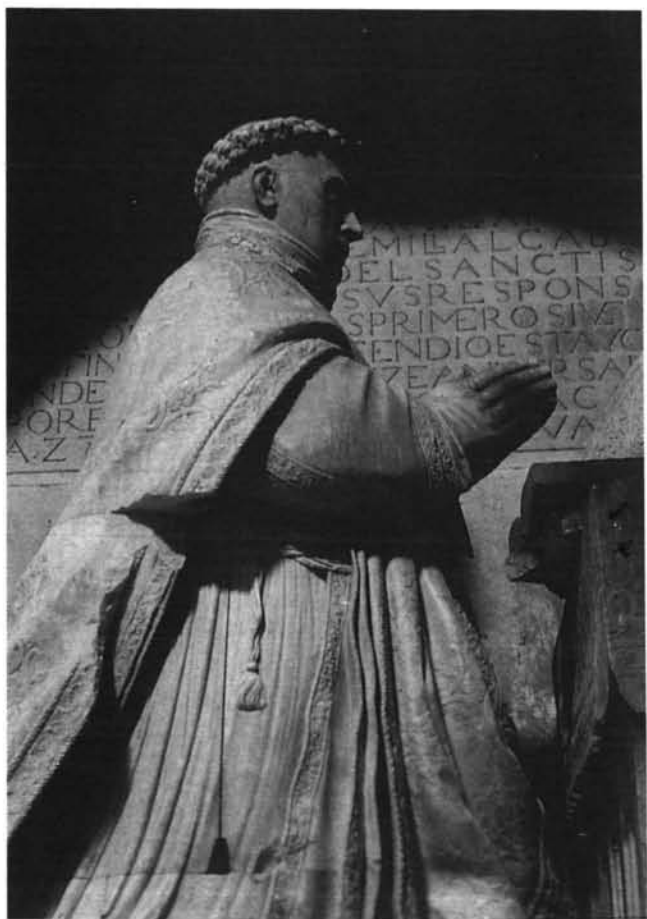
Lámina 7. Estatua de García de Galarza: detalle.