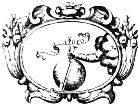
EMPRESA XVIII: A Deo Reconozca de Dios el cetro.