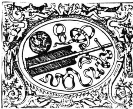
Lámina 4. Paolo Giovio. Emblema.