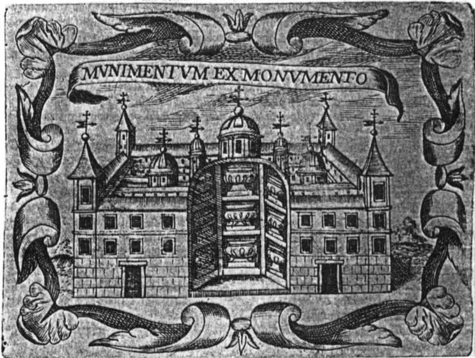
Lámina 14. Juan de Solórzano. Emblema C.