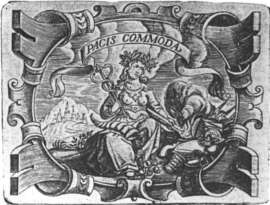
Lámina 16. Juan de Solórzano. Emblema XCIV.