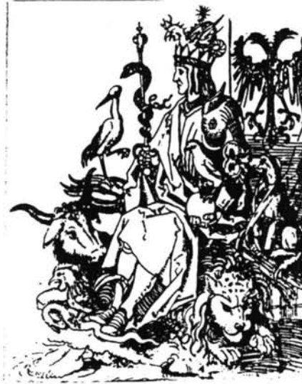
Lámina 7. Alberto Dürero. Arco de Triunfo de Maximiliano.