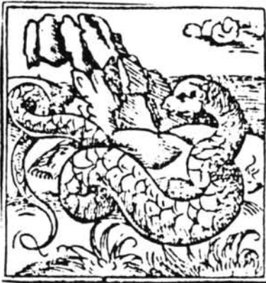
Lámina 8. Horapollo. Hieroglyphica.