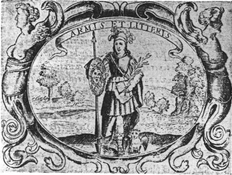
Lámina 3. Juan de Solórzano. Emblema XXI.