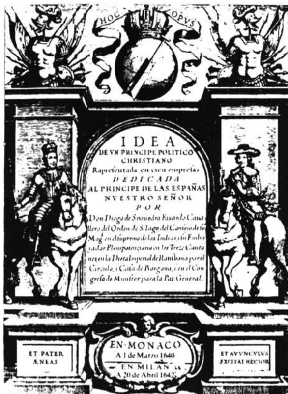
Lámina 5. Diego Saavedra. Portada edición de Munich (1640).