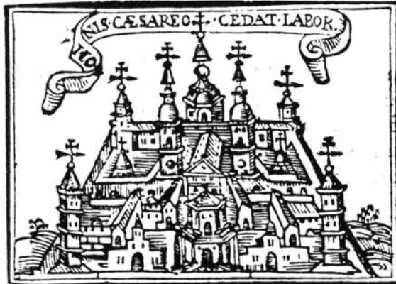
Lámina 13. Sebastián de Covarrubias. Emblema XXXVI.