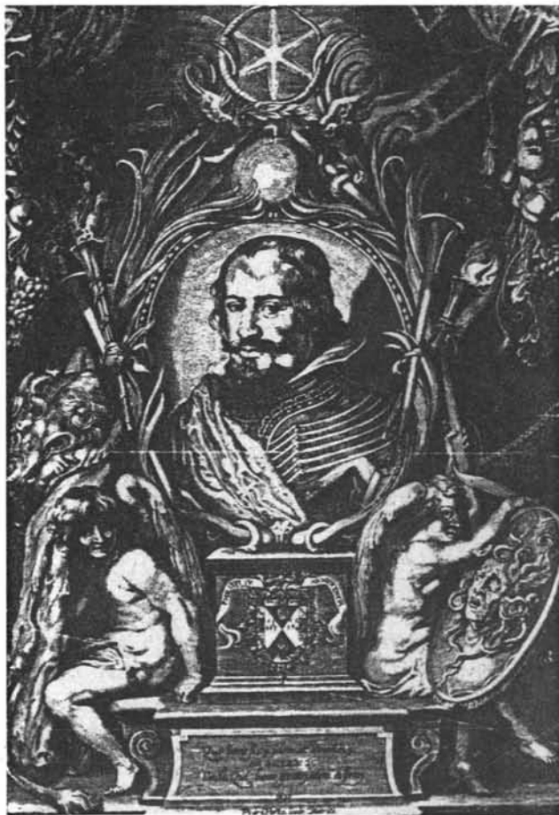
Lámina 1. Pedro Perrete. Alegoría del Conde Duque.