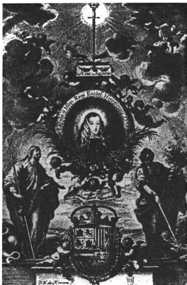
Lámina 15. Matias de Arteaga. Alegoría de Carlos II.