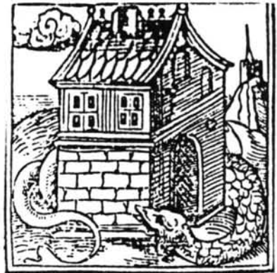
Lámina 9. Horapollo. Hieroglyphica.