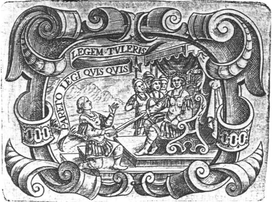
Lámina 18. Juan de Solórzano. Emblema LXIX.