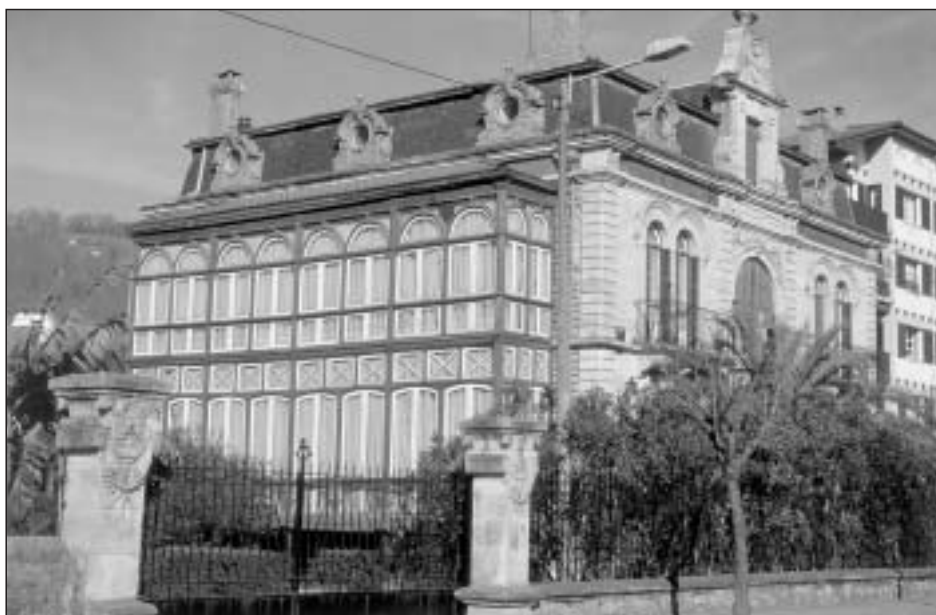
Lám. 15. Bera de Bidasoa. Casa Echandi Enea.

Aunque en menor medida que en el Baztán, también en otros puntos de la geografía navarra la prosperidad en América se manifiesta a través del eclecticismo arquitectónico. Testimonios orales afirman que la compra del terreno y posterior construcción de Echandi Enea en Bera de Bidasoa se financió con capital americano por un baztanés establecido en la localidad. Levantada en torno a 1912, conviven en ella con fortuna soluciones de distintas épocas, pues al tradicional planteamiento italo-francés de muros con sillar almohadillado y cubiertas abuhardilladas se unen influencias neorrománicas en la disposición de los grandes ventanales de medio punto, y neobarrocas en los motivos decorativos que enmarcan el vano central del piso noble y remate, además del enriquecimiento cromático que le proporciona la decoración cerámica en tonos verdes que recorre el friso superior (Lám. 15). El conjunto ofrece asimismo otros elementos de interés, como la magnífica galería acristalada de dos cuerpos que recorre toda la fachada meridional, los escudos empotrados en la norte, o el espléndido diseño modernista de la rejería que cierra el jardín delantero.