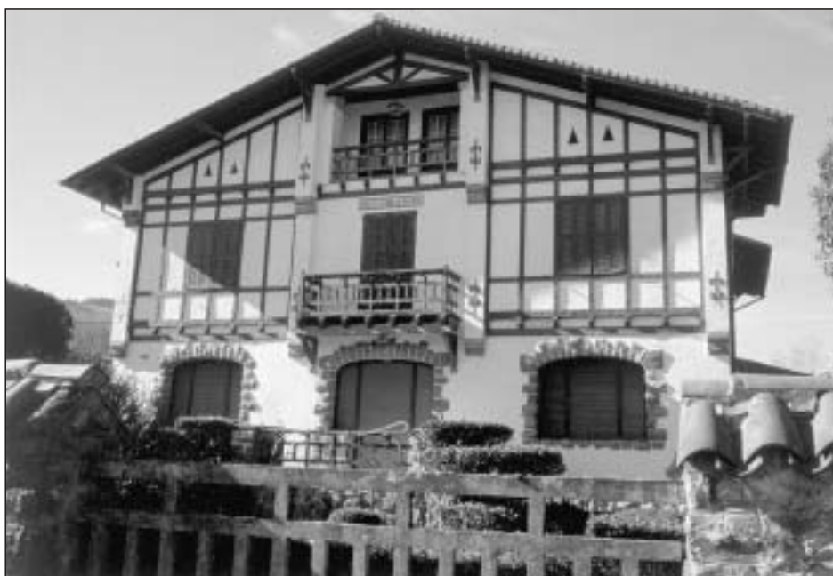
Lám. 9. Bera de Bidasoa. Villa Cruz Alta

También en Bera de Bidasoa el recuerdo de la emigración perdura en su arquitectura civil, caso de Villa Cruz Alta , cuyo nombre rememora la localidad argentina de la provincia de Córdoba en la que hizo fortuna su propietario. Su planteamiento general obedece a las características de la zona patentes en el entramado de madera de la fachada o en la cubierta a doble vertiente; no obstante, algunas soluciones muestran un avance hacia lo pintoresco, caso de los vanos del cuerpo inferior o del balcón que a manera de mirador se abre en el superior sustituyendo al típico balcón corrido (Lám. 9). No lejos de Bera, en Sumbilla, casa Garaicoechea o Indianobaita se reconstruyó con capital argentino tras el incendio que padeció en la segunda mitad del siglo XIX; se muestra como un enorme caserón con tejado a doble vertiente cuya fachada presenta un arco de medio punto de ingreso y vanos adintelados en el segundo nivel y ático, completando el conjunto el escudo de armas familiar (Lám. 10). Y remesas venidas de Cuba hicieron posible la remodelación del denominado Palacio de esta misma localidad, un bloque que despliega en altura tres niveles y culmina en tejado a cuatro aguas con saliente alero de madera labrado y buhardilla central en cada uno de sus frentes.