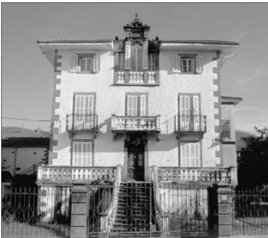
Lám. 14. Elizondo. Casa Justo Enea