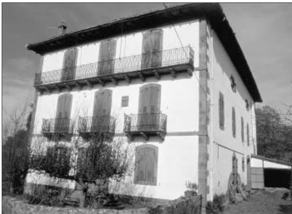
Lám. 6. Errazu. Casa Aldacoechea

de la familia Irigoyen, un bloque cúbico de proporcionadas dimensiones que despliega tres niveles en altura separados por impostas lisas, con una disposición rítmica de tres vanos de arco rebajado por piso; en el primero se dispone la puerta de acceso flanqueada por dos ventanas, en el segundo tres balcones individuales y en el tercero un balcón corrido (Lám. 6).