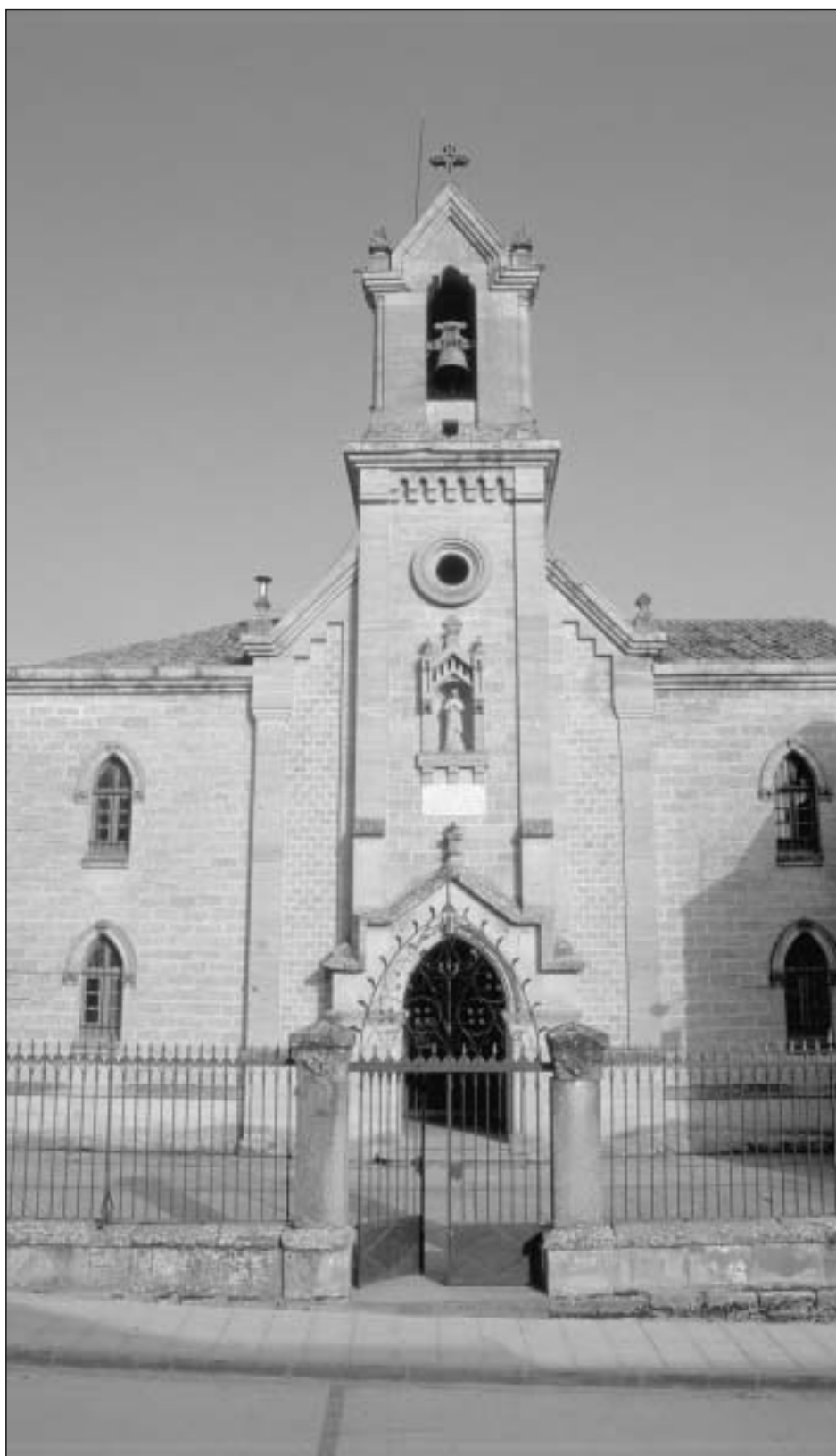
Lám. 2. Bearin. Parroquia de María Inmaculada