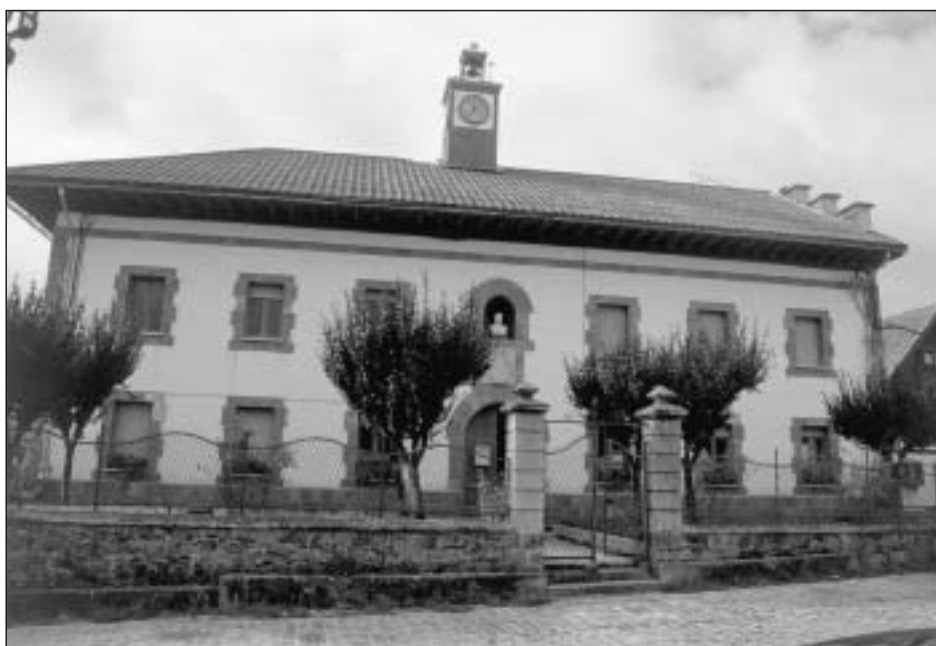
Lám. 30. Garayoa. Casa Consistorial.