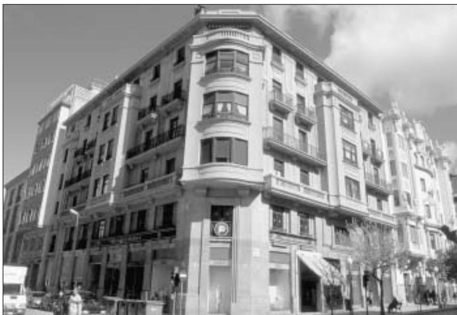
Lám. 17. Pamplona. Edificio de Carlos III, nº 7

lera principal desde cuya posición central actuaba como distribuidor de espacios; dos patios laterales flanqueaban la escalera, en tanto que cerraban el edificio un pórtico trasero abierto a un jardín y un garaje. El conjunto, que respetaba la elevación media de unas cinco plantas prevista para toda la zona, alcanzaba una altura total de 20'50 metros hasta la línea de cubiertas.