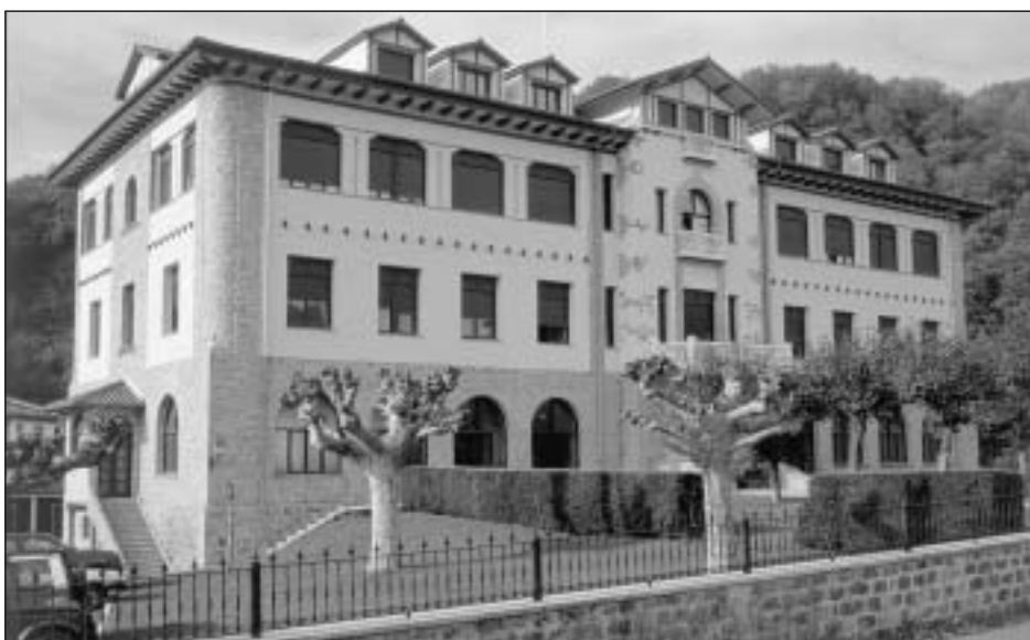
Lám. 28. Oronoz-Mugaire. Colegio de Nuestra Señora del Carmen (actual edificio de viviendas).