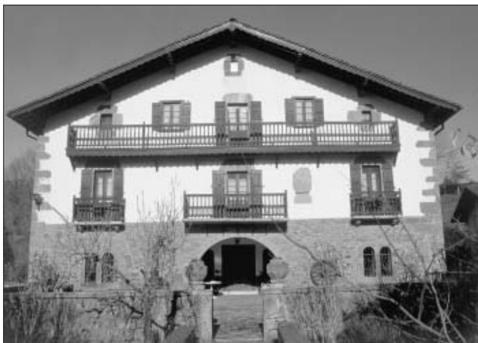
Lám. 5. Arizcun. Casa Latadia

chada principal desarrolla en altura un gorape o porche inferior enmarcado por dos ventanas bíforas, tres balcones en el segundo nivel y balcón corrido en el superior, culminando el conjunto un tejado a doble vertiente; sus paramentos combinan los muros enlucidos con el sillar rojizo característico de la zona. Digno de mención es el trabajo de madera recortada que decora tanto el balcón superior como el alero de la casa, motivo importado de los chalets suizos y saboyanos que se puso de moda durante el Segundo Imperio y cuya presencia constata Caro Baroja desde la segunda mitad del siglo XIX en diversas localidades del Bidasoa, si bien la fragilidad material de estas decoraciones ha provocado que muchas hayan desaparecido o estén a punto de hacerlo 68 . Rasgo peculiar resulta el mirador adosado a una de las fachadas laterales, un bloque prismático de dos niveles de altura con vanos adintelados que vincula el edificio con soluciones características del momento en que se levantó.