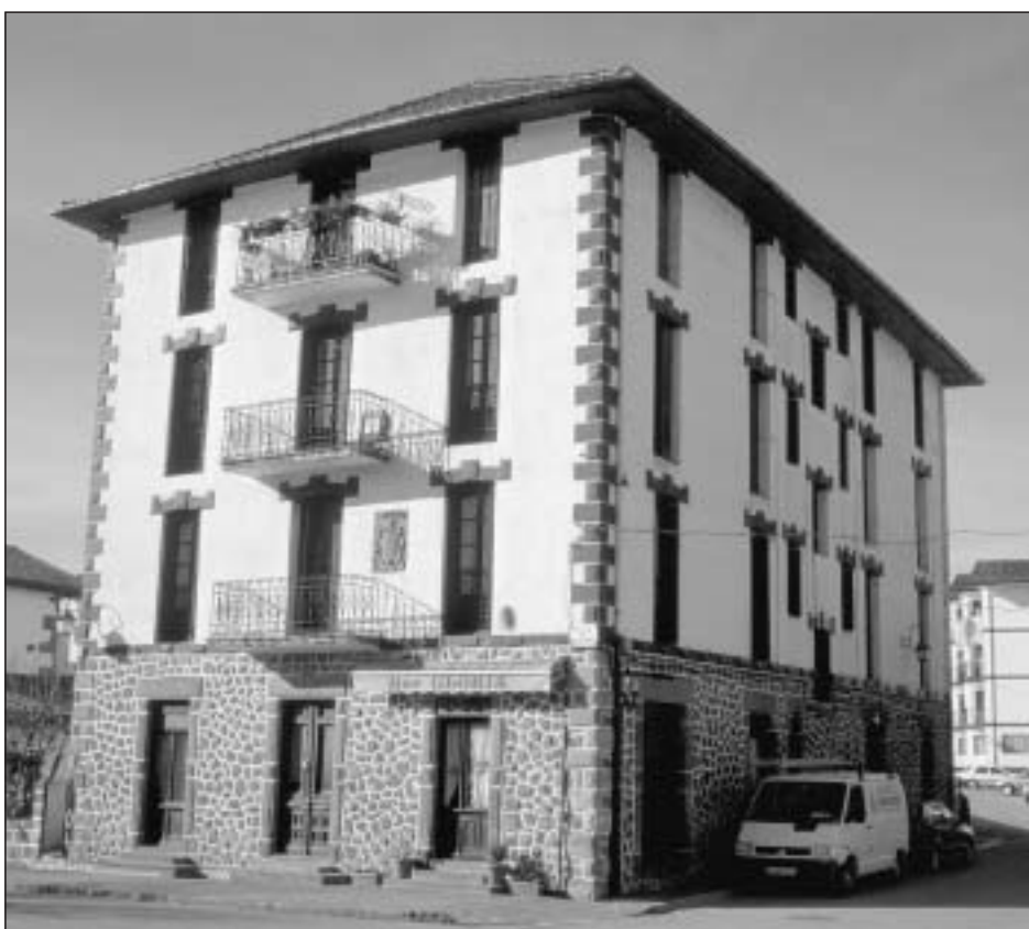
Lám. 8. Elizondo. Casa Leku-Eder o Perochena