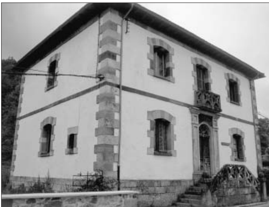
Lám. 26. Garralda. Escuelas