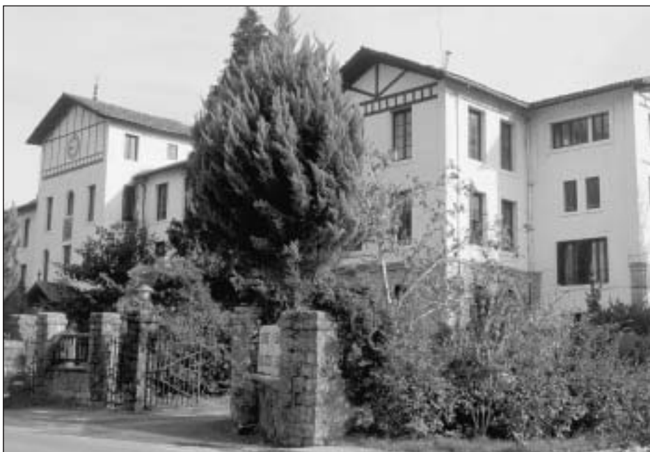
Lám. 27. Oronoz-Mugaire. Colegio de San Martín. Fachada principal

diocesana en tareas tanto de formación de niñas como de cuidado de ancianos en asilos y hospitales. Habilitado en la actualidad como un bloque de 22 viviendas y apartamentos que mantiene en el nombre el recuerdo a su fundadora, se configura como un edificio ecléctico de gran prestancia con un nivel inferior de arcadas de medio punto con ventanas, culminando en una cubierta con mansardas (Lám. 28). En el conjunto de la fachada adquiere especial protagonismo la parte central, algo avanzada y de mayor altura que el resto, finalizada en tejado a dos aguas; en ella se practica la puerta de ingreso entre columnas sobre las que descansa un balcón que la resguarda.