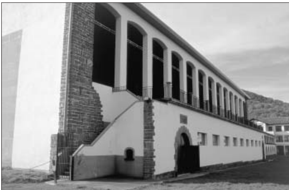
Lám. 31. Oronoz-Mugaire. Frontón Santiago

pórtico de ingreso concebido a modo de arco triunfal, con un arco de medio punto y encima un blasón inscrito en un edículo en cuyo campo reza con grandes mayúsculas: “D. José de Irigoyen y Echartea, hijo de Aldacoechea, costeó la ampliación y el ornato de este cementerio en 1912”. Una cruz remata la estructura. El propio promotor de la obra descansa en un panteón que da cuenta de su muerte en 1938. Un año más tarde se bendecía el nuevo cementerio de Oronoz y la capilla del panteón de la familia Urrutia emplazada en el mismo que había contribuido a sufragar.