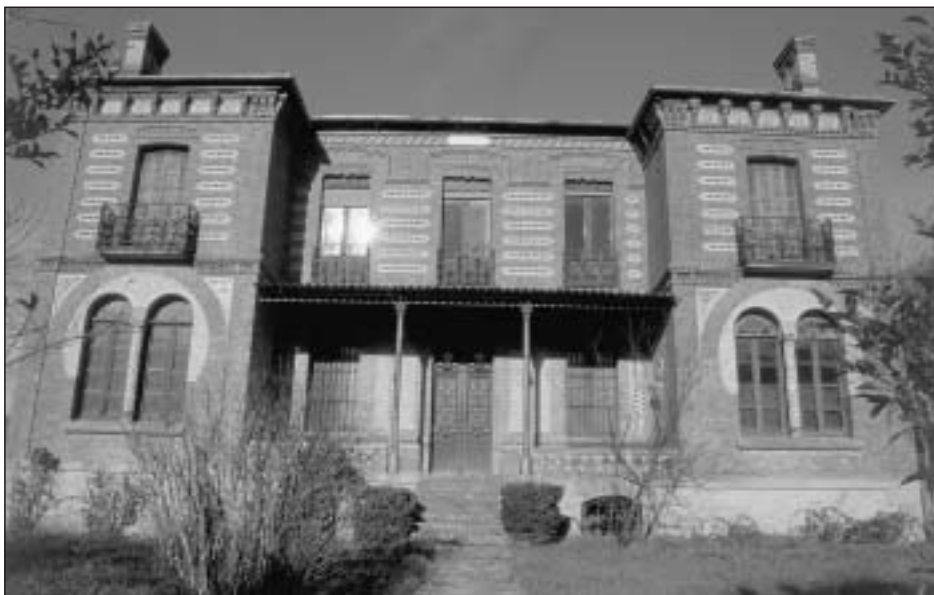
Lám. 16. Murillo de Lónguida. Villa Lónguida o Casa del Americano

que recrea el empleo de ladrillo mediante taqueados o con su disposición saliente en punta, de manera que el conjunto puede ponerse en contacto con algunos proyectos catalanes y aragoneses de finales del siglo XIX interpretados en clave neomudéjar como el pabellón árabe de los baños de Alhama de Aragón (Zaragoza). Villa Lónguida se convierte así en una de las mejores muestras de arquitectura pictórica o cromática de Navarra.