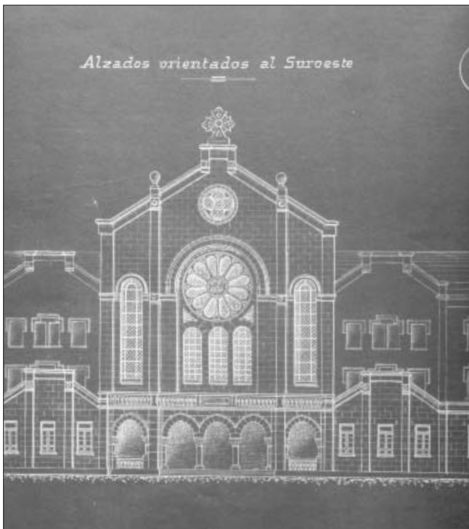
Lám. 29. Pamplona. Proyecto de Serapio Esparza para las Escuelas Salesianas. Iglesia. Fachada.

tribuciones originales, pero que respetó los muros principales con sus huecos 88 . De igual forma, varios vecinos de Bera de Bidasoa establecidos en Indias donaron cantidades para la construcción de una casa de Misericordia y Hospital cuya inauguración tuvo lugar el 1 de junio de 1883 89 . Y los americanos baztaneses contribuyeron con sus donativos al mantenimiento de la Casa de Misericordia del Valle emplazada en Elizondo.