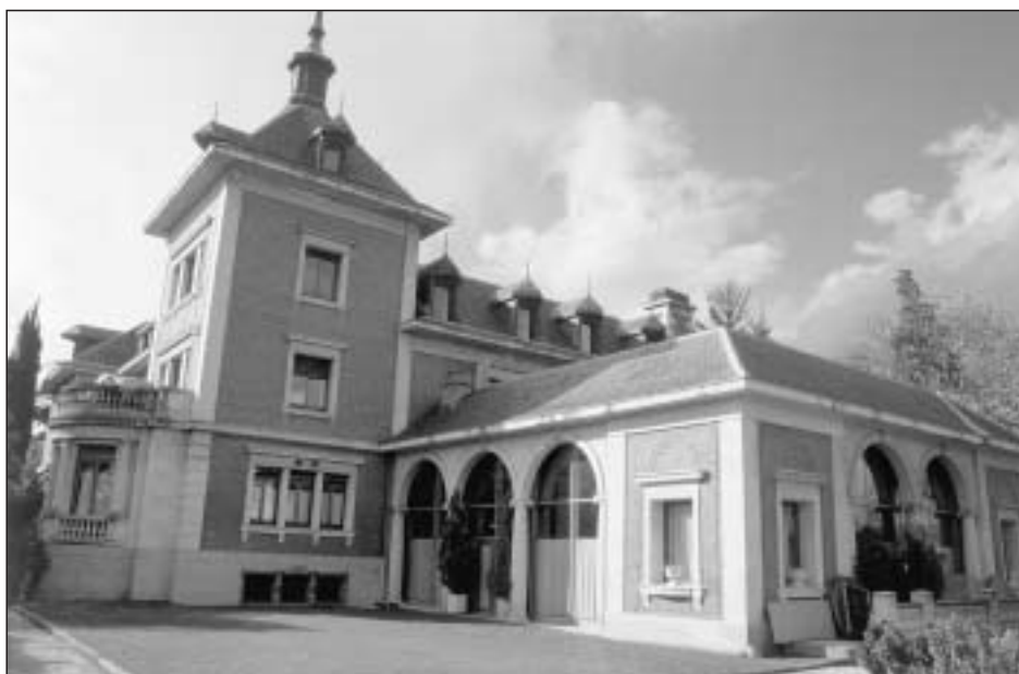
Lám. 20. Pamplona. Chalet de Izu