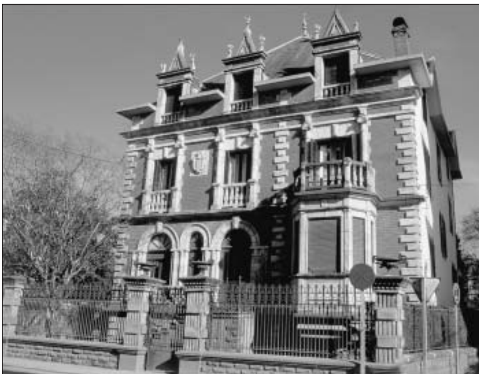
Lám. 12. Elizondo. Casa Manuelenea