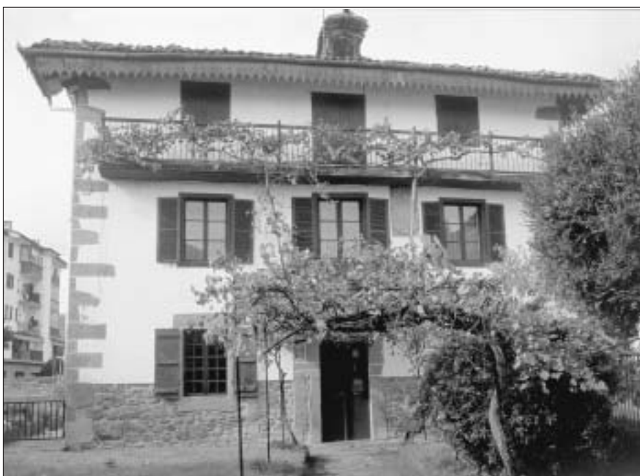
Lám. 7. Elizondo. Casa Martindenea