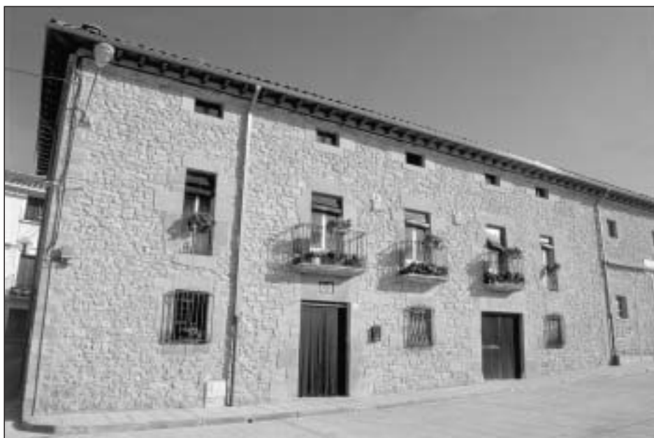
Lám. 1. Bearin. Casa señorial.