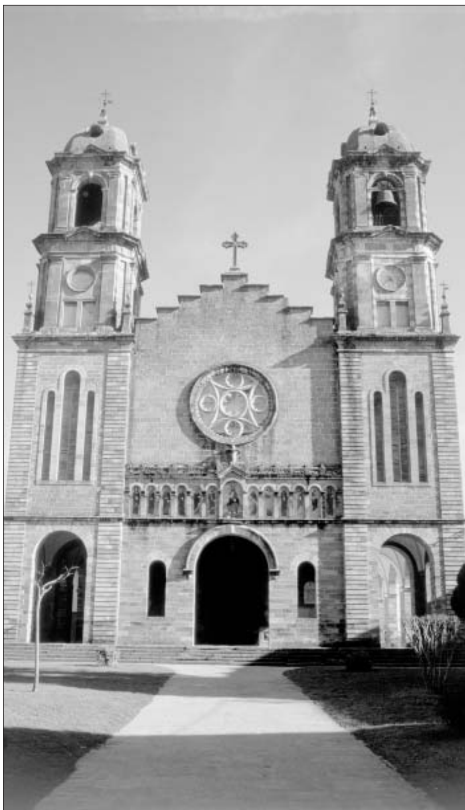
Lám. 4. Elizondo. Parroquia de Santiago