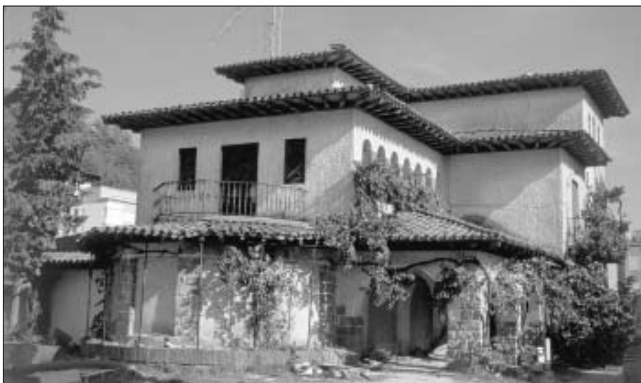
Lám. 19. Huarte. Villa Teresa. Víctor Eusa