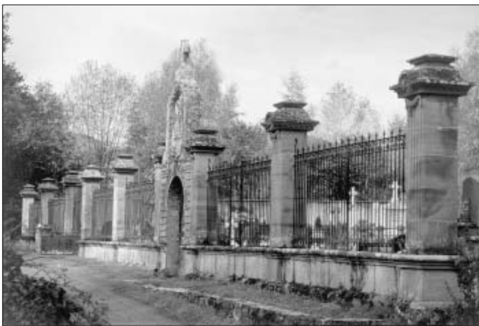
Lám. 32. Errazu. Cementerio