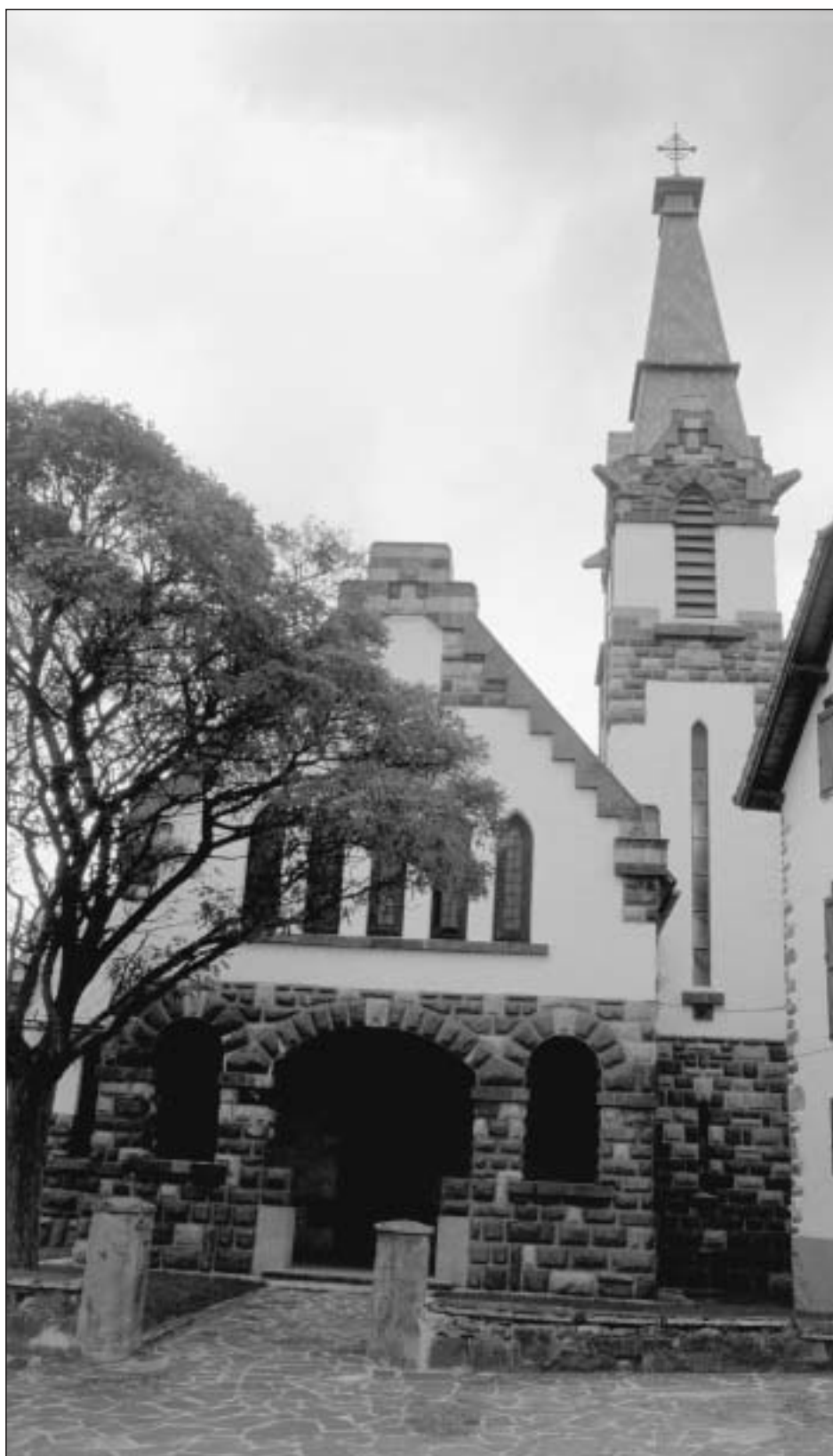
Lám. 3. Garralda. Parroquia de San Juan Bautista