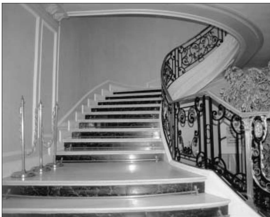
Lám. 24. Pamplona. Chalet de Izu. Escalera interior