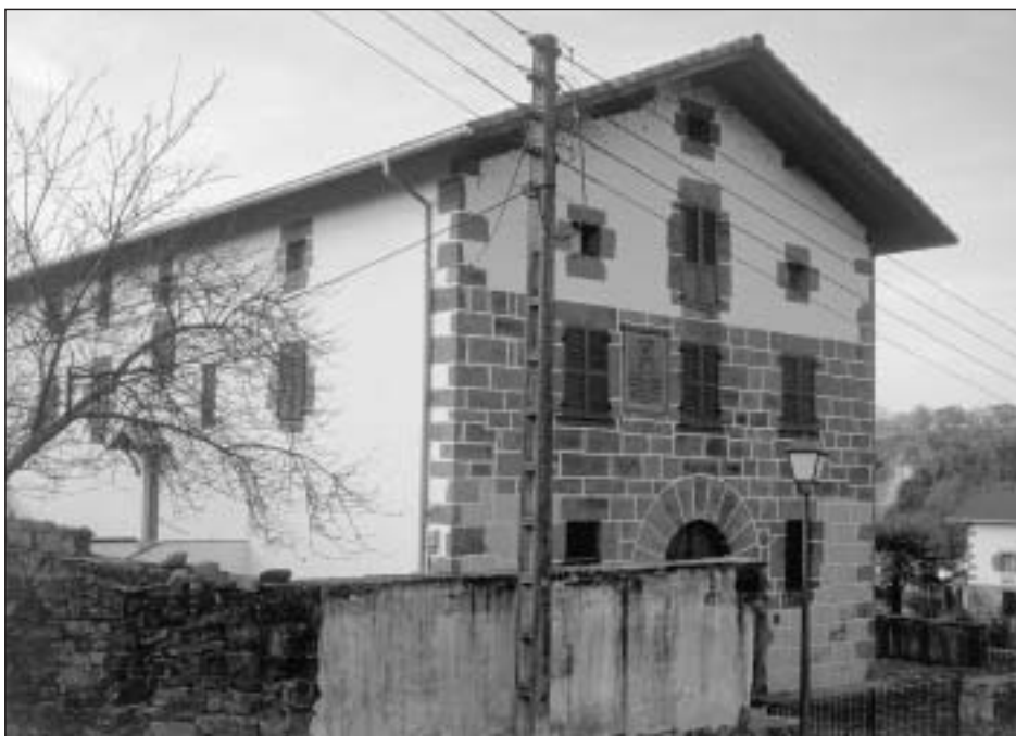
Lám. 10. Sumbilla. Casa Garaicoechea o Indianobaita