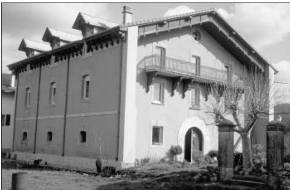
Lám. 11. Leazkue. Casa Beltrarena