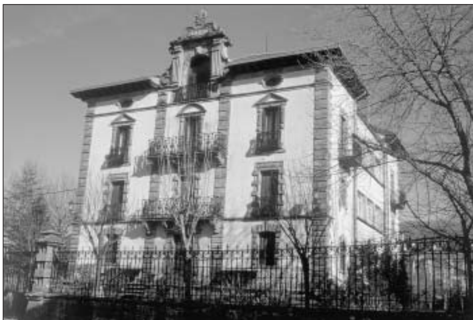
Lám. 13. Elizondo. Casa Paularena