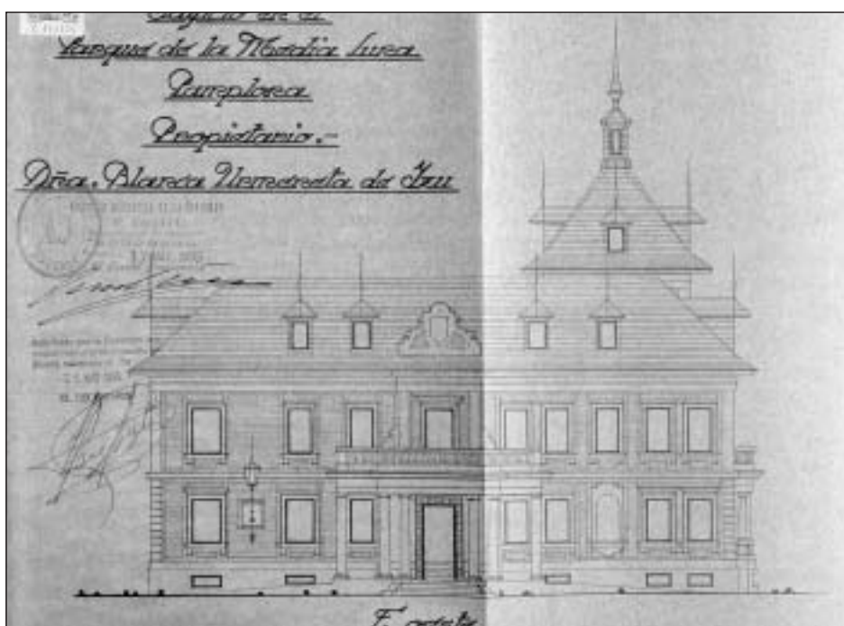
Lám. 23. Pamplona. Chalet de Izu. Fachada oeste