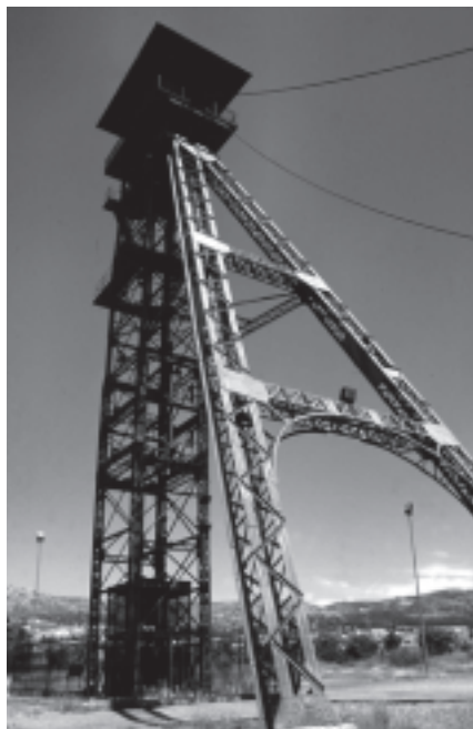
Fotografía 2. Castillete del Pozo Norte en Puertollano